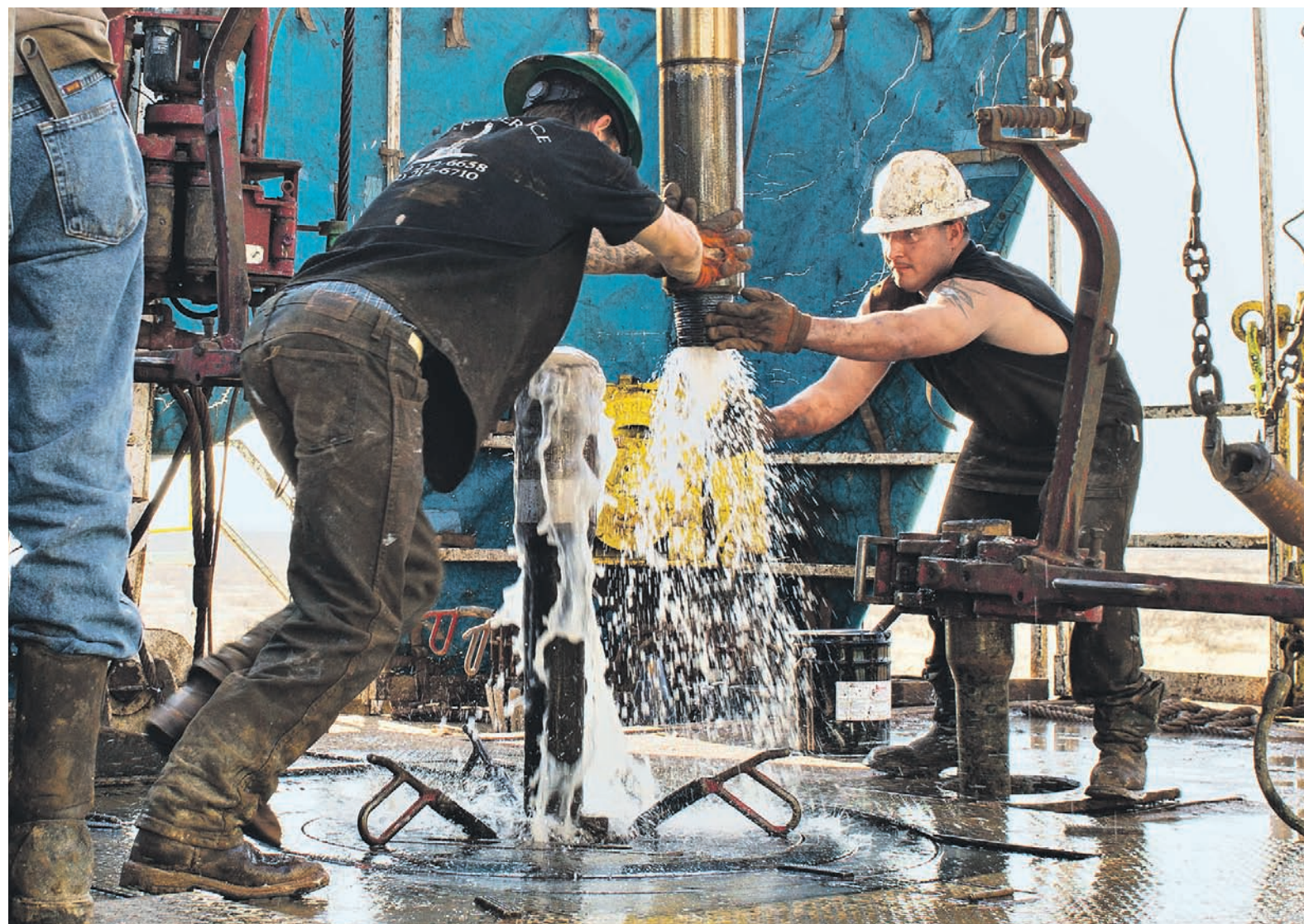
В США за последние два года время строительства скважин и их себестоимость сократились, поэтому добыча сланцевой нефти находится на низком старте в ожидании роста цен, считает эксперт

28 сентября страны ОПЕК договорились о снижении добычи нефти до 32,5–33 млн барр. в сутки (в сентябре, по данным МЭА, суточная добыча ОПЕК составляла 33,64 млн барр.). Компромисса об ограничении добычи членам картеля удалось достичь впервые с 2008 года. Это значит, что ОПЕК «фактически отказалась» от эксперимента со свободным ценообразованием на рынке нефти, продолжавшегося