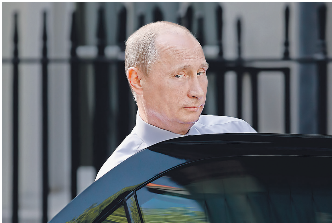
Планировалось, что Владимир Путин (на фото) и Франсуа Олланд примут участие в открытии Русского духовно-культурного центра в Париже. Однако президент Франции отказался участвовать в этом мероприятии

Собеседник, близкий МИД России, в беседе с РБК подчеркнул, что французская сторона сама приглашала российского президента, программа визита была согласована, но в последний момент «французы стали ее сужать». В частности, в ходе визита президенты России и Франции должны были торжественно открыть в Париже Русский духовно-культурный центр. Однако французский лидер отказался от участия в мероприятии. Российской стороне было предложено ограничиться переговорами глав государств. «Так с нами поступать нельзя», — заявил собеседник РБК, отметив, что после этого Кремль принял решение отказаться от поездки.