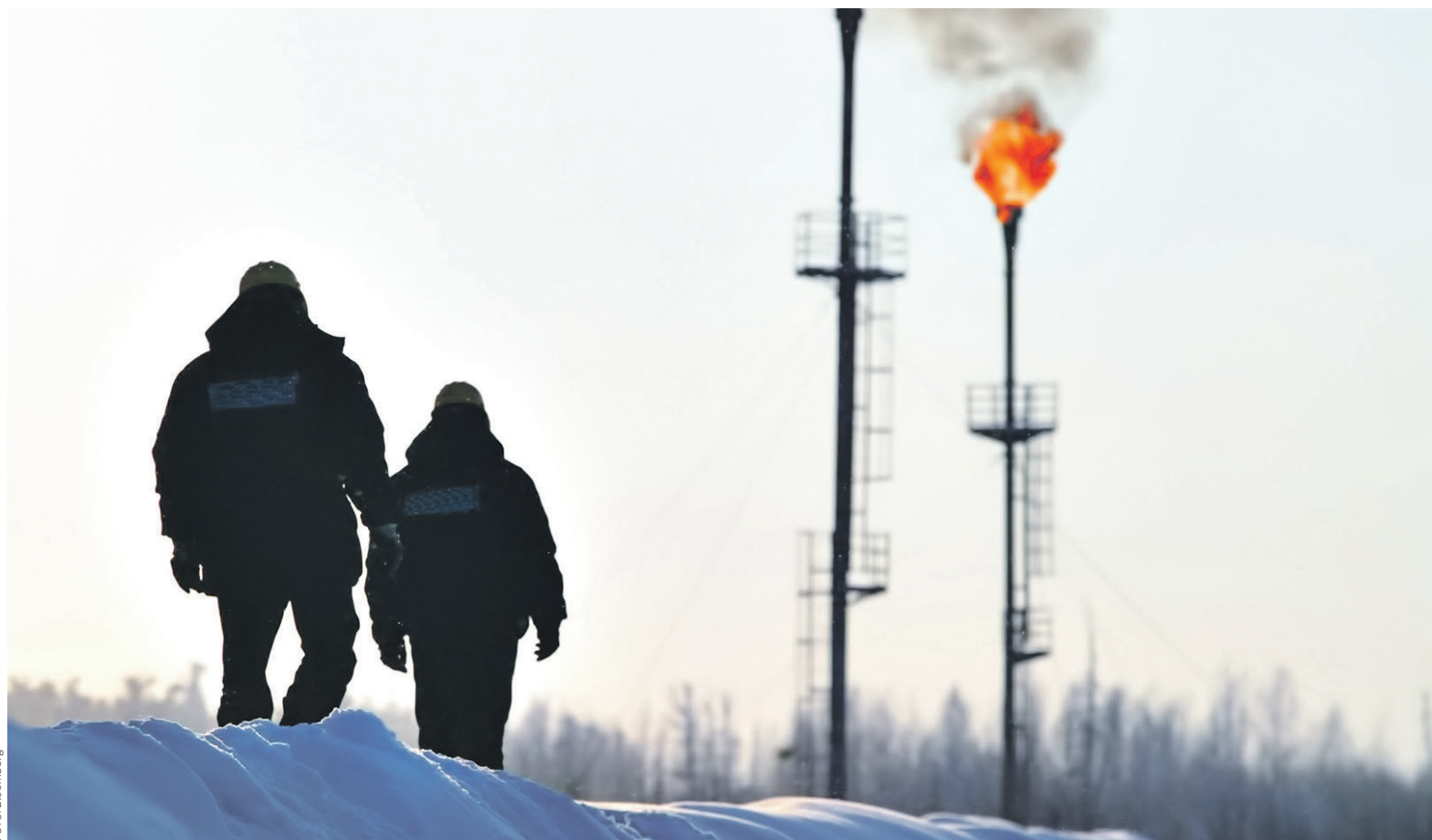
Борулахский нефтегазовый участок привлекателен тем, что мимо него проходит нефтепровод Восточная Сибирь — Тихий океан, по которому нефть направляется в Китай, и рядом должен пройти газопровод «Сила Сибири»

Министр природных ресурсов Сергей Донской подтвердил РБК через представителя, что «УДС-Энерджи» отказалась выплатить разовый платеж по итогам аукциона. Донской отметил, что у государства останется задаток в размере 17 млн руб., выплаченный этой компанией, так как по условиям торгов он не возвращается. По его словам, аукцион будет проведен повторно в 2017 году.