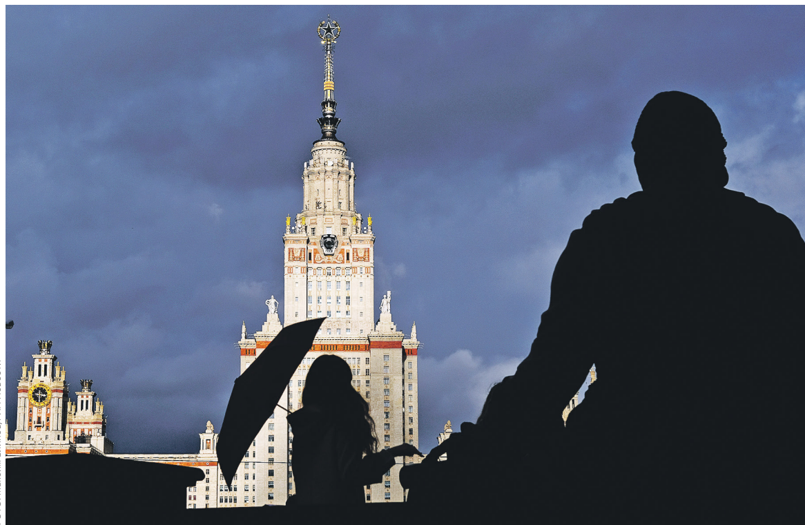
В 2014 году МГУ размещался на десятой позиции, в 2015-м — на пятом месте, в 2016 и 2017 годах был в тройке лидеров рейтинга

По мнению ректора МГУ Виктора Садовничего, университету удалось достичь высокой позиции за счет своих проектов. «Среди наиболее значимых мегапроектов — создание банка-депозитария живых систем «Ноев ковчег», где ведется работа с материалом всех возможных типов, реализация исследований в области квантовых технологий, построение су-