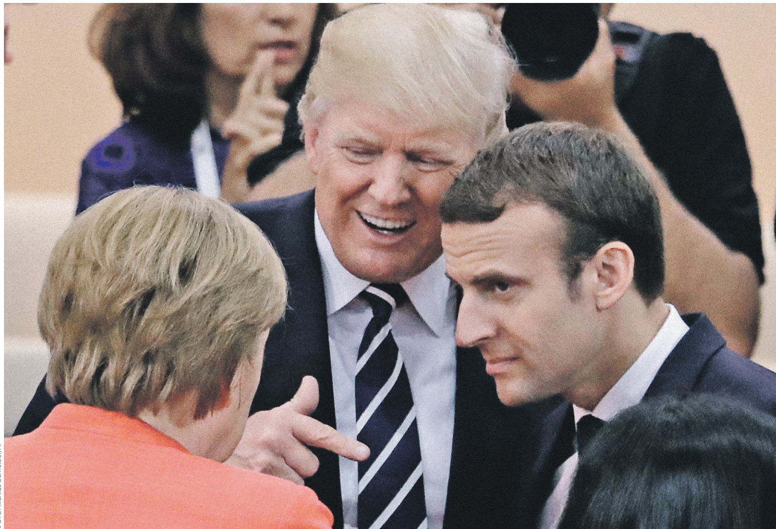
Президент Франции Эмманюэль Макрон (справа) и канцлер Германии Ангела Меркель (слева) пытались убедить Дональда Трампа не выходить из сделки, предлагали разработать дополнительное соглашение, но их попытки не увенчались успехом