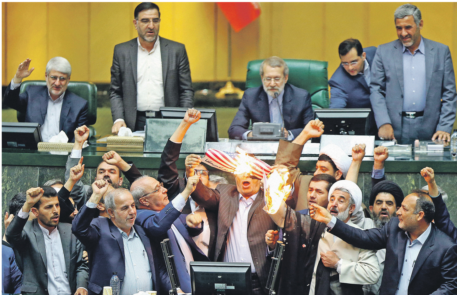
9 мая иранские парламентарии сожгли американский флаг и копию СВПД после того, как Дональд Трамп объявил о выходе США из ядерной сделки с Ираном

Действие американских санкций против Ирана будет возобновлено в срок до полугода (от 90 до 180 дней), заявили в Министерстве финансов США. В частности, с 6 августа вновь будет действовать ограничение на покупку долларов иранским правительством, возобновятся ограничения на торговлю Ирана золотом и другими драго-