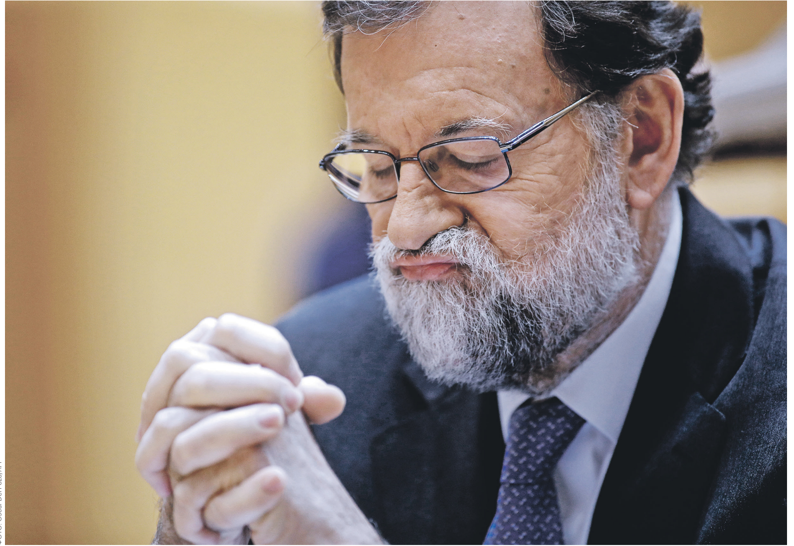
Отправленный в отставку премьер Испании Мариано Рахой (на фото) в последние годы руководил правительством меньшинства. Кабинет его преемника Педро Санчеса с большой вероятностью также будет нестабильным

По данным следствия, которое занималось делом с 2009 года, речь идет о масштабной «теневой» системе, включавшей взятничество, нелегальное финансирование политиков и уход от налогообложе-