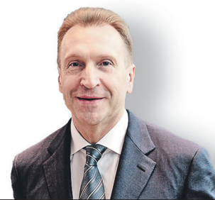
Игорь Шувалов, председатель Внешэкономбанка

ЕЖЕДНЕВНАЯ ДЕЛОВАЯ ГАЗЕТА 4 июня 2018 Понедельник № 97 (2821)