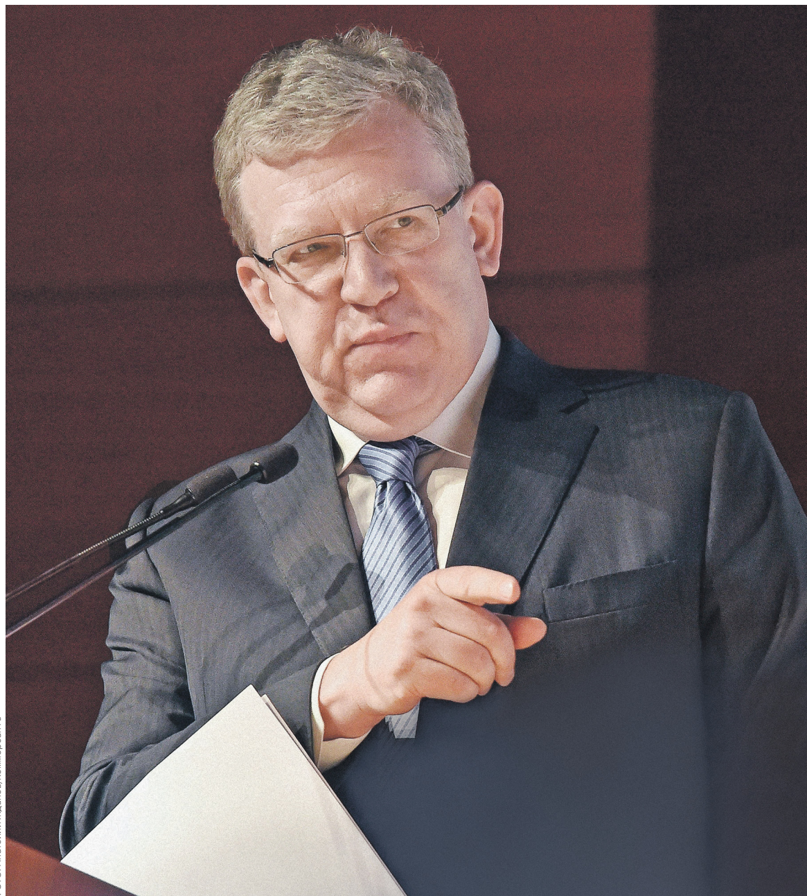
Заключение Счетной палаты, подписанное ее новым председателем Алексеем Кудриным, завершается выводом о непрозрачности формирования доходной базы бюджета

Подведомственное Минэкономразвития Росимущество для оценки поступления дивидендов в бюджет в 2018 году (по итогам деятельности компаний в 2017 году) использовало прогнозные данные самих госкомпаний, предоставленные по запросу, или данные по выплаченным в бюджет 2017 года промежуточным дивидендам, говорится в заключении СП. При этом Минфин не представил собственные расчеты по уточненному прогно-