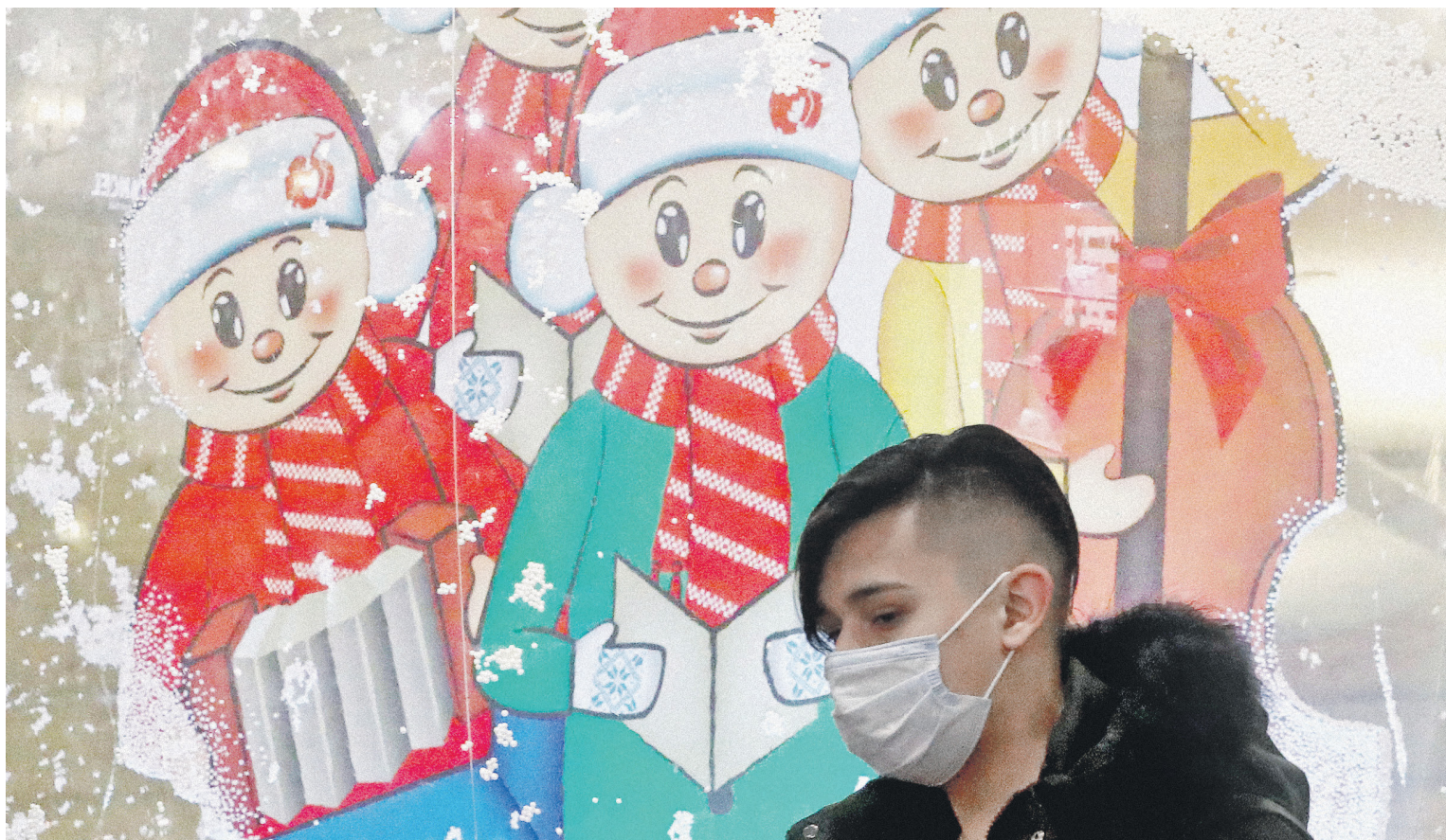
Сокращение денежных доходов — главная проблема, которая тревожит сейчас россиян, отметили в исследовании экономисты ВШЭ