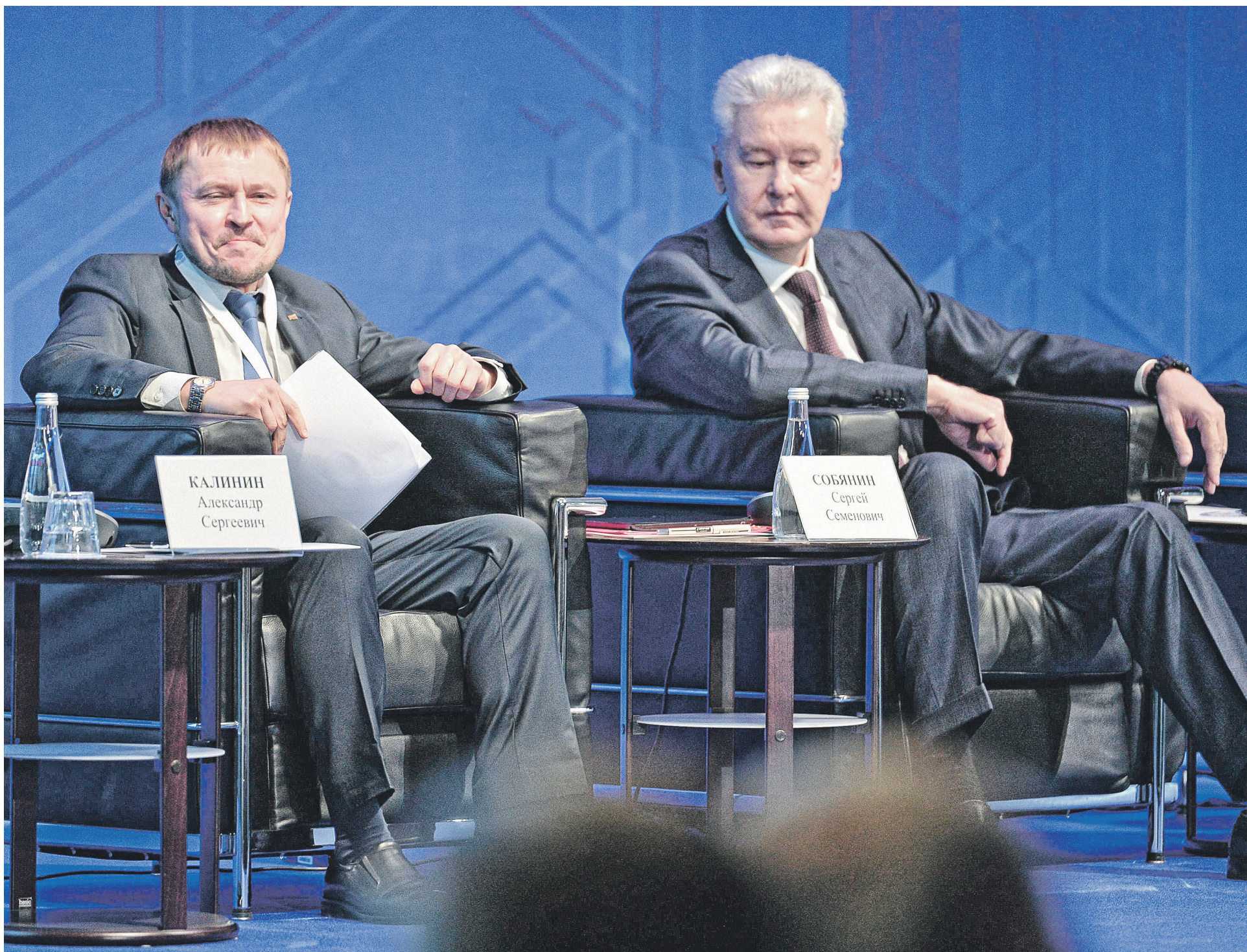
«Опора России» пытается убедить московскую мэрию, что расчет налога от кадастровой стоимости в условиях пандемии экономически несправедлив. На фото: президент «Опоры России» Александр Калинин и мэр Москвы Сергей Собянин