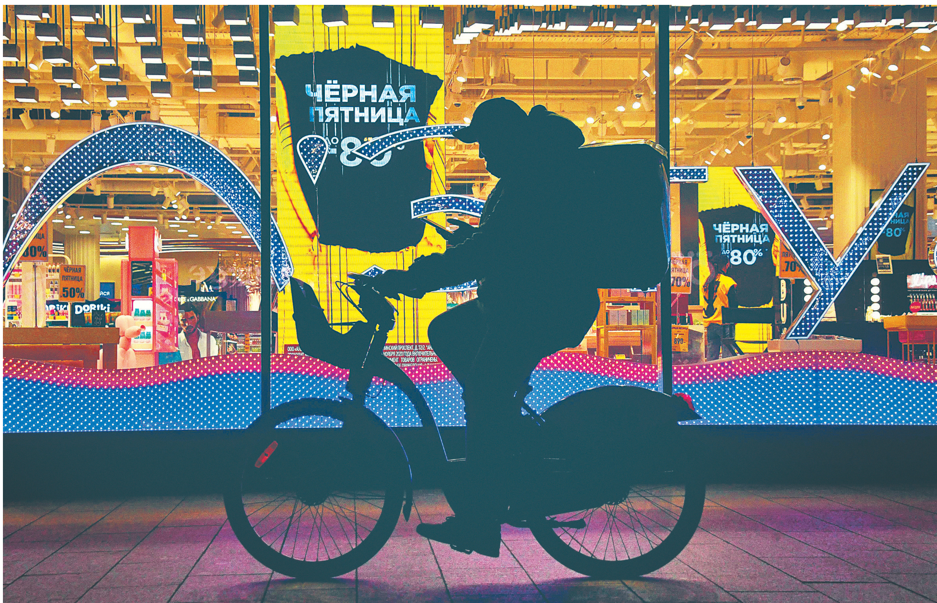
Фото: Александр Казаков/Коммерсантъ

Источник: ФНС, данные на 1 декабря 2020 года