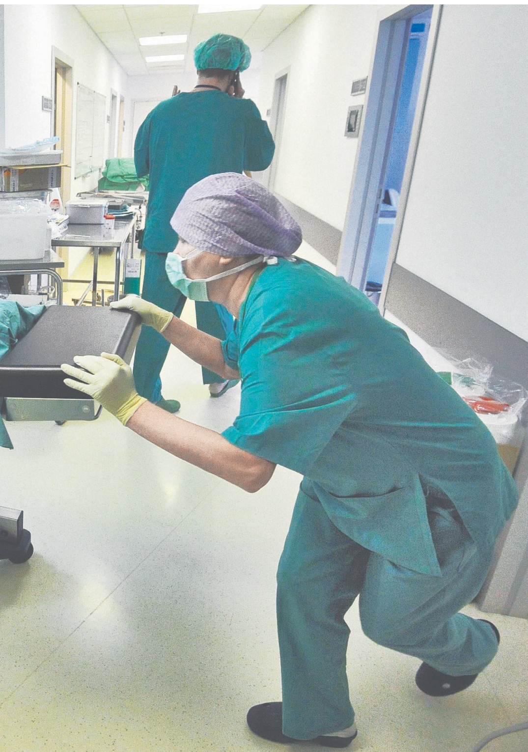
← Европейский медицинский центр, по данным Росздравнадзора, оказывал услуги репродуктивных технологий в 24 случаях, когда их заказчиком был одинокий мужчина

Ранее в Минздраве РБК подчеркивали, что не выступают против суррогатного материнства для иностранцев. «И заказчиками, и суррогатными матерями могут выступать как россияне, так и граждане иностранного государства. Дополнительное регулирование медицинской составляющей в контексте суррогатного материнства не требуется», — указывали тогда в министерстве.