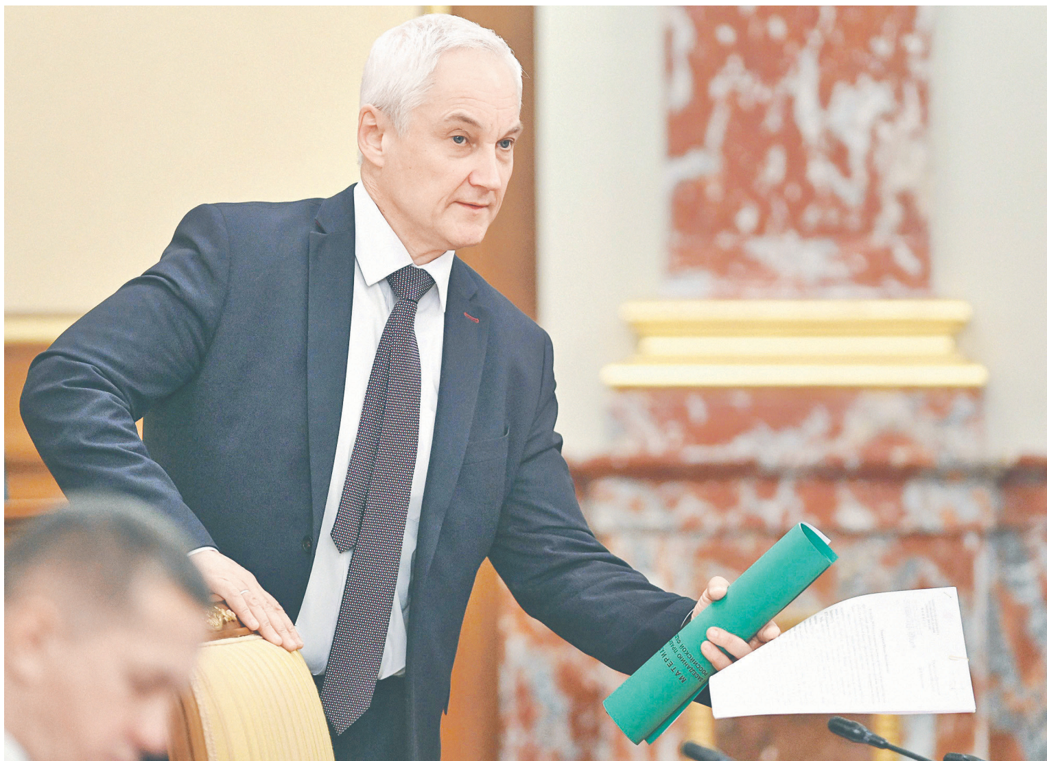
Решение рекомендовать предельные цены на сахар и подсолнечное масло было принято на срочном совещании у первого вице-преьера Андрея Белоусова (на фото), рассказали источники РБК