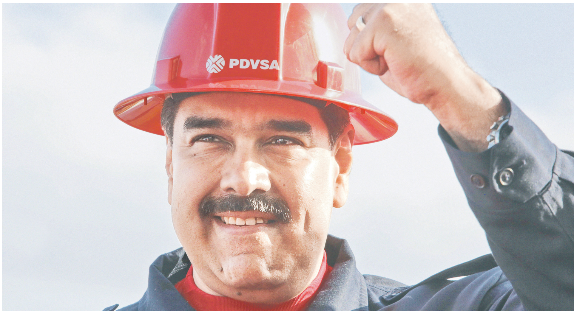
После введения американских санкций против режима венесуэльского президента Николаса Мадуро госкомпания PDVSA начала искать обходные пути торговли нефтью