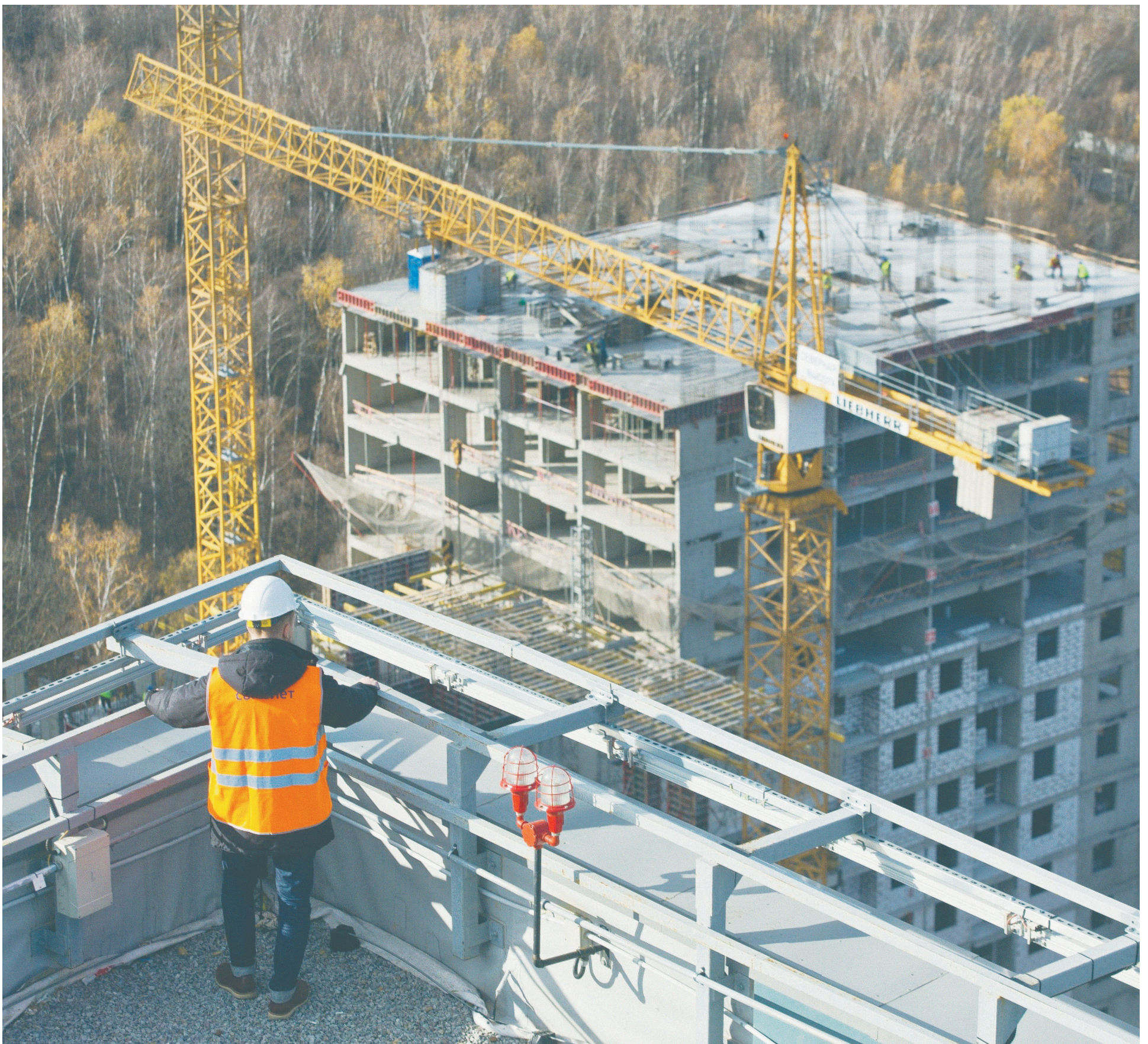
Группа «Самолет», по данным единой информационной системы жилищного строительства, возводит 1,26 млн кв. м жилья в Москве и Московской области