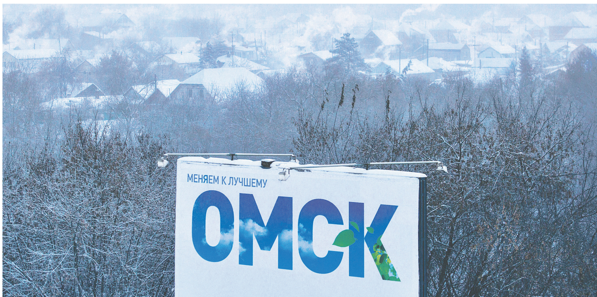
Среди крупнейших российских городов эксперты КБ «Стрелка» признали Омск самым уязвимым к пандемическому кризису