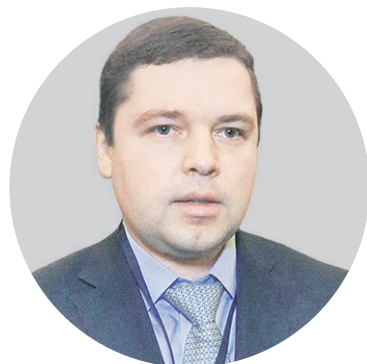
Бывший директор департамента химико-технологического комплекса и биоинженерных технологий Минпромторга Владимир Потапкин

“ Говоря о займах, которые предполагалось брать у главы «Азия леса», Владимир Потапкин заявил, что не знает точно, на что именно юрист одалживал деньги, но «уверен, что на азартные игры»