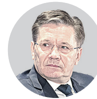
АЛЕКСЕЙ ЛИХАЧЕВ, генеральный директор «Росатома»

«Росатом» возьмет в управление порт FESCO на Дальнем Востоке