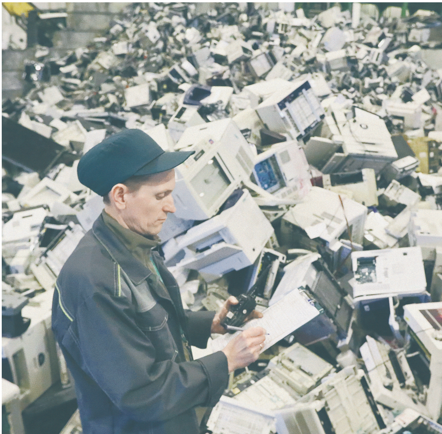
Возврат экологического сбора через субсидию Минфин предлагает предоставлять исходя из затрат на утилизацию отходов

Минфин предложил КОМПЕНСИРОВАТЬ импортерам экологический сбор, который они будут платить при ввозе товаров в Россию. Но для этого они ДОЛЖНЫ БУДУТ САМОСТОЯТЕЛЬНО УТИЛИЗИРОВАТЬ использованные товары.