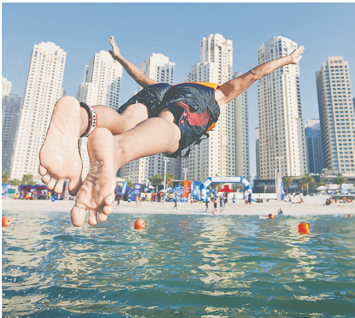
Объединенные Арабские Эмираты традиционно пользуются популярностью у российских туристов в период новогодних праздников

Пандемия резко сократила количество вариантов для тех, кто привык встречать НОВЫЙ ГОД ЗА ГРАНИЦЕЙ . РБК собрал актуальную информацию о возможных поездках по наиболее массовым ЗИМНИМ НАПРАВЛЕНИЯМ .