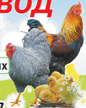
ООО «Животное»: ОГРН 114-43-0063399 г. Киров, пос. Оздоровский, ул. Госпитальная, д. 4

г. Киров, ул. Производственная, 35, т. 49-30-49, 8-912-722-22-27