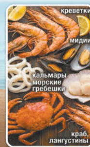
креветки, мидии, кальмары, морские гребешки, краб, лангустины