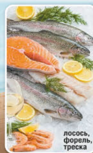
лосось, форель, треска

«Пусть каждый ваш ужин будет гастрономическим путешествием к морским берегам!»