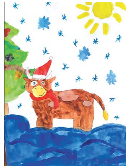
Рисунок — «Бычок — Санта».