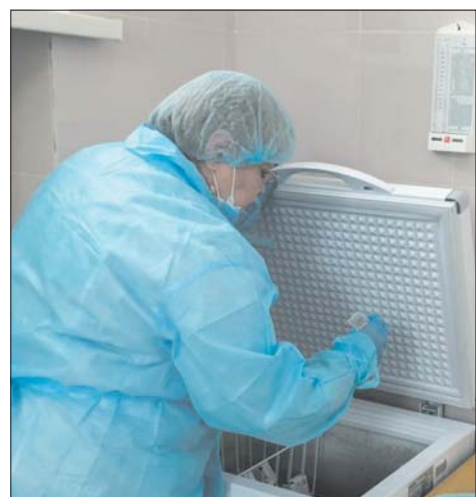
Вакцина хранится в холодильнике при температуре -29 градусов.