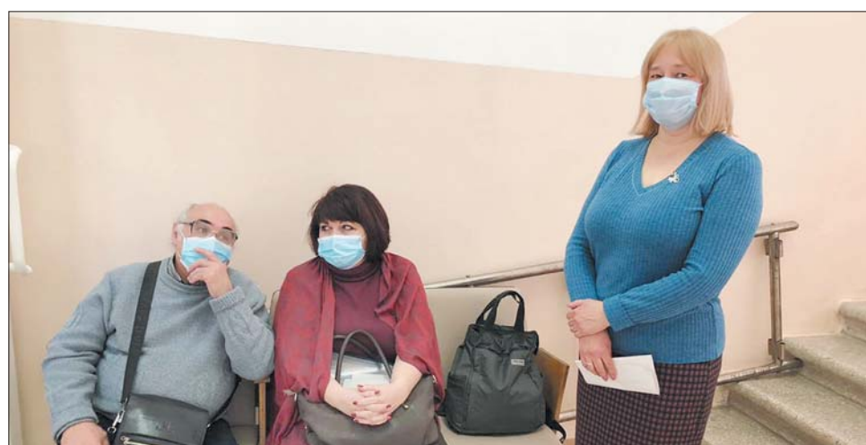
На вакцинацию в первую очередь отправились нынешние и бывшие работники образования.