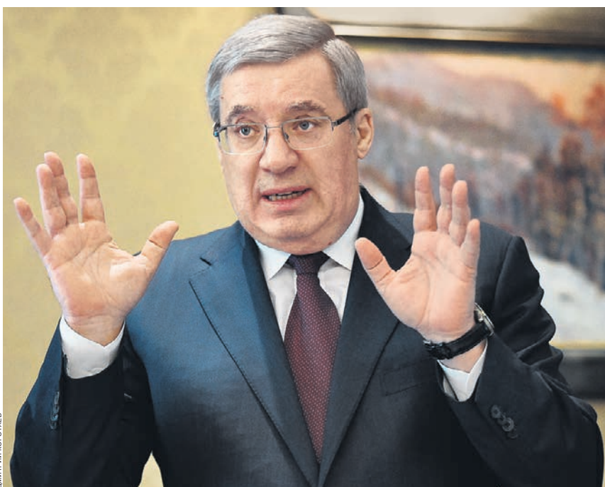
Рамазан Абдулатипов (слева) и Виктор Толоконский решили уйти в отставку по своему сценарию

Виктор Толоконский не стал дожидаться указа и о своём уходе объявил сам на встрече с членами красноярского правительства, депутатами, руководителями органов госвласти. «Я ухожу. И даже уезжаю. Я не бросал никогда начатые дела. Сейчас есть сожаление, что не все проекты реализованы до конца», — сказал он, не объяснив причин своего решения. Вскоре его примеру последовал глава Дагестана Рамазан Абдулатипов, объявивший о своём уходе в эфире радиостанции «Говорит