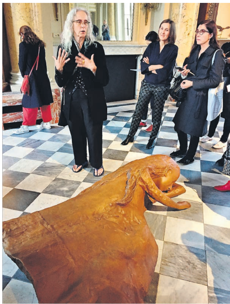
Кики Смит, которая привезла в Париж женщин и зверей, любит говорить о теле, своем и метафорическом

Огромный вестибюль с черными квадратами старинной плитки на полу — начало выставки. Здесь не установлены, а положены скульптуры: женщины в обнимку со зверями, девушка с барашком, пристроившимся на ее бедре. Очень похоже на надгробия, от старости ушедшие в мраморный пол, как в землю. Маленькие скульптуры выставлены в витринах. На них звери то ласкаются, то вцепляются в горло, в общем, ведут себя с женщинами по-мужски.