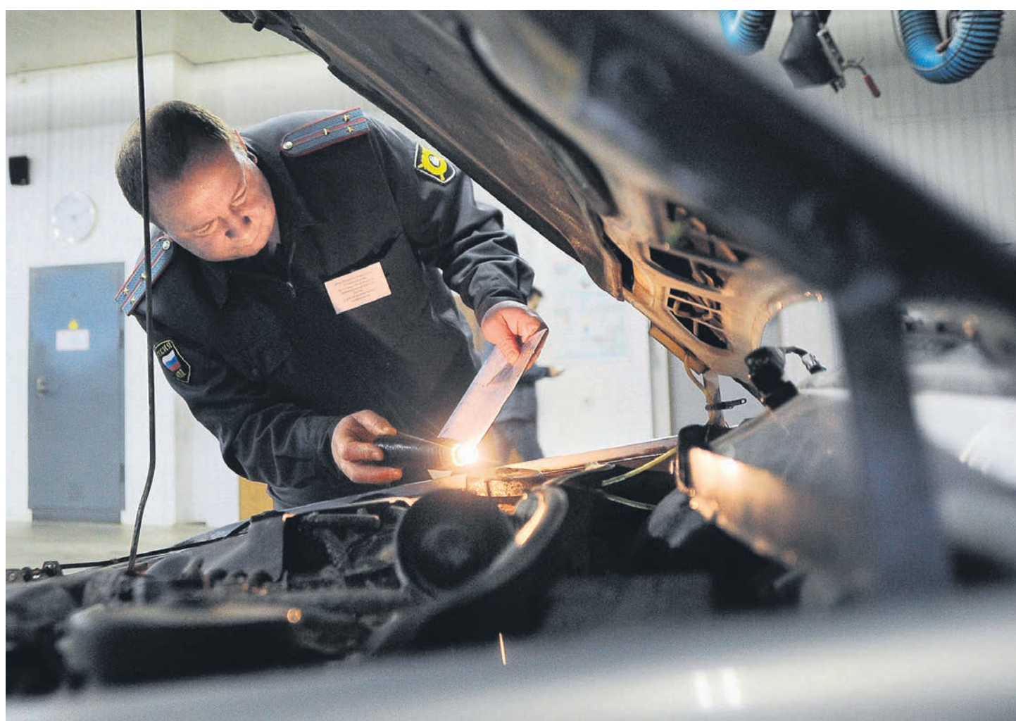
В затянувшихся спорах вокруг перспектив электронных ПТС появился новый аргумент — серьезный риск мошенничеств

Анонсированной целью системы электронных паспортов (СЭП) было формирование единой и полной базы автомобилей