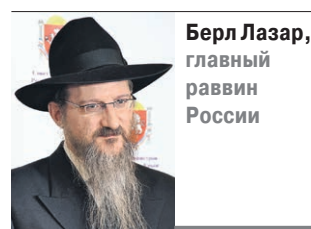
Берл Лазарь, главный раввин России