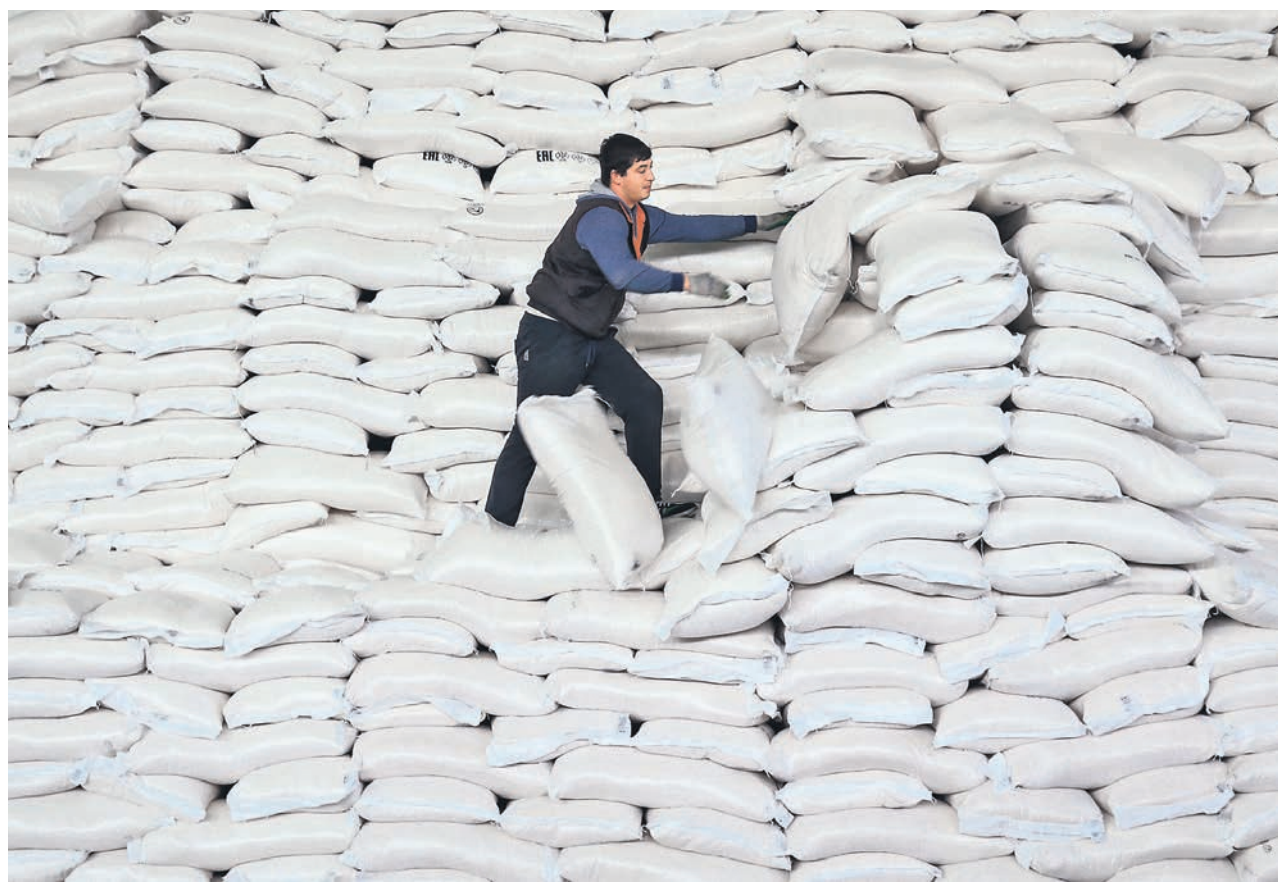
Власти ищут новые способы стабилизации рынка сахара, в том числе через интервенционный фонд, но на рынке скептически оценивают их перспективы.

Правительство рассматривает новые меры регулирования рынка сахара. Речь идет о создании интервенционного фонда, а также об утверждении ежегодной квоты для беспошлинного импорта. Об этом заявила заместитель главы Минсельхоза Оксана Лут на совещании с крупными производителями кондитерских изделий и безалкогольных напитков 13 мая. Аудиозапись встречи есть у «Ъ». В Минсельхозе подтвердили, что считают целесообразным формирование запаса сахара для бесперебойных поставок и сохранения стабильных цен на рынке. Но обнуление пошлины на импорт там назвали разовой мерой. В торговом блоке ЕЭК сообщили «Ъ», что к ним пока не поступали официальные пред-