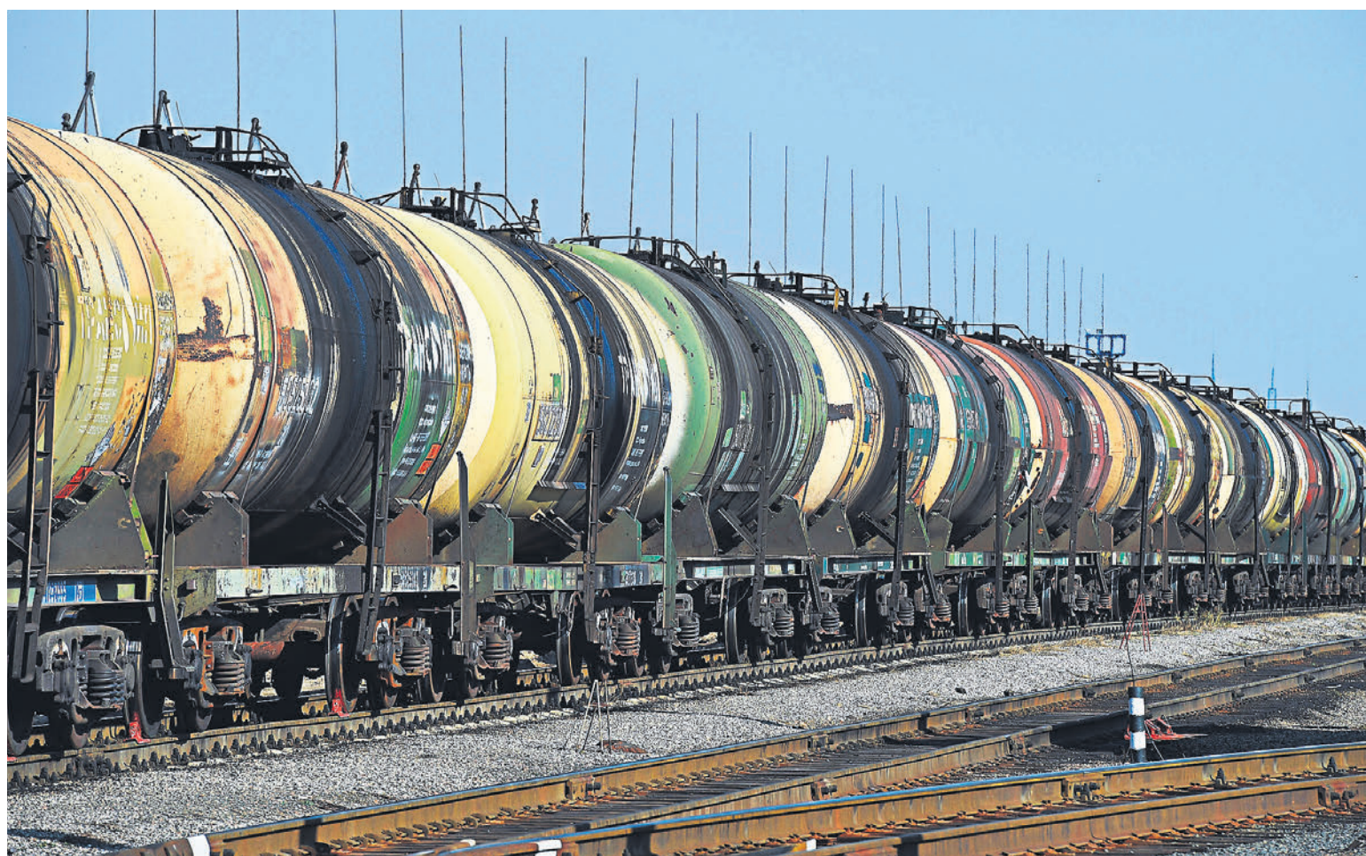
Нефтепродукты мерзнут в очереди на Дальний Восток, вызывая тревогу у производителей и покупателей

Господин Дюков полагает, что «столь значительное накопление груженых вагонов в условиях ограниченности инфраструктуры» угрожает производственной и сбытовой программе компании. Он просит «оперативно» решить проблему, установив ежесуточные