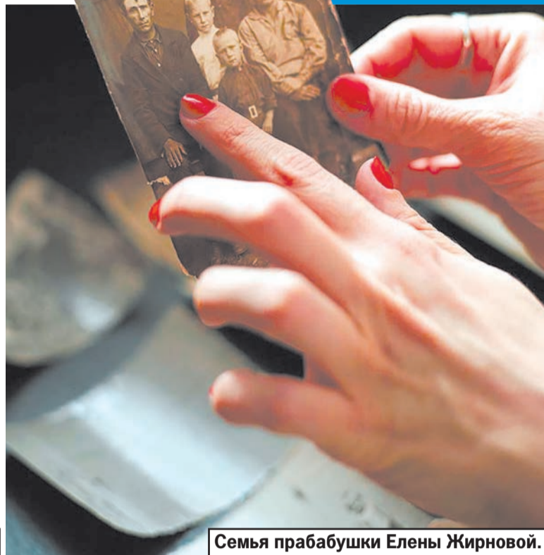
Жительница Барнаула составляет родословные