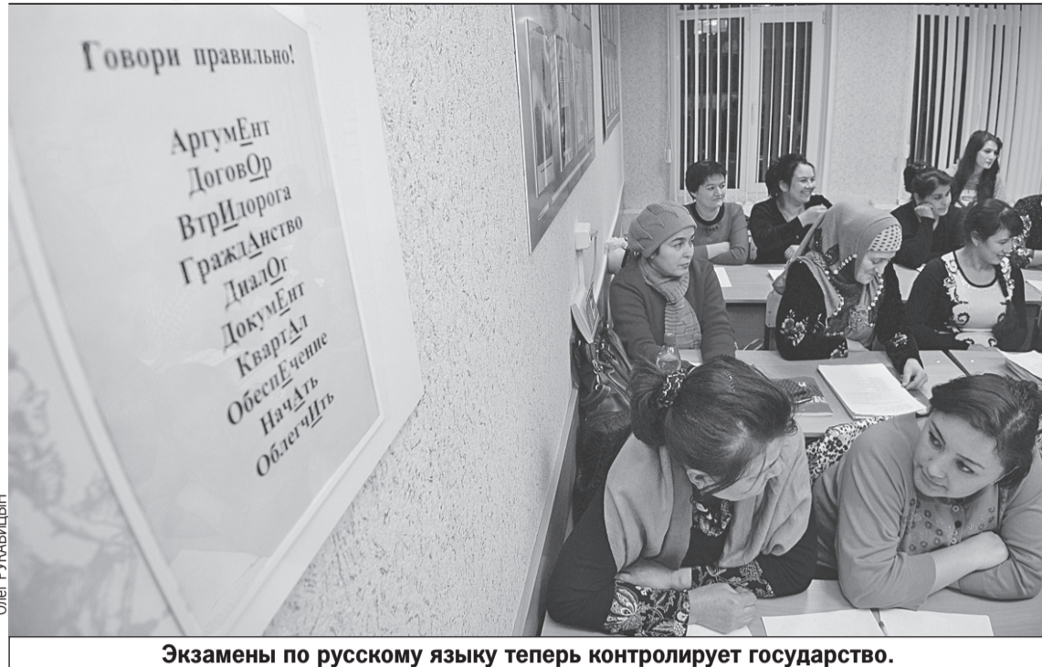
Экзамены по русскому языку теперь контролирует государство.

ях миграции - 11,7%. Две цифры: в целом по стране средняя зарплата с 2012 по 2024 год выросла в 3,1 раза, у нас - в 1,4 раза. За этот же срок некомплект увеличился в четыре раза. Более десяти лет заработная плата не индексировалась по коэффициенту-дефлятору. Это, конечно, отразилось.