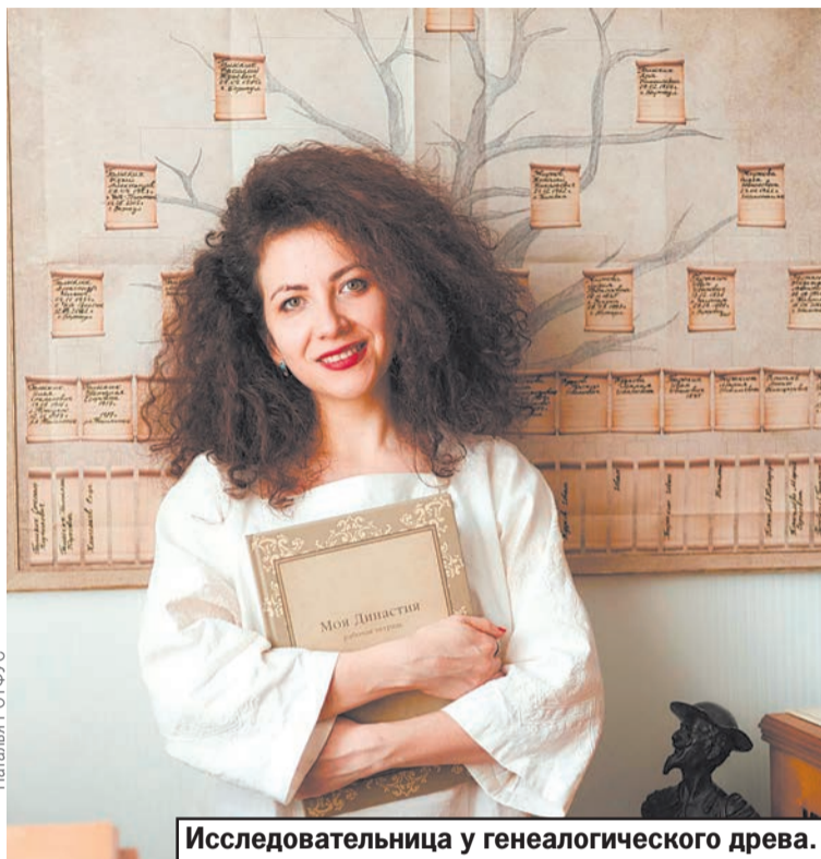
Исследовательница у генеалогического древа.