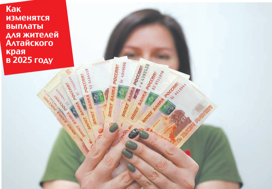
Ряд пособий и мер поддержки проиндексирован на 9,5%.