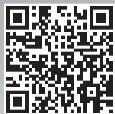
Фото присылайте в «Комсомольскую правду», e-mail: miss@kp.ru

Голосуйте за понравившуюся вам участницу на нашем сайте KP.RU в разделе «Будь стильной с «КП»!