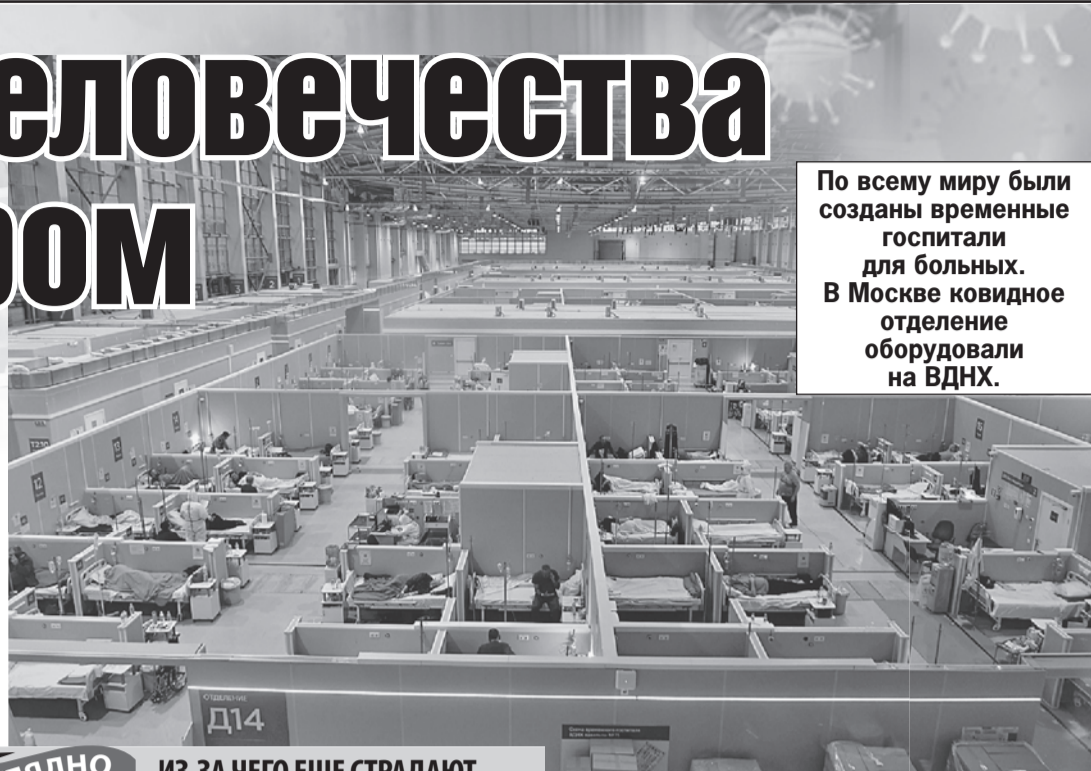
По всему миру были созданы временные госпитали для больных. В Москве ковидное отделение оборудовали на ВДНХ.