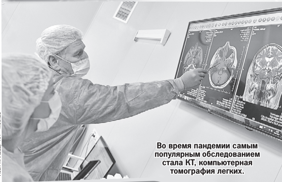
Во время пандемии самым популярным обследованием стала КТ, компьютерная томография легких.

«Комсомолка» расспросила ведущих ученых о способах, которые помогают справиться с осложнениями после коронавирусной инфекции.