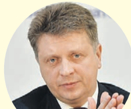
Максим Соколов, министр транспорта.