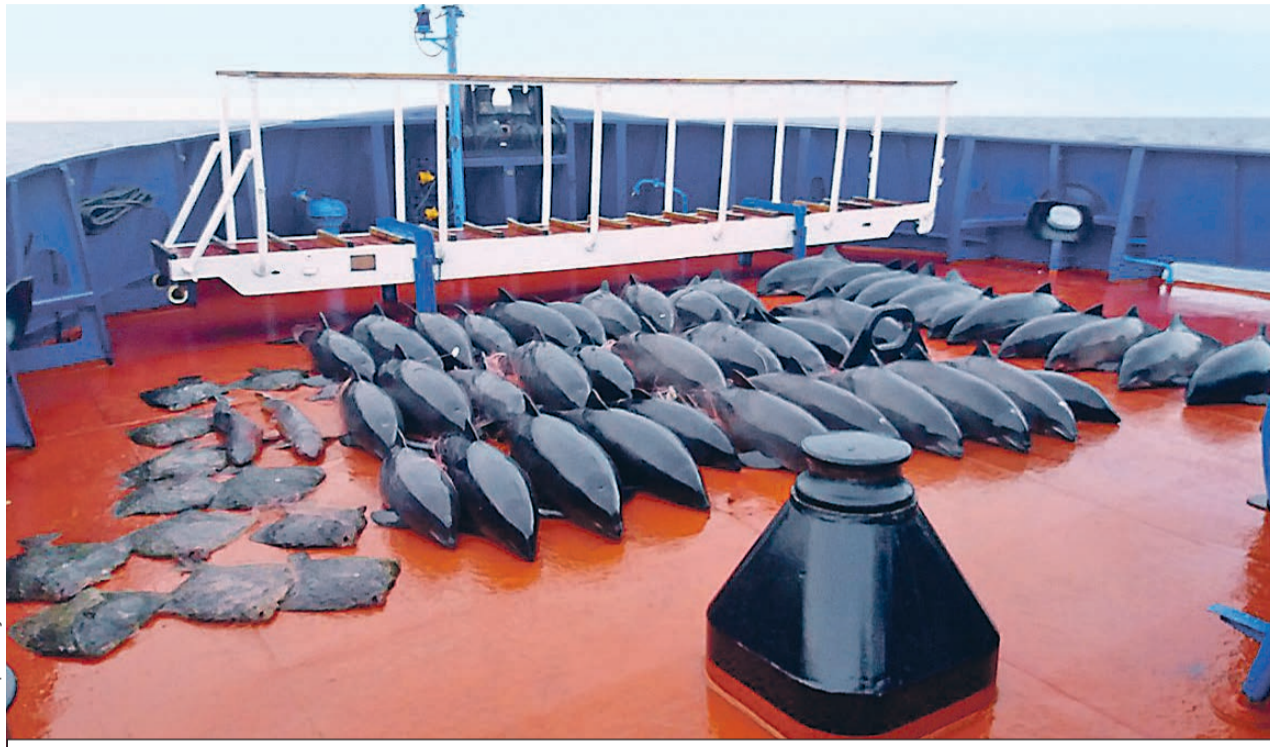
Братской могилой для дельфинов-азовок стали сети украинских браконьеров.