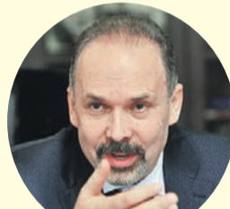
Михаил Мень, министр строительства и ЖКХ.