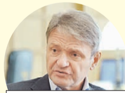
Александр Ткачев, министр сельского хозяйства.