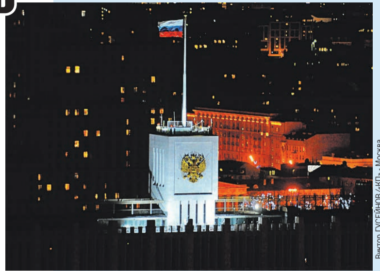
Виктор Гусейнов/КП - Москва

Кто вошел в правительство - подробнее на стр. 4-5. Мы спросили: