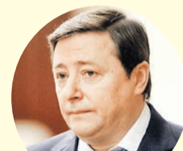
Александр Хлопонин, вице-премьер.