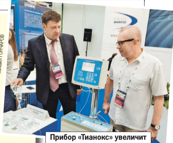
Прибор «Тианокс» увеличит продолжительность жизни россиян на 2,5 года.

ны практически все кардио- и перинатальные центры, отделения реанимации, интенсивной терапии. Как правило, основное осложнение после операции на сердце - легочная гипертензия, которая приводит к смерти. Случается она и у новорожденных. Иногда больных даже не берут на операцию, потому что рискованно. С таким аппаратом у тысяч людей появится шанс благополучно пережить операцию и жить.