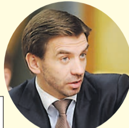
Михаил Абызов, министр без портфеля.