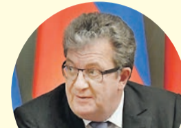
Сергей Приходько, глава аппарата правительства (назначен первым замглавы аппарата правительства).