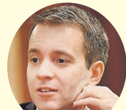
Николай Никифоров, министр связи.