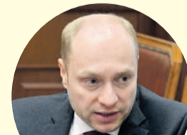
Александр Галушка, министр по делам Дальнего Востока.