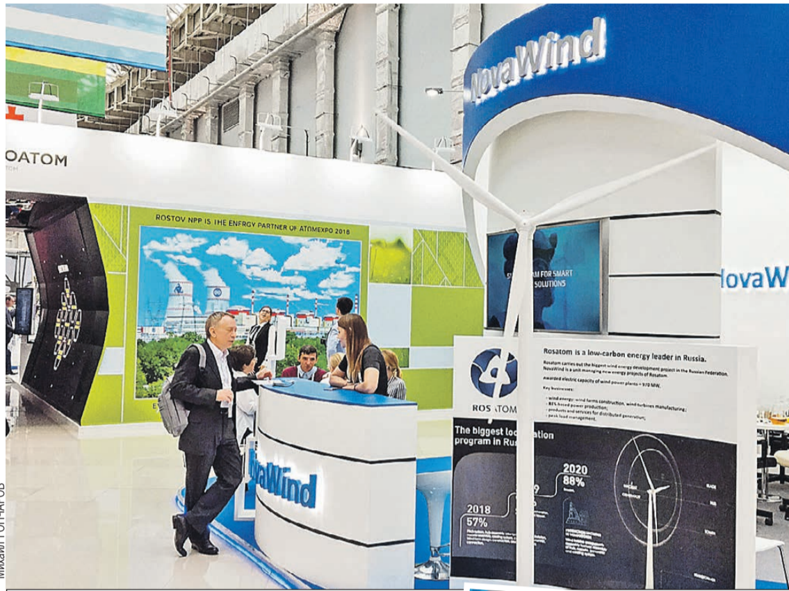
Ветроэнергетика - новый проект «Росатома».