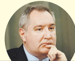
Дмитрий Rogozin, вице-премьер по ОПК и космосу.