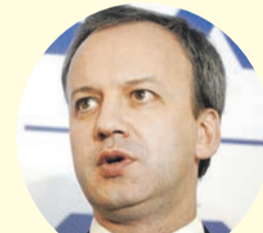
Аркадий Дворкович, вице-премьер.