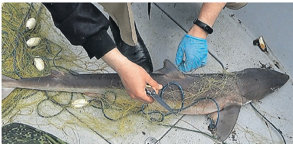
Черноморскую акулу катрана хищники-добытчики из независимой тоже не пощадили.

Дельфины-азовки обитают в основном в прибрежных водах Черного моря, в теплое время года их можно найти и в Азовском. Их отличает короткая голова с притупленной мордой. Питаются в основном некрупной рыбешкой, например хамсой. За день съедают 3 - 5 килограммов. Могут находиться под водой до 6 минут и плавать на скорости до 22 километров в час. Передвигаются небольшими группами, живут примерно 7 - 8 лет.