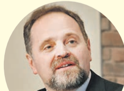
Сергей Донской, министр природных ресурсов и экологии.

Все подробности и комментарии о новом правительстве - на сайте kp.ru