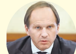
Лев Кузнецов, министр по делам Северного Кавказа.