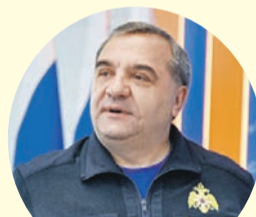
Владимир Пучков, министр МЧС.