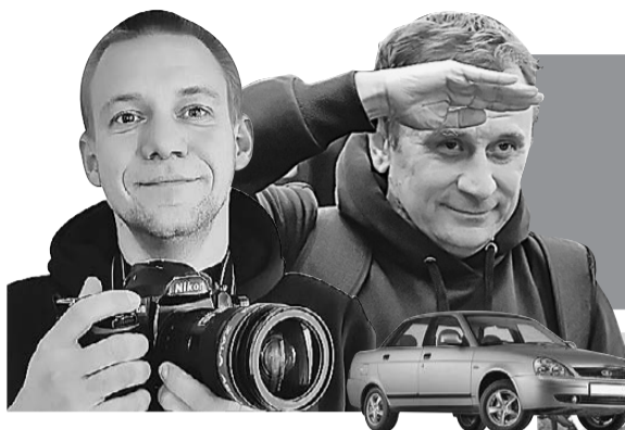
Владимир ВОРСОБИН (текст), Иван МАКЕЕВ (фото)

Читайте на сайте KP.RU все путевые заметки нашей экспедиции (там же - видео, которое мы снимали в пути).