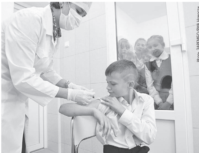
Колоть вакцину нужно прямо сейчас - вторую волну заразы обещают в феврале.

- Антитела к вирусу гриппа одного штамма не могут полностью защитить от другого, тем более если эти штаммы относятся к разным подтипам вируса (А и В), - сказала врач.