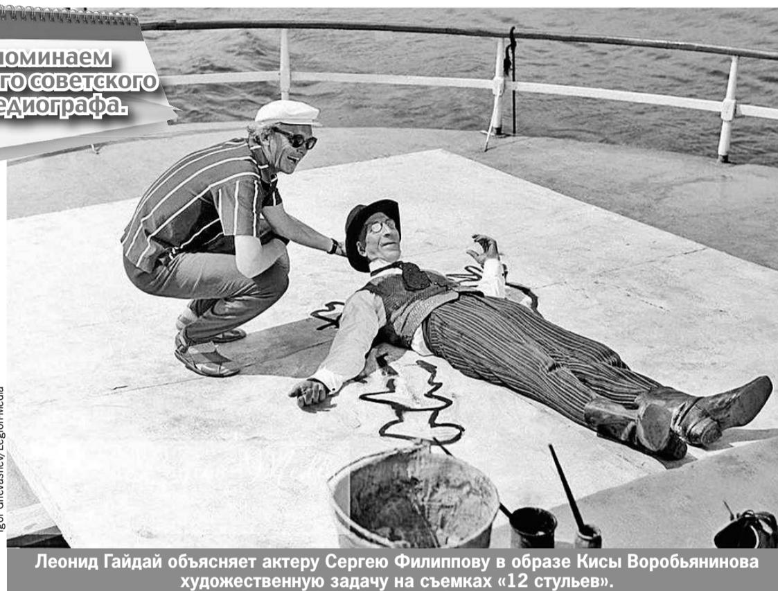
Леонид Гайдай объясняет актеру Сергею Филиппову в образе Кисы Воробьянинова художественную задачу на съемках «12 стульев».

Вспоминаем великого советского комедиографа.