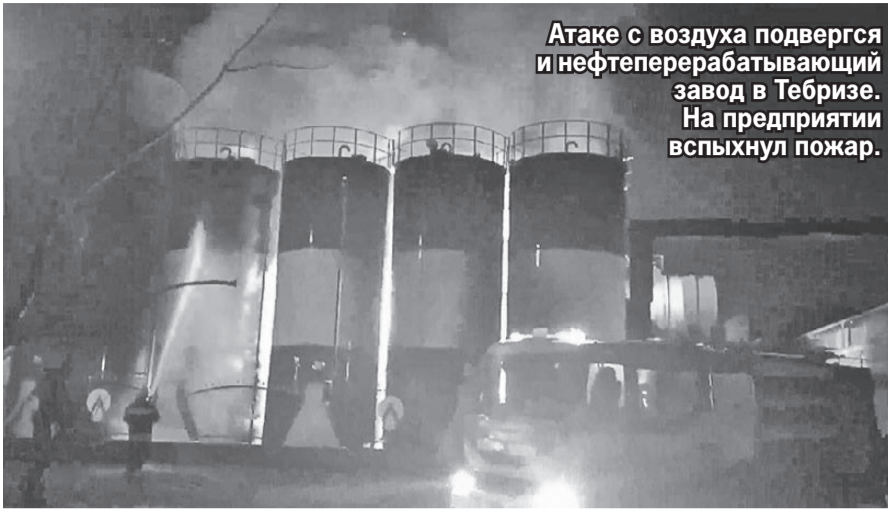
Атаке с воздуха подвергся и нефтеперерабатывающий завод в Тебризе. На предприятии вспыхнул пожар.

Многие аналитики полагают, что дело не обошлось без участия США. Американцы видят две