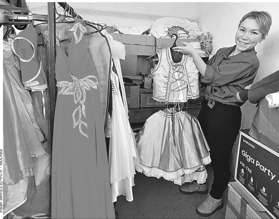
Театральный кружок в сибирском селе Неудачино: немецкие народные платья здесь - неременный атрибут.

Несчастные Казармы стояли у села Вагай, имеющего в округе славу не то