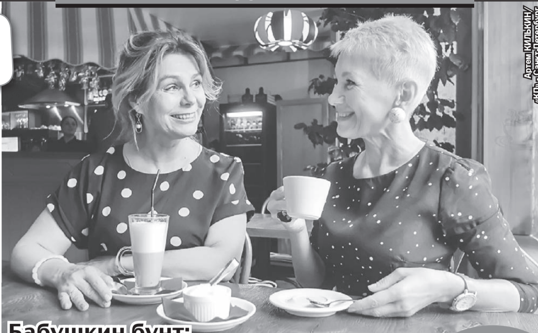
Артем КИЛЬКИН / «КП» - Санкт-Петербург

«Мы - первое поколение бабушек, которым некогда заниматься внуками, так как повысили пенсионный возраст. Моим внукам 12 и 11 лет, когда выйду