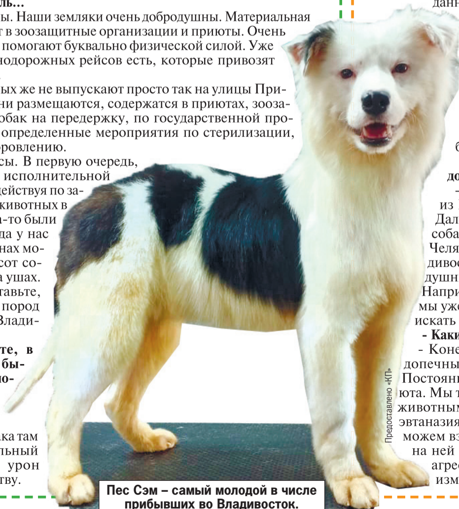
Пес Сэм – самый молодой в числе прибывших во Владивосток.