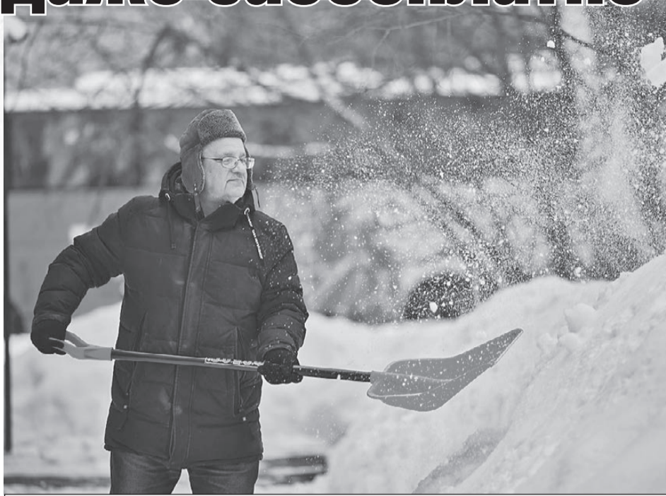
Килограммы - минус, настроение - плюс!

Поначалу, чтобы сохранить пути отступления, я соседям объяснял, мол, работаю за так, для здоровья.