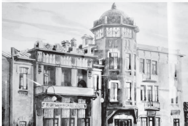
Доходный дом Зандау. Кинотеатр «Совкино». Построен около 1913 г. Акварель с фотографии 1913-1915 гг.

Пожалуй, самая популярная легенда Хабаровска - о том самом «Вороньем гнезде», «Доме архитектора», «Башне Инфиделя» или «Могиле Чингисхана».