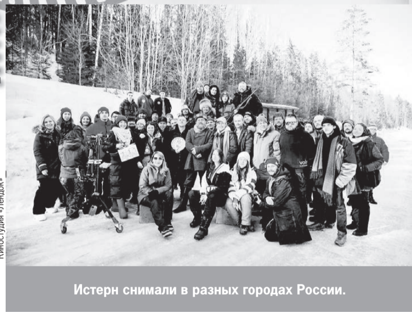
Истерн снимали в разных городах России.

Идея снять фильм о том громком событии возникла