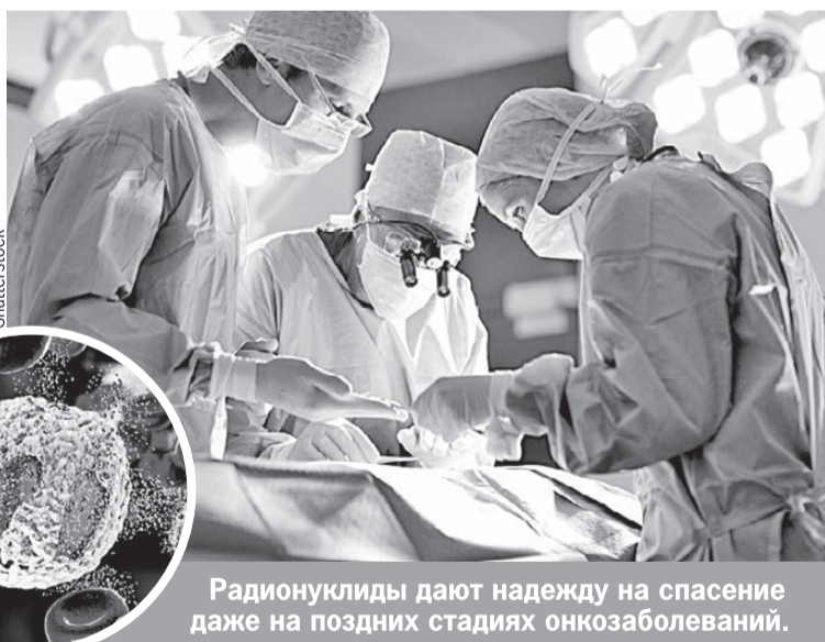
Радионуклиды дают надежду на спасение даже на поздних стадиях онкозаболеваний.