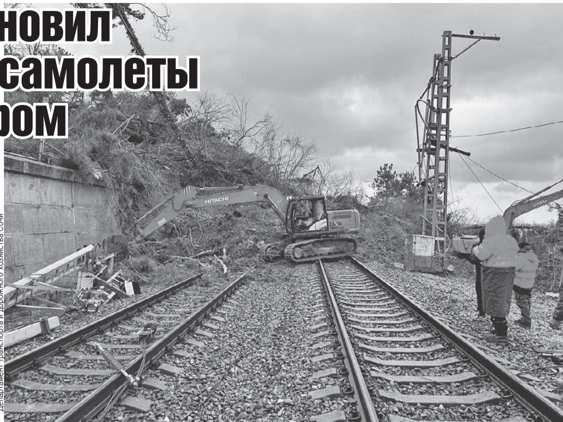
Департамент транспорта и дорожного хозяйства Сочи

- Мы усилили все службы для оперативного обслуживания пассажиров и воздушных судов. Увеличено количество операторов кол-центра, выставлены дополнительные кулеры для воды. Чаше убирают санитарные зоны, рабо-