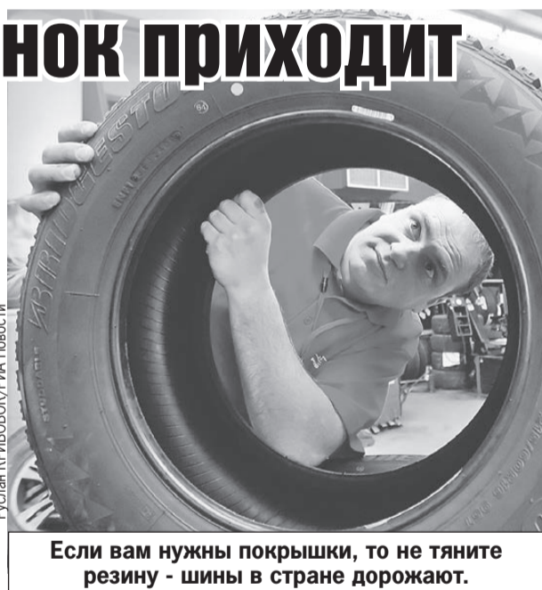
Если вам нужны покрышки, то не тяните резину - шины в стране дорожают.

- Пока нет оснований полагать, что по продажам авторынок достигнет значений 2021 года ( см. «Только цифры. - Ред.» ). Но если нынешний темп сохранится, то вполне реально выйти по итогам года на уровень 1,2 - 1,3 млн, - считает автоэксперт Игорь Моржаретто . - Хотя вы понимаете, что существует масса факторов, которые могут вмешаться в эти прогнозы. Для нормального функционирования рынка нам нужно выходить на уровень 1,6 млн проданных авто в год. Но думаю, что это задача уже 2025 года.