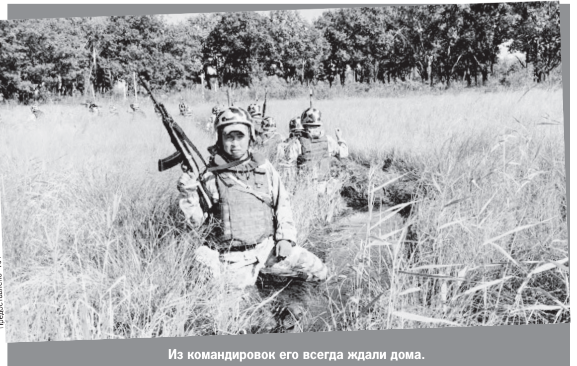
Из командировок его всегда ждали дома.