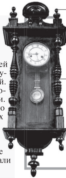
Сломанные часы, которые мистическим образом начинают ходить по ночам.

В Хабаровске музеи расположены по большей части в старинных домах, памятниках архитектуры, которые сами по себе пропитаны историей. Например, музей археологии. В 1919 году его хозяина вместе с женой и слугами жестоко убили. Преступники пришли со слесарным молотком по тоннелю, который ведет к Амуру, и забили всех до смерти. Мрачным здание остается до сих пор, этому свидетельствуют странные происшествия. Когда открываются выставки, со стен обязательно что-то падает, присутствующие слышат разные шумы и звуки, туда даже несколько раз приглашали священнослужителя, чтобы очистить место.