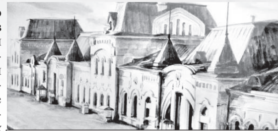
Первое здание вокзала. Построено в 1926-1935 гг. Разрушено в 60-е годы 20 века.

Активное освоение Дальнего Востока России началось еще в XIX веке, и именно с того времени из уст в уста передаются необъяснимые истории, которые за годы обросли всевозможными выдумками. Именно эти мистические легенды добавляют атмосферности вечерним прогулкам местных и экскурсиям туристов. Рассказываем, какие байки сохранились о Хабаровске.