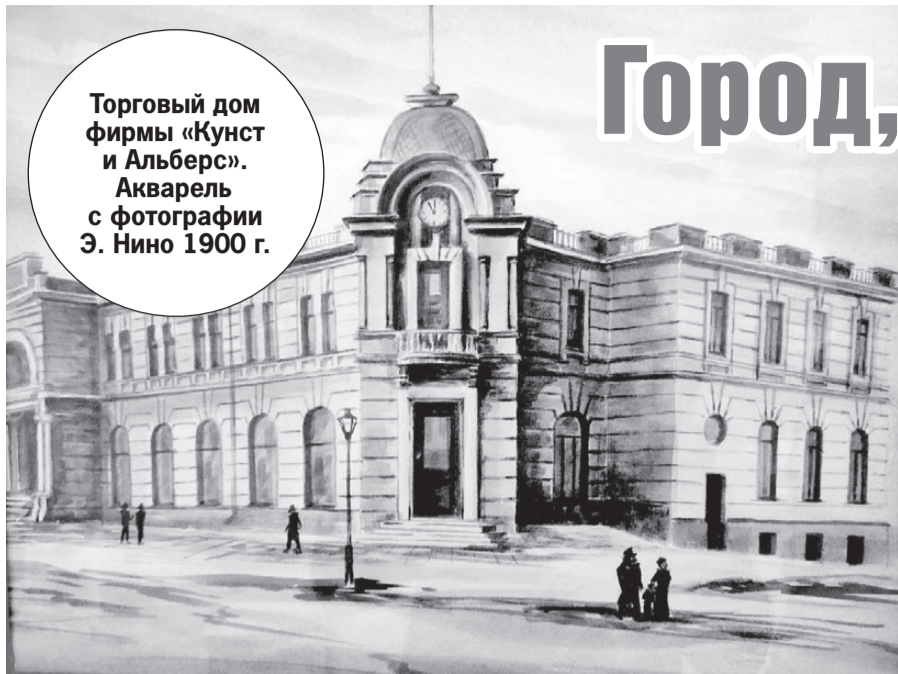
Торговый дом фирмы «Кунст и Альберс». Акварель с фотографии Э. Нино 1900 г.