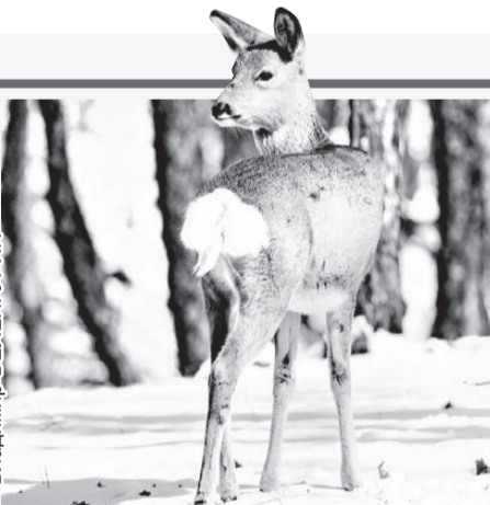
Косули - прыгучие животные.