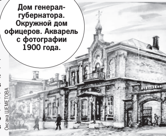
Дом генерал-губернатора. Окружной дом офицеров. Акварель с фотографии 1900 года.

помине не было и быть не могло. Но тогда откуда звучали эти голоса?