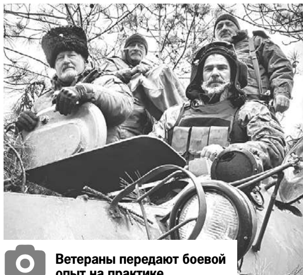
Ветераны передают боевой опыт на практике.

- Претерпели изменение и дополняются в основном пункты Стратегии, связанные с несением казаками государственной и иной службы и патриотическим воспитанием под-