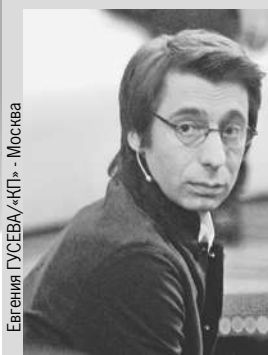
Евгения ГУСЕВА/«КП» - Москва

✓ 11 января 2022 года на отдыхе в Доминиканской Республике внезапно скончался телеведущий Михаил Зеленский . Ему было всего 46 лет. Согласно заключению доминиканских