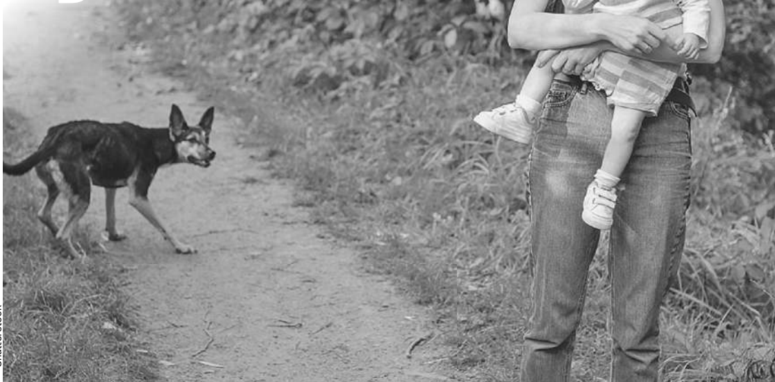
Собачий вопрос делает существование некоторых людей невыносимым. А иногда становится вопросом жизни и смерти.

потому что один человек может ошибаться.