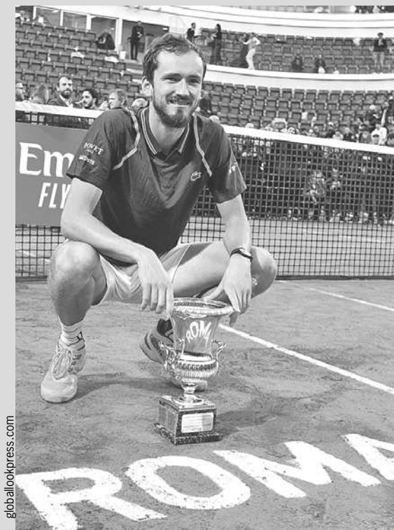
Даниил Медведев выиграл 20-й титул в карьере и заработал в Риме 1,1 млн евро.

28 мая стартует «Ролан Гаррос». Король грунтовых кортов 36-летний Рафаэль Надаль из-за травмы снялся со своего любимого турнира, где он побеждал 14 раз (!), а значит, трон свободен. Учитывая, что Медведев наконец-то заиграл на грунте, у него есть хорошие шансы повторить свой римский успех в Париже.