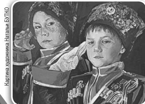
Картина художника Натальи БУТКО