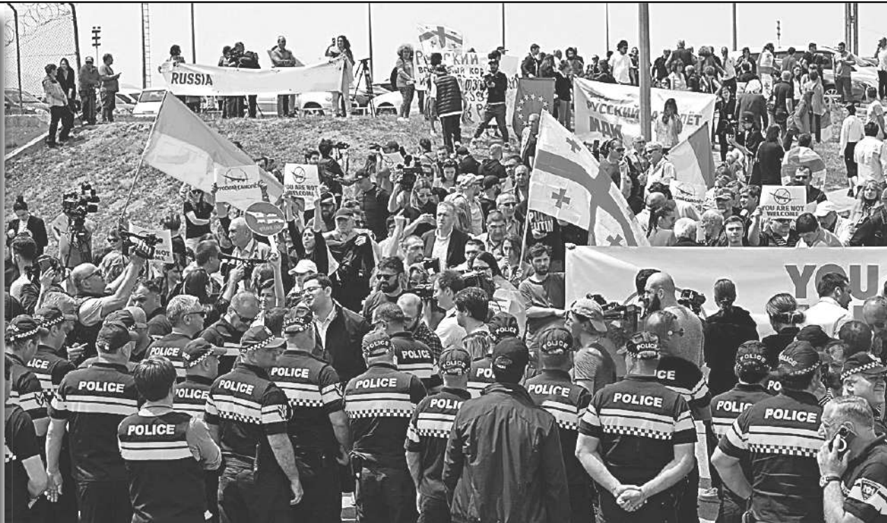
Не более 200 - 300 человек с флагами Грузии, Украины и антироссийскими лозунгами добрались пешком из Тбилиси до аэропорта, в здание которого их не пустила полиция.

Как Грузия встретила первый после 4-летнего перерыва самолет из России. Спецкор «КП» с трудом просочилась в аэропорт Тбилиси, где порадовалась спокойствию полицейских, порадовалась за пассажиров и нарвалась на хамство местных журналистов.