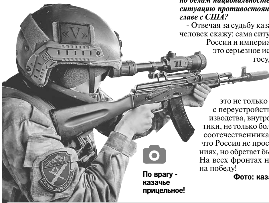
По врагу - казачье прицельное!