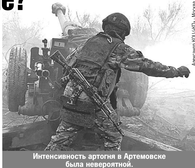
Интенсивность артогня в Артемовске была невероятной.

А пока, в день освобождения Мариуполя, Бахмут опять стал Артемовском.