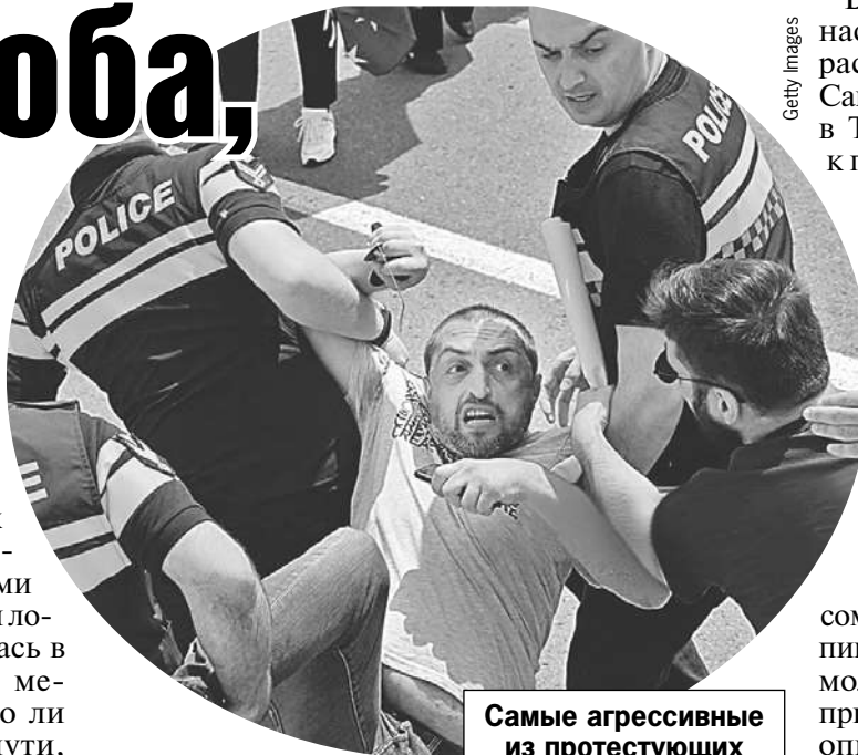
Самые агрессивные из протестующих до аэропорта им. Руставели не добрались.