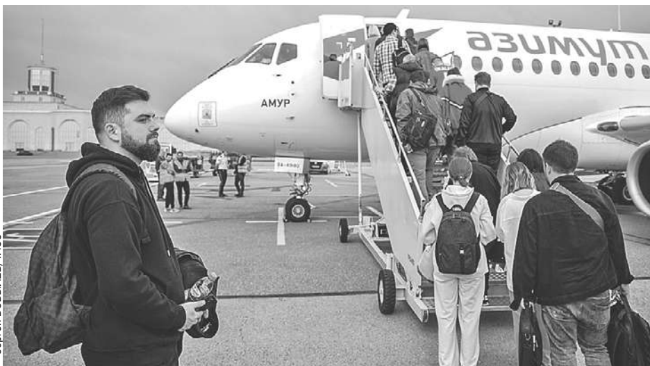
Пассажиры самолета Super Jet 100-95В «Амур» российской компании «Азимут» в Москве не ждали, что в аэропорту Тбилиси не все будут им рады.