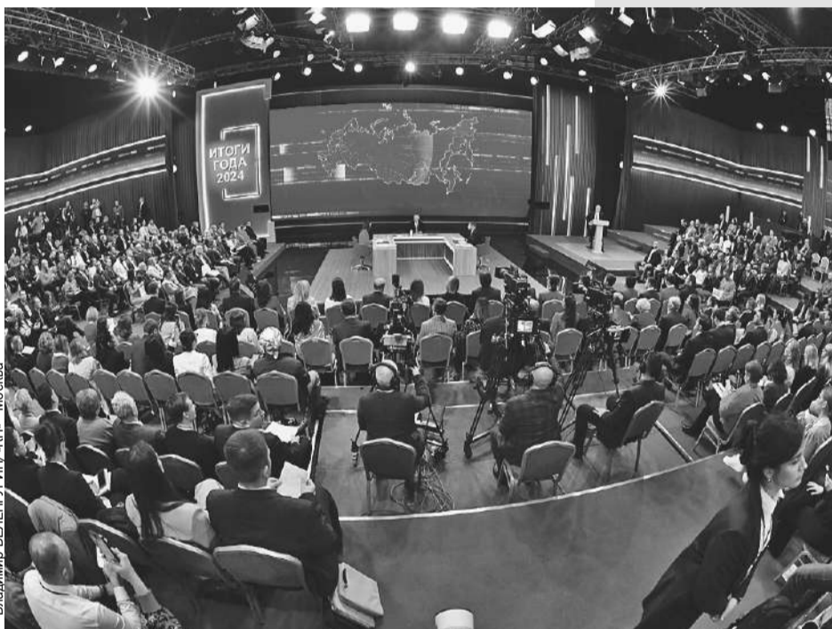
Только в зале жаждут задать вопрос Путину почти тысяча человек.

- В Арктической зоне мы сохранили льготную ипотеку по 2% (как на Дальнем Востоке), люди пользуются этой льготой. Мы в этой зоне целую программу делаем для 25 городов. И будем расширять ее по всей стране до 200 городов. Небольшие поселки могут не попасть в эти планы, но мы посмотрим, что можно сделать для них дополнительно.