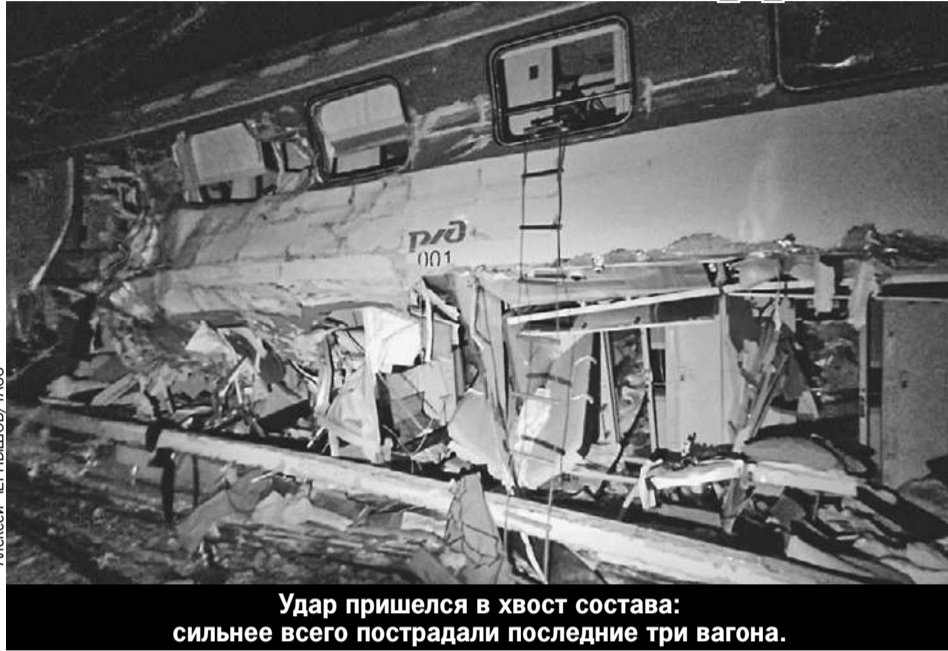
Удар пришелся в хвост состава: сильнее всего пострадали последние три вагона.

Погибли женщина и мужчина. Жертв могло быть больше, но благодаря смелым пассажирам, оперативной реакции экстренных служб и жителям соседнего поселка последствия удалось смягчить.