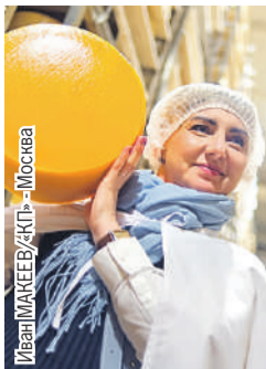
Иван МАКЕЕВ/КП - Москва

Белорусы закроют дефицит дешевого сливочного масла и сыра в России - стр. 12