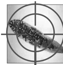
Липосомная технология действует за 20 минут

Бесплатная консультация в рамках социальной акции «БЕЗ ПАРАЗИТОВ»! 1. Позвоните по телефону (бесплатно) 8-800-100-55-60