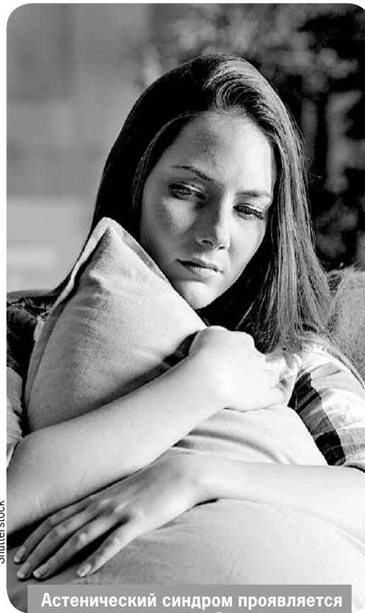
Астенический синдром проявляется в осенне-зимний период.