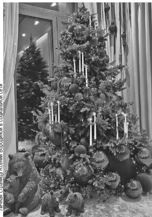
В доме Ксении Бородиной дизайнеры нарядили модную елку.

Личная страница Ксении Бородиной в социальной сети