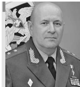
Игорь Кириллов был начальником войск радиационной, химической и биологической защиты Вооруженных сил России.

Женат. Имеет двоих сыновей. Ему было 54 года.