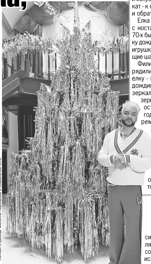
Филипп Киркоров и елка в его доме - вся покрыта дождиком.

Филипп рассказал: «Мне нарядили праздничную живую елку - прямо как из детства с дождиком серебряным. Этот зеркальный дождик будет отзеркаливать все негативное, оставим плохое в уходящем году. А в наступающий берем свет, добро, тепло. 2024-й - Год семьи: эту елку мы наряжали все вместе с моими детьми, с моим папой. Весь дом пропитан запахом хвои, Нового года. Не хватает мандаринов и оливье, но это все скоро тоже будет».