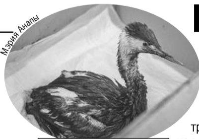
Кроме уборки мазута, волонтеры отмывают пострадавших птиц.

В Краснодарском крае убирают разлившиеся после крушения танкеров нефтепродукты.