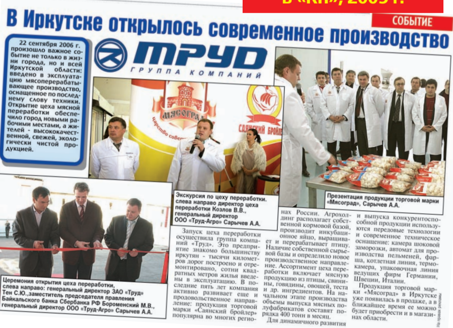
В Иркутске открылось современное производство

Одна из первых публикаций «Саянского бройлера» в «КП», 2005 г.