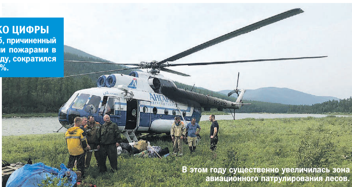
В этом году существенно увеличилась зона авиационного патрулирования лесов.

Ущерб, причиненный лесными пожарами в 2023 году, сократился на 95,8%.