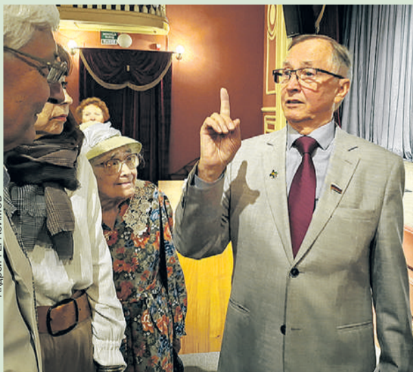
Николай Бурляев рассказал иркутянам, что планирует снять фильмы о святом Сергее Радонежском и полковнике Александре Суворове.

На встрече со зрителями Николай Бурляев признался, что ему потребовалось 62 года, чтобы снять фильм о своем учителе. Картина «Боже! Чувствую приближение Твое!» рассказывает о