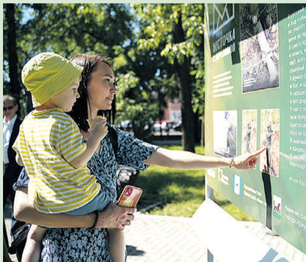
На фотографиях люди стараются найти родные лица.