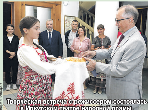
Творческая встреча с режиссером состоялась в Иркутском театре народной драмы.