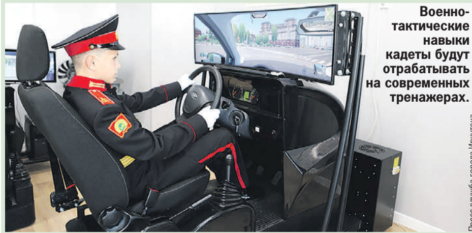
Военно-тактические навыки кадеты будут отрабатывать на современном тренажере.

Кроме того, фасады многоэтажных домов украсили муралы. На одном здании появился портрет генерал-майора Солтана Калицова, который руководил Иркутским высшим военным авиационным инженерным училищем. На фасаде еще одного дома - портрет легендарного русского полковника Александра Суворова.