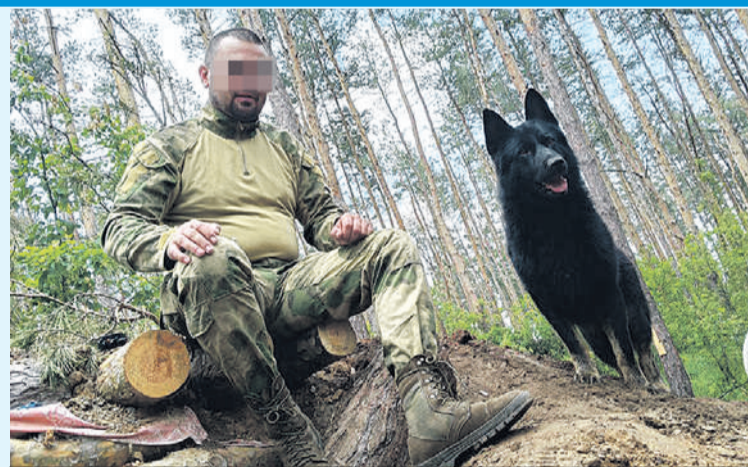
Военный с позывным Костыль мечтал забрать Добу домой, но не смог...

- Он мог играть или безмятежно спать, а затем вдруг навострить