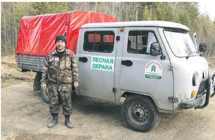
Посты помогают вовремя обнаружить возгорание и дисциплинируют тех, кто едет отдыхать на природу.

- Зона контроля лесных пожаров устанавливается на территориях, расположенных