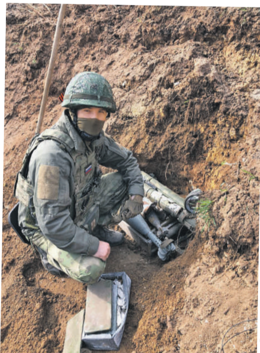
Григорий КУБАТЬЯН/«КП» - Москва

В будущем все сгоревшие танки отправятся на переплавку. Никакой угрозы в них уже нет. Гораздо опаснее мины в земле.