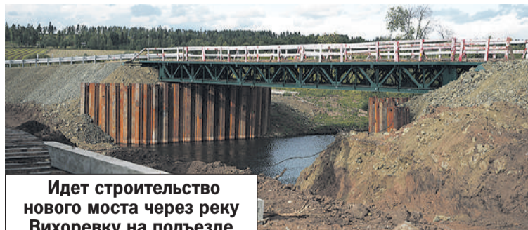
Идет строительство нового моста через реку Вихоревку на подъезде к селу Кузнецовка.

Так, в ходе рабочей поездки обсуждался вопрос проведения капитального ремонта Илирской школы № 2 в поселке Прибрежном Братского района. Сейчас в старом здании учатся 316 школьников, для них нужно создать комфортные и безопасные усло-