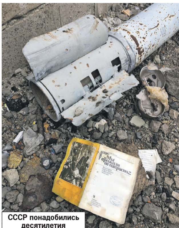
Тригорини КУБА/БНУ/КП - Москва

- Массовый героизм донецких мобилизованных в летних боях 2022 года под Авдеевкой. Там погибли мои друзья, которых я буду помнить всегда. Военный конфликт - самый беспощадный путь к миру. Но ради мира этот путь нужно пройти.