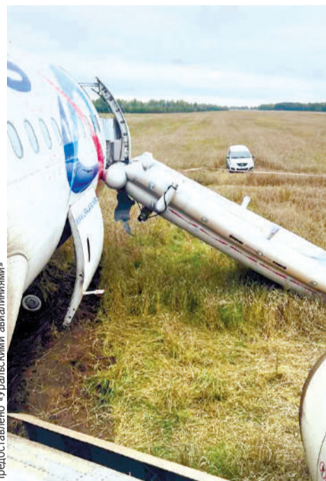
Пассажиры спускали на поле по надувному трапу. В авиакомпании уже заявили - за такой «аттракцион» выплатят по 100 тысяч компенсации.

- На самолетах всегда три гидросистемы: основная, резервная и аварийная. Видимо, Сергей Скуратов имеет в виду, что «зеленая» - это основная. Все три гидросистемы питаются от одной рабочей жидкости. Называется она «гидрожидкость». Если ее нет, то хоть «красная», хоть «зеленая» не поможет, потому что нечем работать, - объясняет авиаэксперт. - От гидросистемы питаются все управляющие поверхности на самолете: руль высоты, руль поворота. Самолет мог просто превратиться в неуправляемую машину. Я не знаю деталей происшествия, но если экипаж принял решение садиться вне аэродрома, то ситуация была критической. Значит, управление самолетом было затруднено. По какой причине произошла потеря гидрожидкости, будет выяснять комиссия.