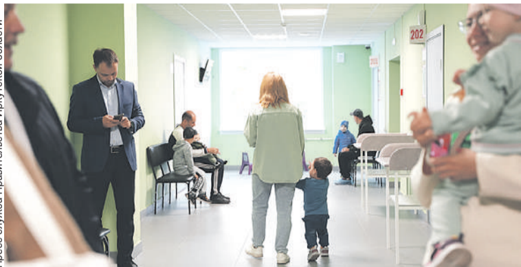
В этом году завершили капитальный ремонт двух поликлиник Братской городской детской больницы.

Пресс-служба Правительства Иркутской области