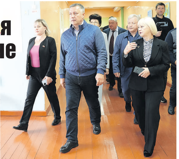
Игорь Кобзев посетил несколько школ Братского района, которые нуждаются в ремонте.

Пресс-служба Правительства Иркутской области