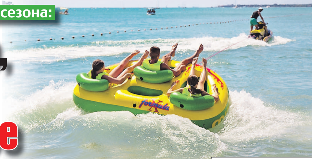
Оксана ЗУЙКО/«КП» - Москва

- У нас в стране очень высокий спрос на санаторно-курортный отдых, это тенденция последних лет. К большому сожалению, новых санаториев не появляется, хороших объектов мало. И повышенный спрос отражается на цене. Средняя стоимость номера в санатории составила