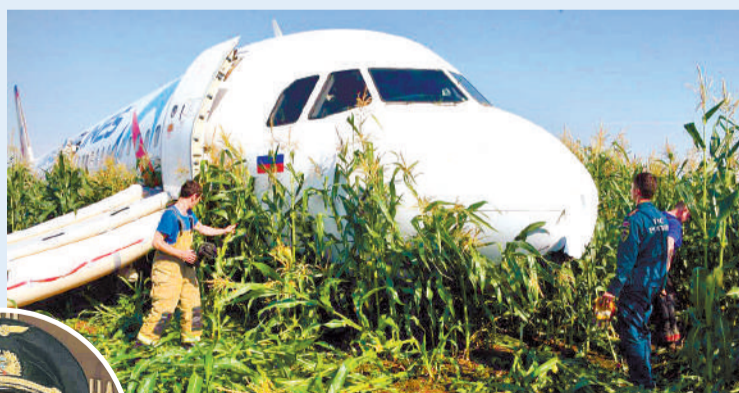
Дамир Юсупов, успешно посадивший самолет в кукурузном поле: - Я горжусь вами, экипаж!

Ижмы (Республика Коми). На борту был 81 человек, все они благополучно эвакуировались и не пострадали. Большую роль в удачной посадке сыграл не только героизм пилотов, но и инициатива бывшего начальника аэропорта Сергея Сотникова , который поддерживал полосу в удовлетворительном состоянии. Командир и второй пилот воздушного судна были удостоены звания Герой России, Сергей Сотников награжден медалью ордена «За заслуги перед Отечеством» II степени. Самолет после той аварийной посадки отремонтировали, он эксплуатировался до 2018 года. А сейчас стоит в качестве памятника в новосибирском аэропорту Толмачево.