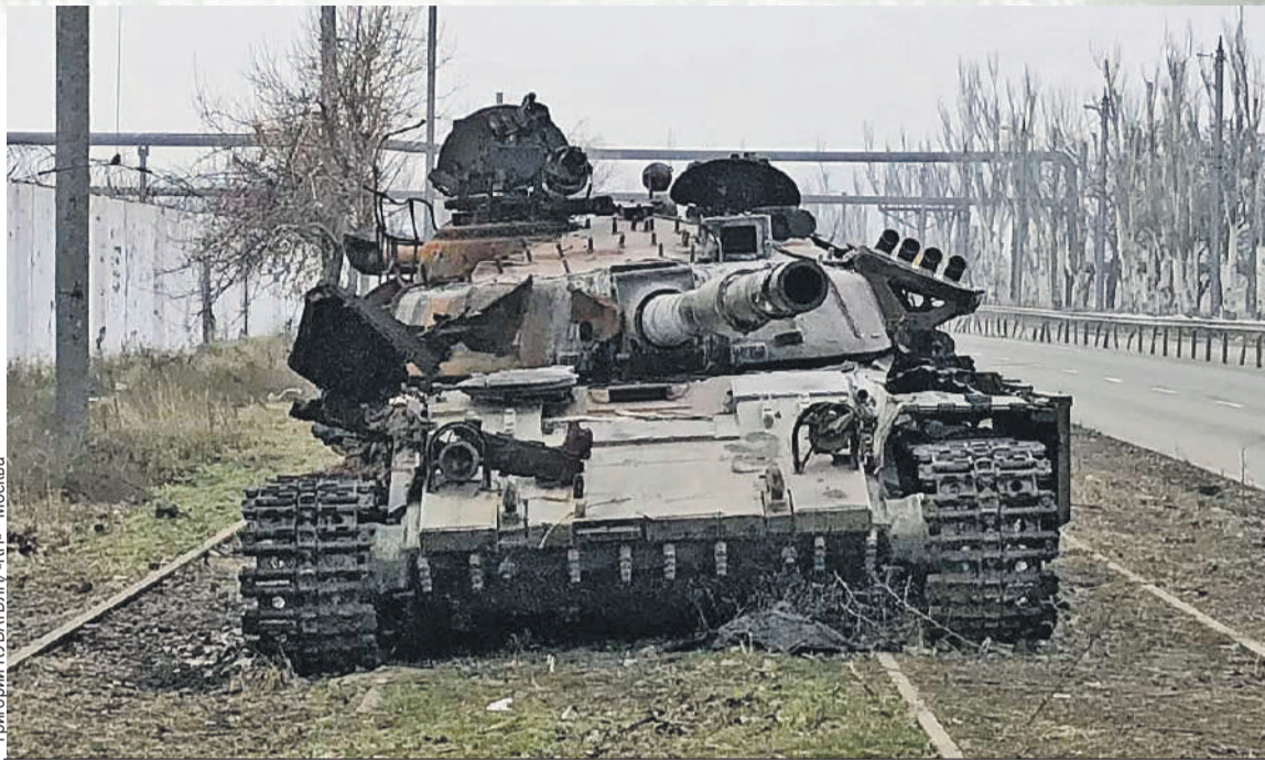
Григорий КУБАТЬЯН/«КП» - Москва

Трагедия заминированной страны, которая обрушилась на Камбоджу и которая теперь ждет Украину, была видна наглядно. В деревне,