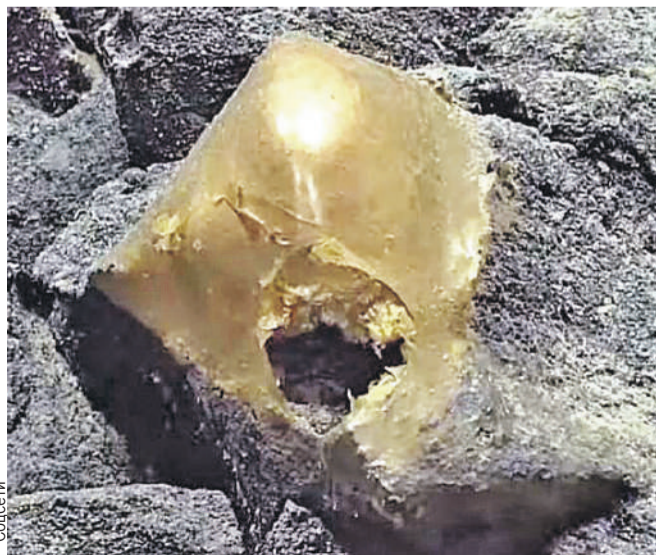
На дне океана «мышка бежала, хвостиком махнула»?