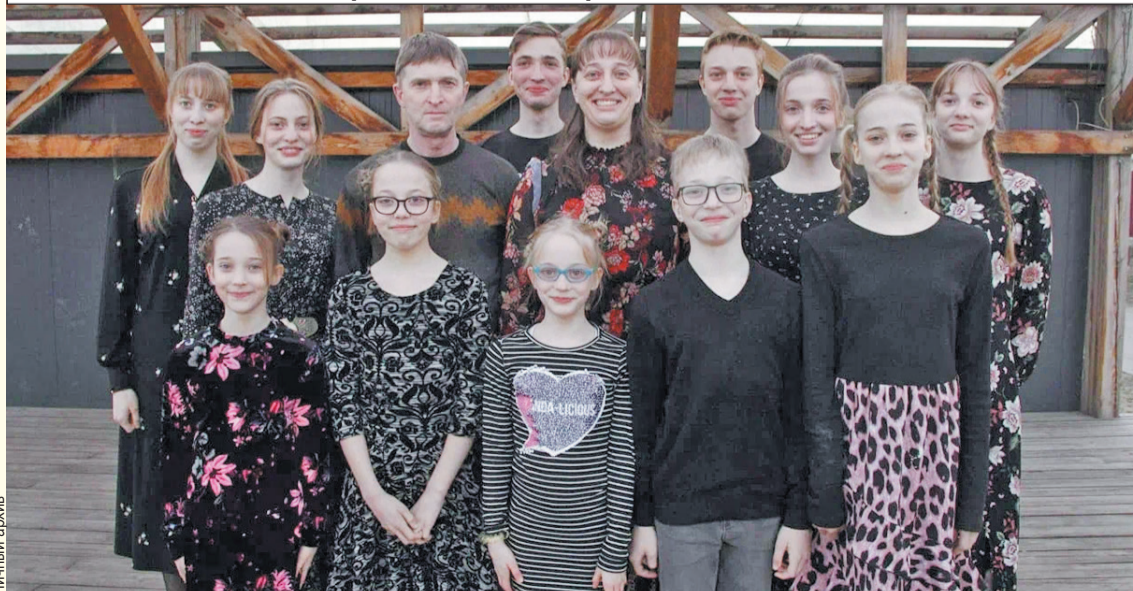
В большом доме Черныговых весь второй этаж полностью занят детскими.

А еще у Черныговых есть мечта - они хотят все вместе отправиться на самолете к морю. И они уверены - скоро она обязательно сбудется.