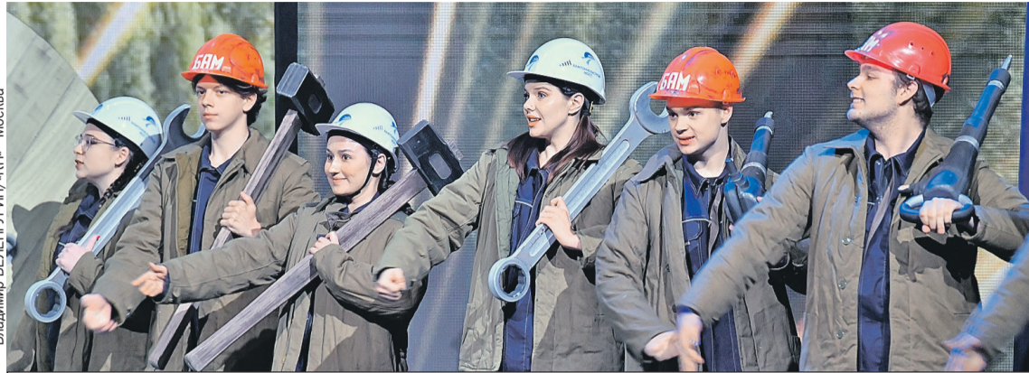
На каких же специалистов спрос будет расти, а на каких - падать? Что будет с доходами? Ответы на эти и другие вопросы - в прогнозе для российского рынка труда на 2025 год, который мы составили вместе с экспертами.

- Например, сейчас один час работника в сфере переупаковки в логистическом цен-