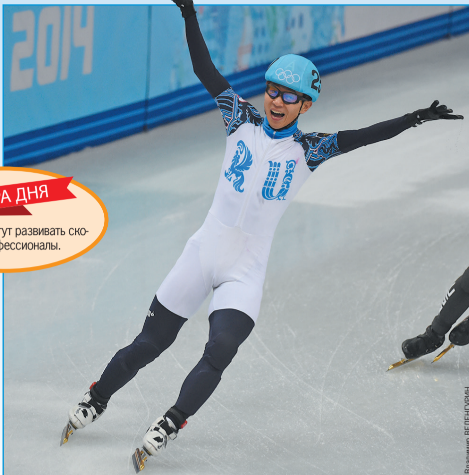
Олимпиада в Сочи. Шорт-трек среди мужчин. 500 м. Финал. Триумфатор состязания Виктор Ан, завоевавший золотую медаль.

ЦИФРА ДНЯ До 60 км/ч могут развивать скорость профессионалы.