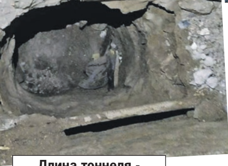
Длина тоннеля - около 65 метров.

Побег был тщательно спланирован - осужденные переоделись в гражданскую одежду, с собой у них были ножи.