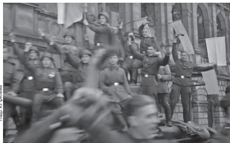
А здесь на заднем плане хорошо различима бывшая биржа - сегодняшний Музей изобразительных искусств.

Добавим, что картина завоевала главный приз на Международном кинофестивале в Москве. А режиссер и оператор были удостоены Ленинской премии.