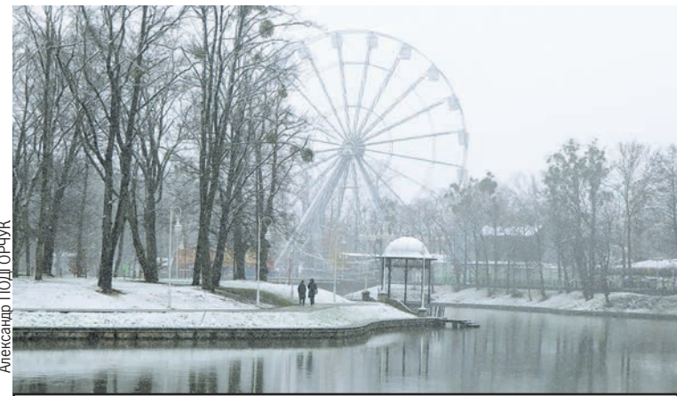
Первые ноябрьские выходные будут прохладными.

плюсовой температуре! - прогнозируют авторы телеграм-канала «Погода и метеоявления в Калининградской области», но отмечают, что сейчас строить точные прогнозы на конец недели еще невозможно.