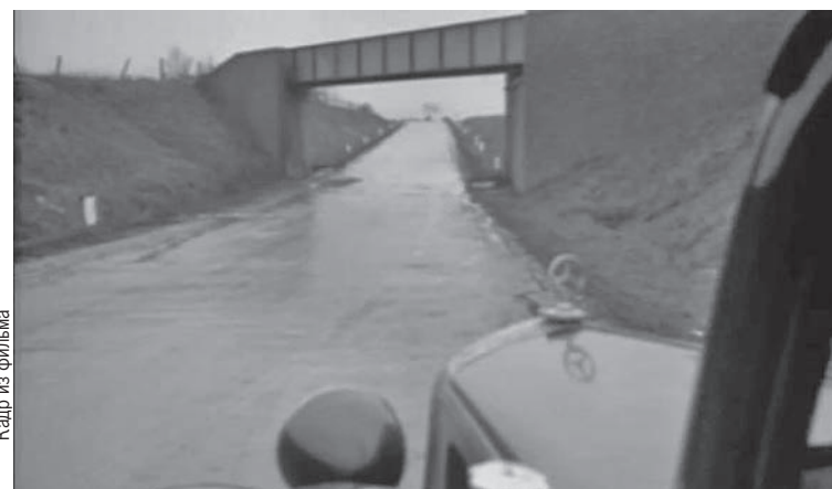
Второй побег из немецкого плена герой фильма совершил у моста в Борисово. Сегодня от него остались лишь опоры.