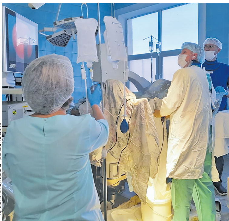
Новые виды помощи требуют от врачей ювелирной точности.

447 359 жителей Калининградской области сделали прививку против гриппа, из них 128 241 ребенок. Кампания по вакцинации продолжается.