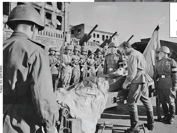
Сцену прощания главного героя с сыном сняли возле развалин Королевского замка.

Сыграть в массовых сценах приглашали жителей города. 22 октября в «Калининградской правде» появилось объявление: «Московской ордена Ленина киностудии «Мосфильм» требуются мужчины и женщины разных возрастов для участия в массовых сценах при съемках кинофильма «Судьба человека».