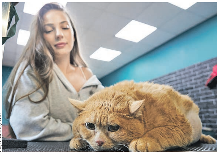
У кота, увы, не было шансов выжить. Из-за ожирения рак диагностировали слишком поздно.