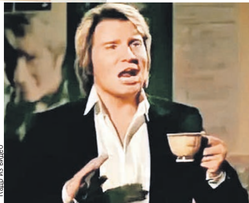
«Золотая чаша, золота-а-ая», - подпевала вся страна Николаю Баскову 20 лет назад.

Есть звезды, для которых реклама - способ заработать на благотворительные проекты (как Федор Бондарчук). А Сергей Безруков тратит заработанное в рекламе на своих студентов - оплачивает учебу нескольким «платникам» своего курса во ВГИКе - 600 тыс. руб. за учебный год за человека. Бесплатных мест мало, а талантливой молодежи много - вот Сергей Витальевич и помогает по мере сил. Мало того, Безруков возит студентов на кинофестивали - и все это на рекламные деньги.