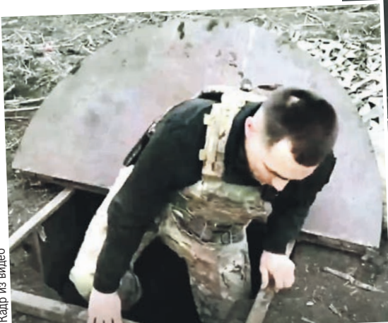
Вот так начиналась знаменитая операция «Поток». Вход метр на метр, диаметр трубы всего 1,4 метра, оружие и припасы толкали вперед на тележках 14 км (см. фото справа).