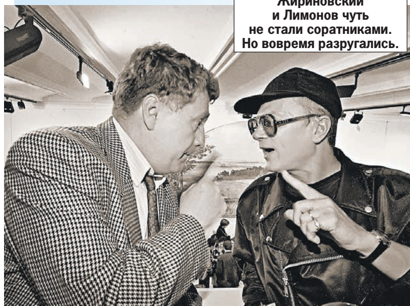
Жириновский и Лимонов чуть не стали соратниками. Но вовремя разругались.

- Все, что я хотел в жизни, не получилось. Нет у меня ни хорошей работы, ни теплой семьи, ни товарищей, ни свободы. Все, что я имею, - на тройку. На тройку я прожил жизнь.