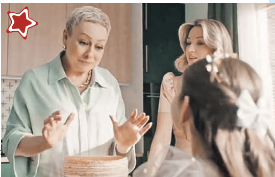
Мария Аронова стала лицом рекламной кампании банка и в ролике сравнивает пенсионную программу с тортом.