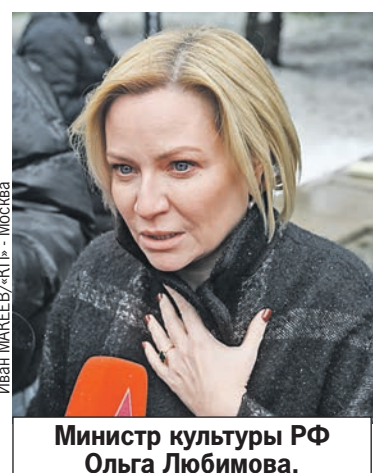
Министр культуры РФ Ольга Любимова.