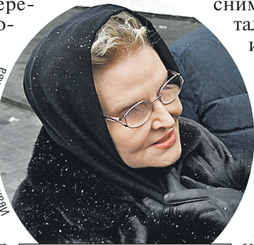
Елена Малышева сокрушается, что так и не уговорила своего шефа пройти обследование.

Ольга Погодина впервые призналась, что чуть больше двух лет назад у нее с Пимановым родилась дочка, о которой они никогда раньше не рассказывали на публике. Никто не знал, что у супругов есть общий ребенок. «Я тебе благодарна за каждую секунду, в которую нам посчастливилось быть рядом. Я не жалею ни об одном дне, - сказала актриса. - И в кошмарном сне я не могла предположить, что получится так.