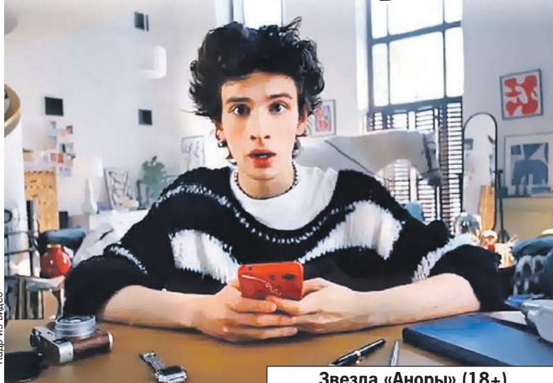
Звезда «Аноры» (18+) Марк Эйдельштейн теперь играет зумера в рекламе сотового оператора.