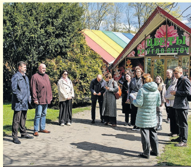
Участникам экскурсии рассказали о растениях с «паспортами».

- Подать заявку на участие в организационном маршруте можно на официальном сайте министерства по культуре и туризму.