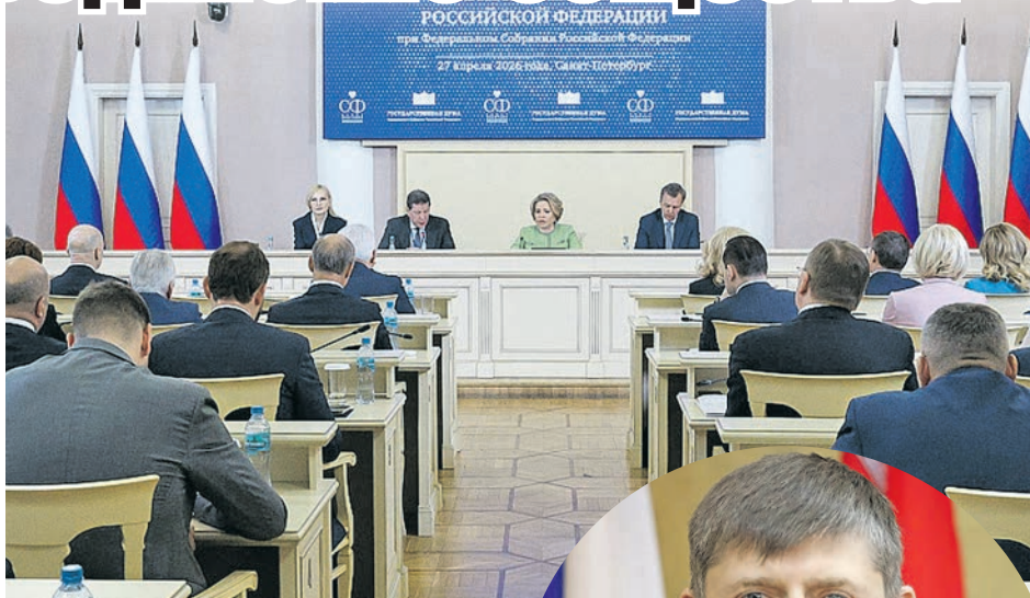
Заседание Совета законодателей в Санкт-Петербурге возглавила Валентина Матвиенко.

Как подчеркнула глава верхней палаты, сегодня в соответствии с Конституцией каждый субъект Российской Федерации