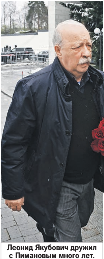
Леонид Якубович дружил с Пимановым много лет.