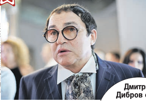
Дмитрий Дибров стал популярнее после недавнего развода, но в рекламу его пока не особо зовут.

На днях завершился судебный процесс, в котором одна из региональных юридических компаний подала иск к Дмитрию Диброву - телеведущий в прошлом году рекламировал их услуги. Компания расторгла с ним контракт в ноябре 2025 года после скандала с расстегнутой ширинкой и хотела взыскать 6 млн руб. за испорченную репутацию. Но суд фирма проиграла - доказать, что скандал со звездой мог повлиять на прибыль или подмочить репутацию часто просто невозможно. В прошлом году предпочтение отдавали другим знаменитостям. Тогда в роликах мелькали Ляйсан Утяшева и Павел Воля, Полина Гагарина, Дмитрий Маликов, Елена Подкаминская, Азамат Мусагалиев, Михаил Галустян, Гарик