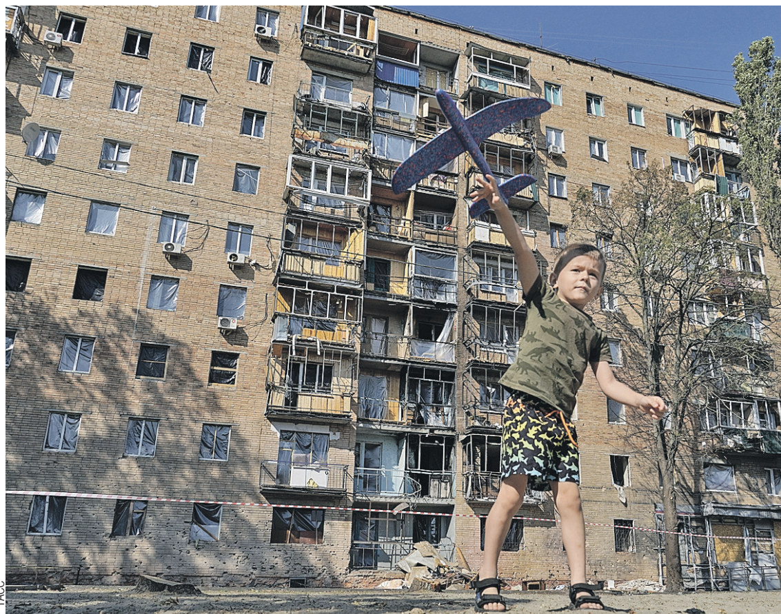
В 2024-м дети в Курске увидели, что небо может нести не только голубую мечту, но и черную смерть.

и сняли с должности главы Суджанского района.