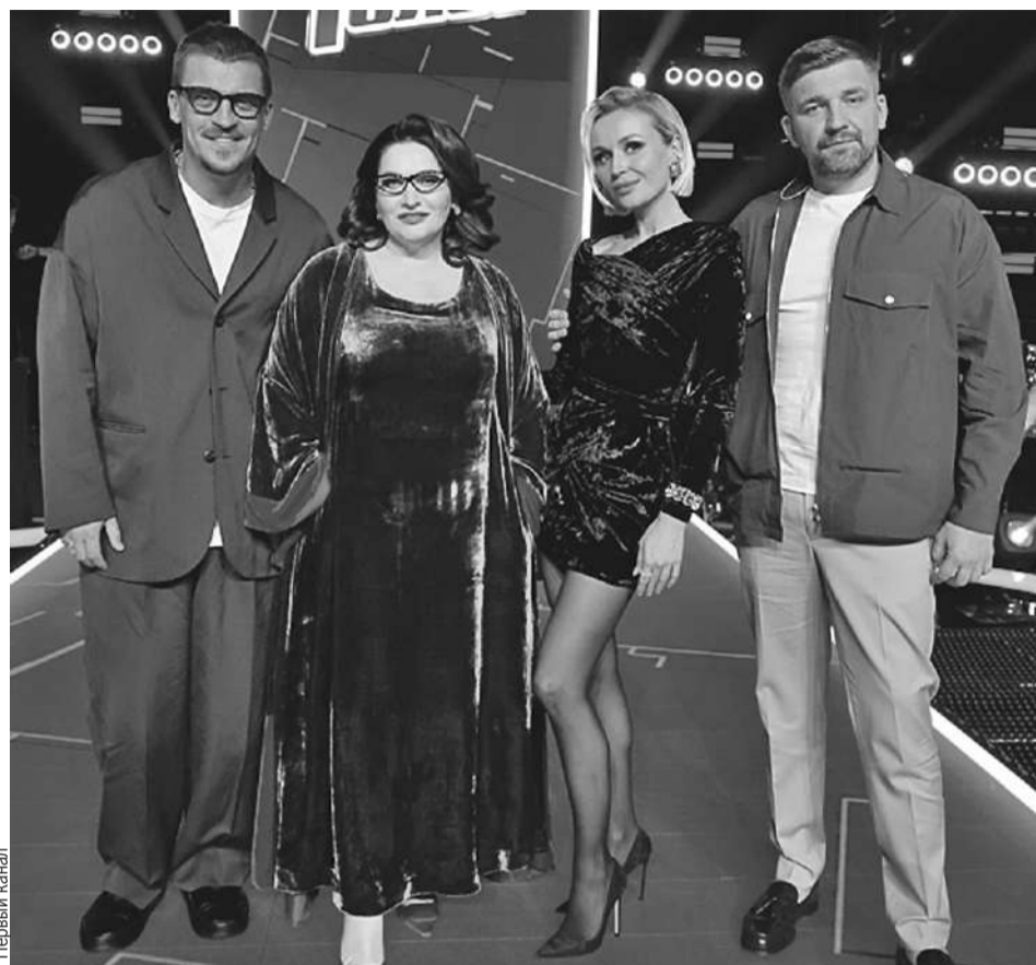
Искать музыкальные таланты в новом сезоне «Голоса» будут Антон Беляев, Хибла Герзмава, Полина Гагарина и Баста.

В-третьих, в этом сезоне на территории «Голоса» высадился некий зарубежный десант. Легионеры со всех стран света, включая недруже-