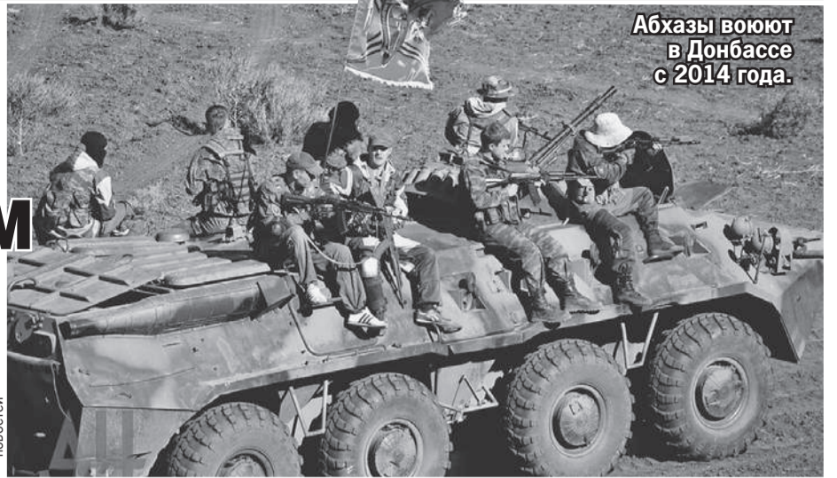
Абхазы воюют в Донбассе с 2014 года.

не было спонтанным. Ведь нас с детства воспитывали в братской любви к России. Мы еще пацанами были, когда в 1992 - 1993 годах к нам приехали добровольцы и помогали защищать свободу и независимость. Это были ребята и из России, и с Донбасса. Чувство благодарности к ним мы несем через всю жизнь. Когда началась СВО, все это как-то разом сработало.