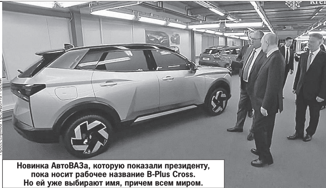
Новинка АвтоВАЗа, которую показали президенту, пока носит рабочее название B-Plus Cross. Но ей уже выбирают имя, причем всем миром.

Фото некоторых других моделей пока нет. Но мы обязательно к ним вернемся.