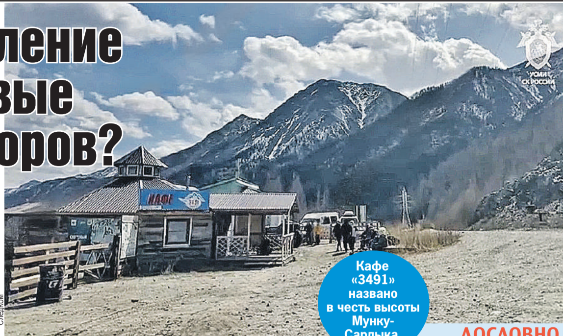
Кафе «3491» названо в честь высоты Мунку-Сардыка.