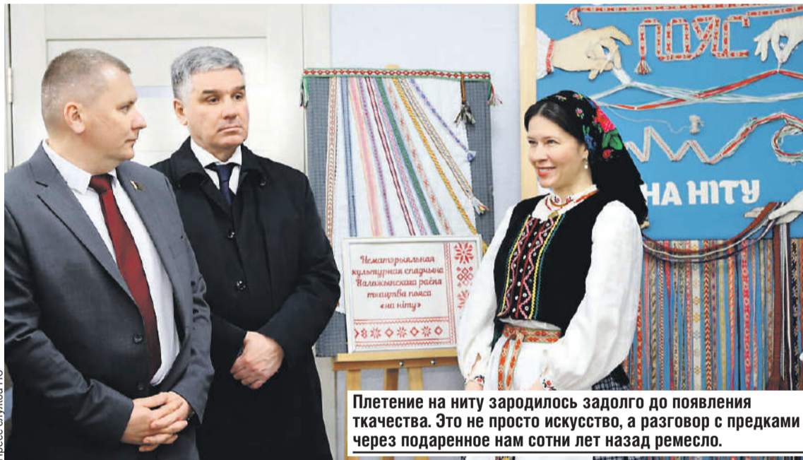
Плетение на ниту зародилось задолго до появления ткачества. Это не просто искусство, а разговор с предками через подаренное нам сотни лет назад ремесло.