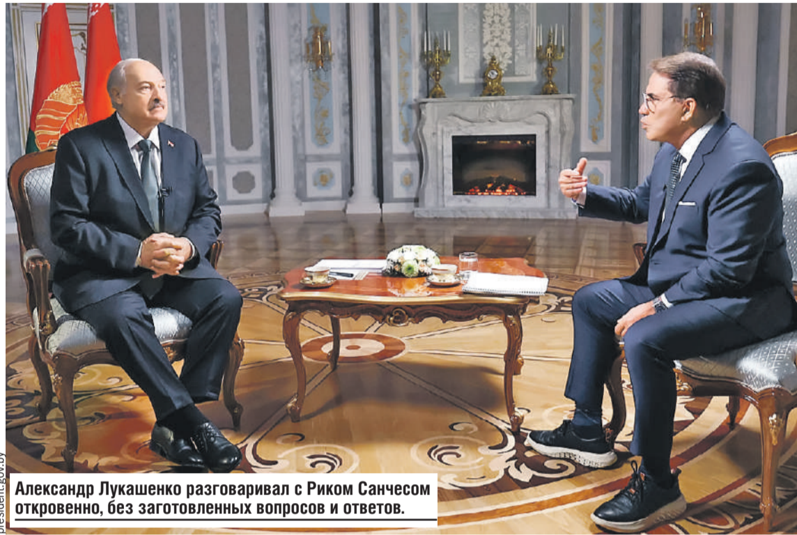
Александр Лукашенко разговаривал с Риком Санчесом откровенно, без заготовленных вопросов и ответов.

● Речь о большой сделке идет давно. Неправда, что я прямо горю желанием побывать в Соединенных Штатах Америки и вот просто пожать руку Дональду Трампу. Скажу откровенно, приятно было бы увидеть этого человека с глазу на глаз. Но это не самоцель, это не главное. Я же не Володя