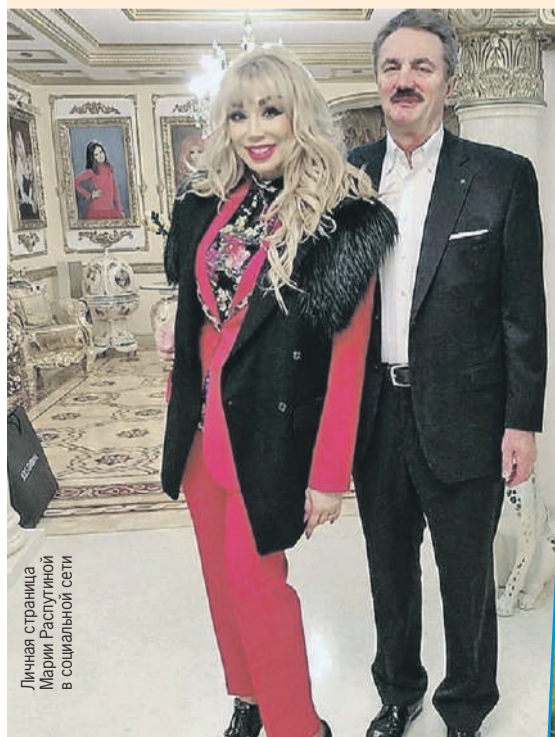
Личная страница Марии Распутиной в социальной сети

Семья Маши Распутиной и Виктора Захарова может продолжать жить в этом особняке (справа) на законных основаниях.