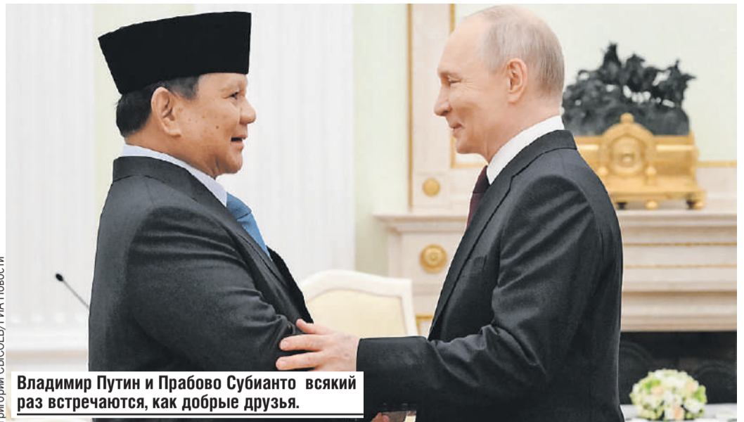
Владимир Путин и Прабово Субианто - каждый раз встречаются, как хорошие друзья.

- Сегодня в них работают около двух тысяч наших специалистов. В Белгородской, Курской, Брянской