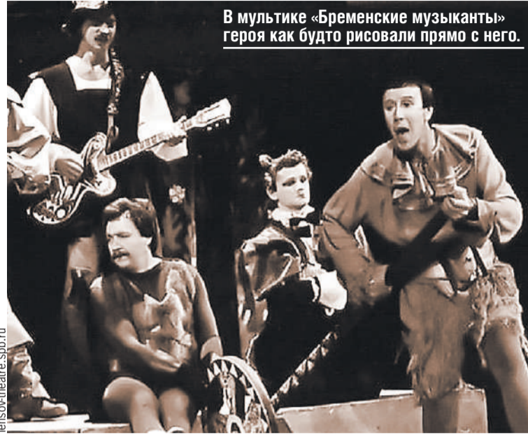
В мультфильме «Бременские музыканты» героя как будто рисовали прямо с него.

Еще через пять лет Абдулов стал суперзвездой советского кино.