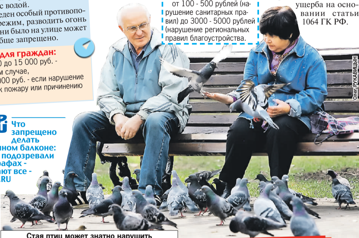
Стая птиц может знатно нарушить правила благоустройства...

от 100 - 500 рублей (нарушение санитарных правил) до 3000 - 5000 рублей (нарушение региональных правил благоустройства).