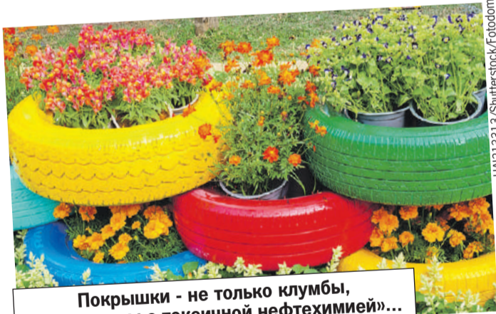
Покрышки - не только клумбы, но и «отходы с токсичной нефтехимией»...

Иными словами, даже если внутри старой шины цветут незабудки, покрышка - все равно отходы с «токсичной нефтехимией». И за складирование покрышек