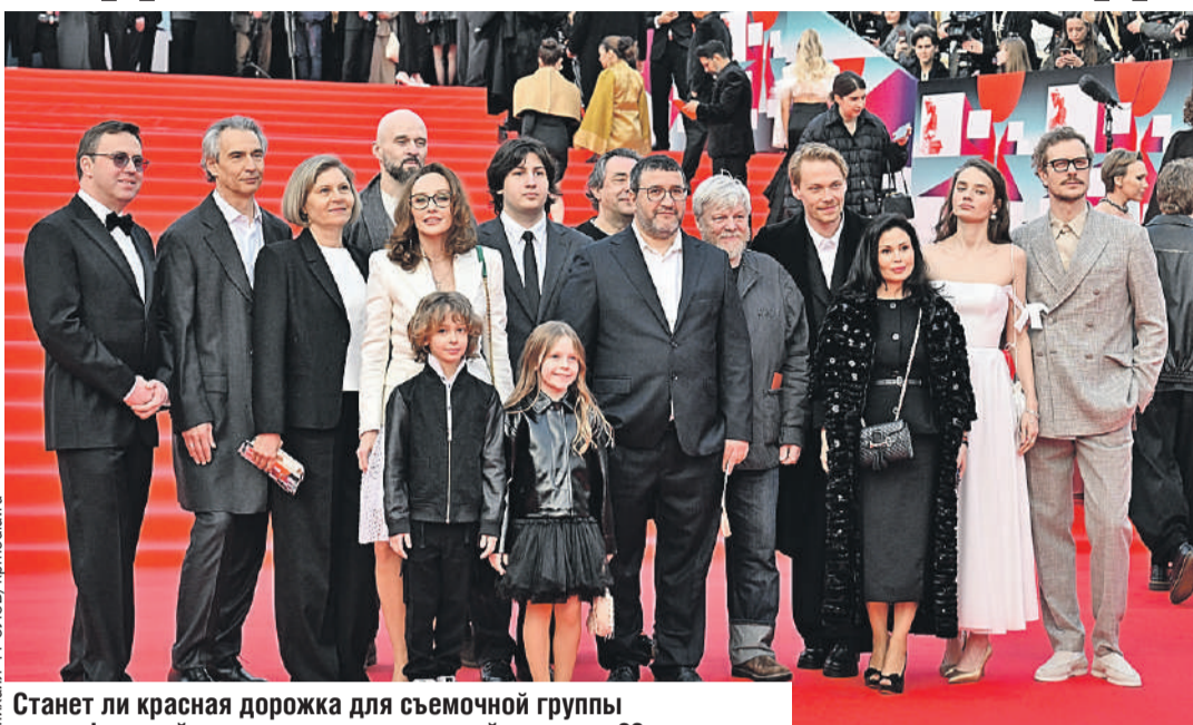
Станет ли красная дорожка для съемочной группы триумфальной, покажет прокат, который стартует 23 апреля.