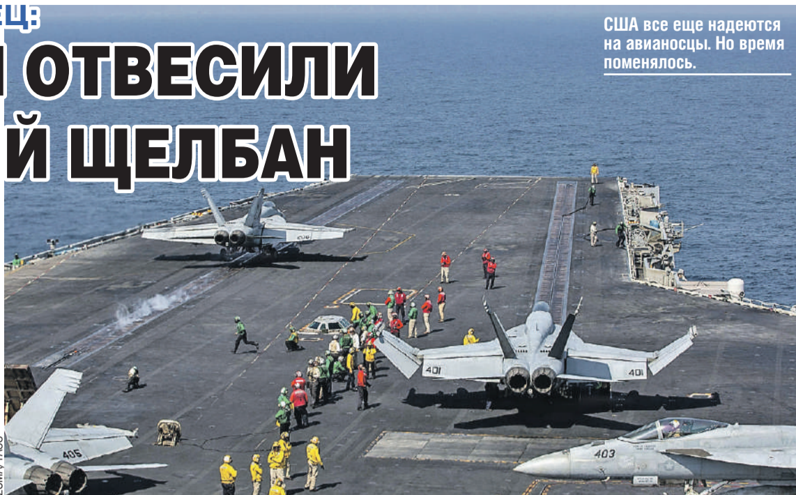
США все еще надеются на авианосцы. Но время поменялось.

- Иран, безусловно, отвесил могучий щелбан Соединенным Штатам, унизил их. Пентагон отводил на операцию четыре дня, потом четыре недели, потом сто дней. А потом вдруг в Вашингтоне почесали затылок и говорят: «Иран, может, давай сядем за стол переговоров?» Это, безусловно, капиту-