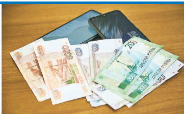
Аферисты убедили сибирячку отправить деньги на якобы «безопасный счет».

Пенсионерке позвонил мужчина, который представился сотрудником предприятия, где она раньше работала. Он сообщил, что бывшие коллеги пенсионерки подозреваются в финансировании террористических организаций. Далее сибирячке позвонили другие жулики: они заявили, что якобы после первого звонка от имени пожилой женщины была оформлена генеральная доверенность. Мол, теперь