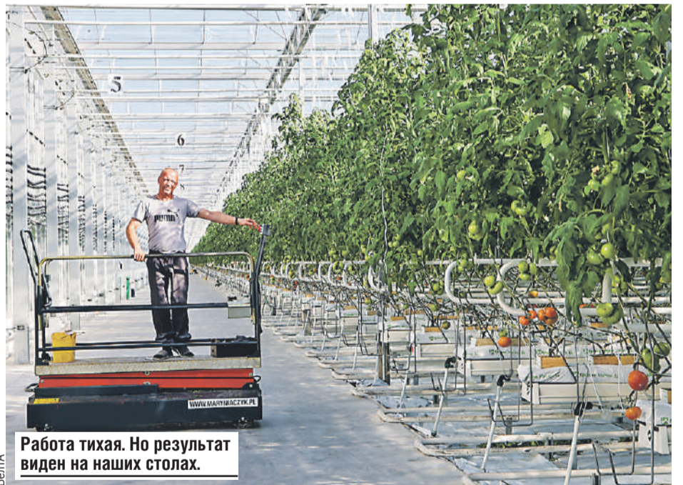
Работа тихая. Но результат виден на наших столах.