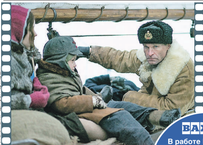
Кинокомпания «Централ Партнершип»