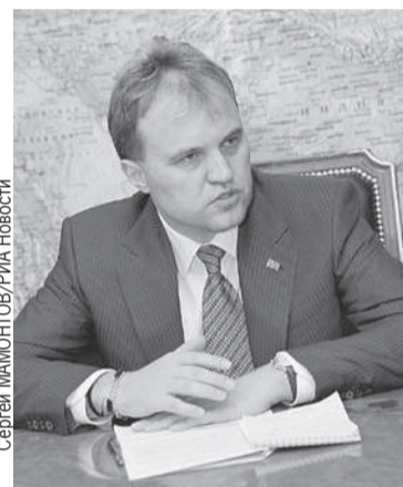
Евгений Шевчук несколько лет возглавлял Приднестровье.

- Большинство граждан всегда выступали против вывода российских миротворцев. Российские войска - в зоне разделения между вооруженными силами Молдавии и Приднестровья они являются сдерживающим фактором. Чтобы противоречия в экономической и политической плоскости не перетекли в агрессивную форму.