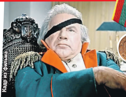
На войне Игорь Ильинский был рядовым фронтовой бригады. До звания фельдмаршала было еще 20 лет - фильм «Гусарская баллада», где он сыграл Кутузова, вышел в 1962 году.

Он не мог смириться с ужасами военной жизни - его пугала не столько опасность, сколько обыденность гибели: «...В овраге я вижу наш исковерканный обгоревший танк. Он уже несколько дней стоит здесь. Я заглядываю внутрь и вижу обгорелый и обуглившийся труп, слившийся с рулевым управлением.