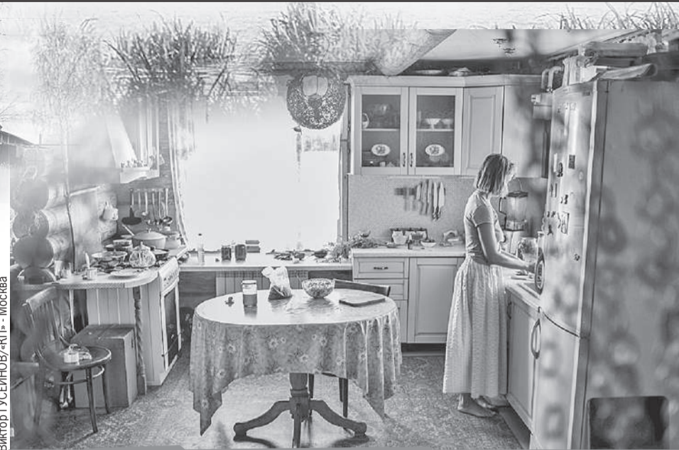
Переехавшие из мегаполисов устраивают свой деревенский быт не по сельским обычаям - по городским, чтобы не только красиво было, но и быт облегчалось...

- Сейчас стало правилом хорошего тона: каждая областная администрация должна иметь хотя бы один образовательный историко-культурный объект. «Иркутская деревня», «Кубанская деревня». То есть местная бюрократия заботится о локальной идентичности и думает о туризме.