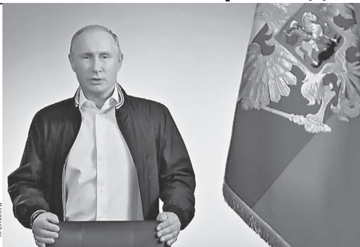
Владимир Путин поздравил выпускников школ 2018 года в соцсети, которая сегодня наиболее популярна у тинейджеров.

- Вы быстро осваиваете новые технологии, уже многое знаете и умеете. В этом ваша заслуга - и искренняя благодарность вашим родителям, учителям, наставникам за труд, мудрость и терпение.