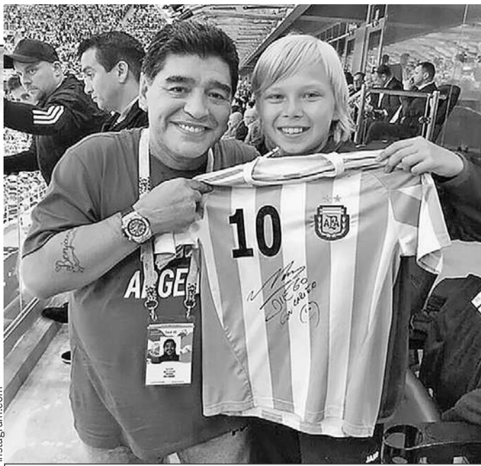
Не каждому поклоннику футбола выпадает такое счастье, чтобы тебя обнял сам Марадона.

Но Марадона сам заметил в толпе светловолосого