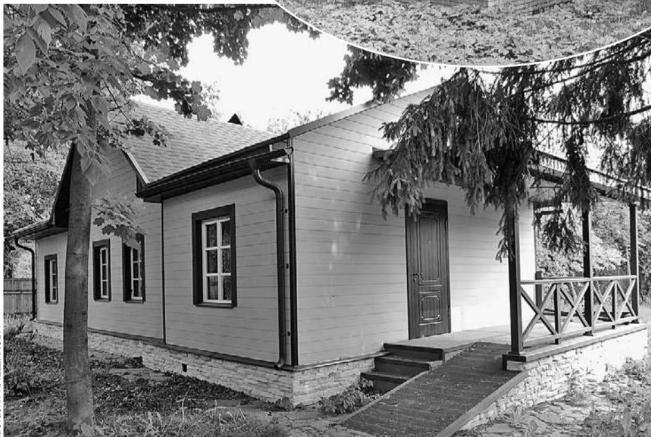
Дача Баталовых, хоть ее и преобразили дизайнеры программы «Идеальный ремонт» на Первом канале, стоит пустая. Пока сосед не снесет незаконные постройки, хозяева сюда ни ногой.