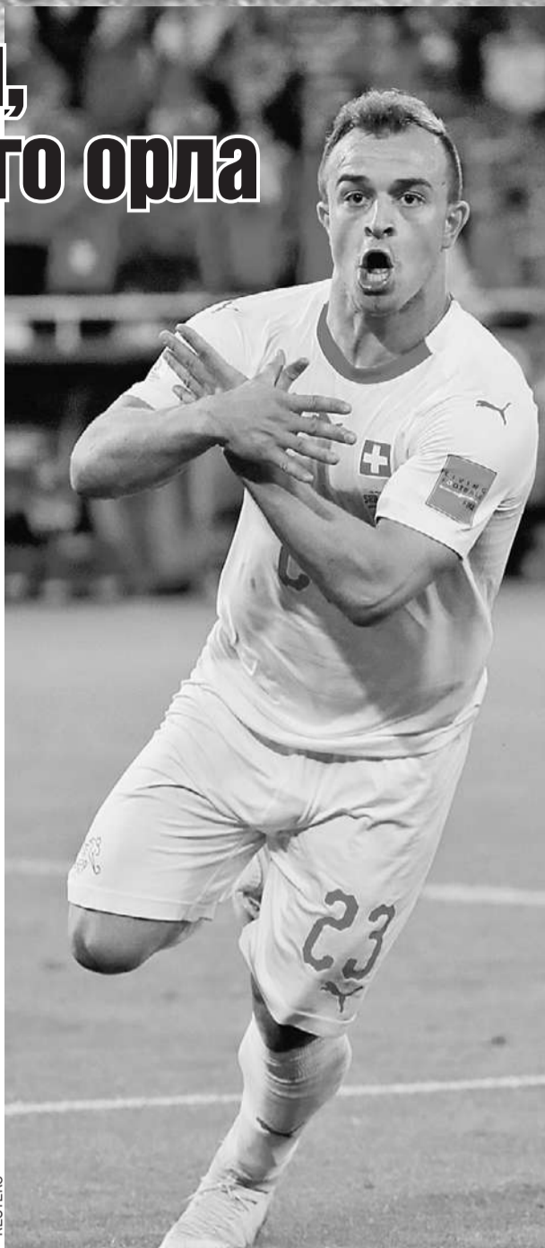
Джердан Шакири умудрился на поле спровоцировать международный конфликт.

Сербь негодуют, говорят о двойных стандартах и о том, что чиновники пытаются спустить весь этот скандал на тормозах. Словом, Шакири, похоже, отделался желтой карточкой, которую он получил за то, что после забитого гола снял майку. Тут же посыпались комментарии, что у Шакири оказалась слишком развитая для футболиста мускулатура и надо бы еще проверить его на анаболики.