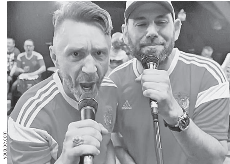
Шнур (слева) в случае поражения нашей сборной напишет новую песню...

Будем бутсы целовать вам, только знайте, чемпионы, стоит разик проиграть вам, снова станете - ***.