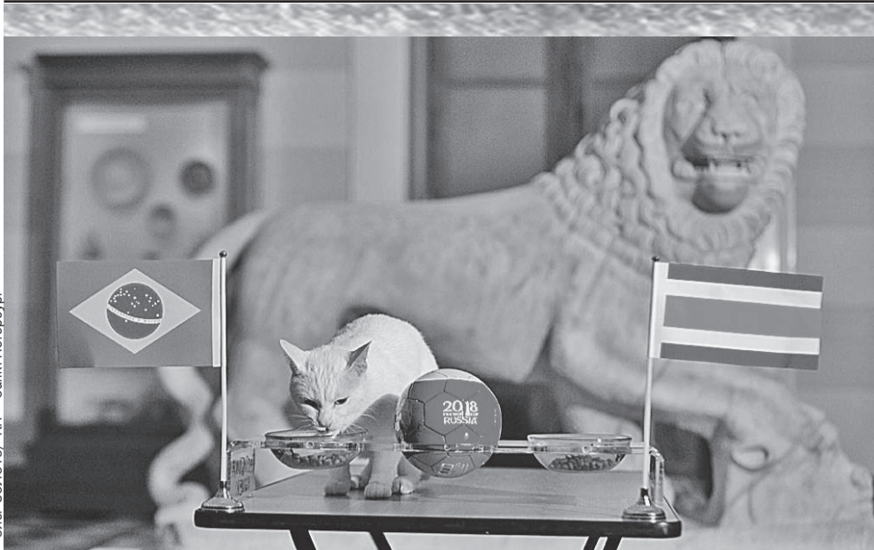
Кот-оракул Ахилл предсказал победу сборной Бразилии над Коста-Рикой. Пентакампионы выиграли 2:0, забив два мяча в самом конце игры.