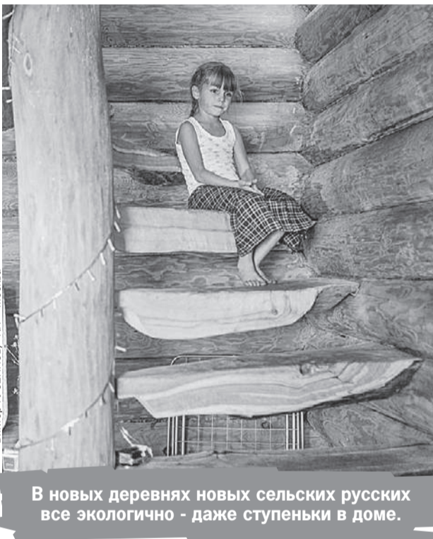
В новых деревнях новых сельских русских все экологично - даже ступеньки в доме.

местности, очень много людей умерло. Умирали одиночки-алкоголики, умирали и сгорали в своих домах целыми пьющими семьями. А статистика говорит, что употребление алкоголя стало снижаться только в последние годы. Руководители сельхозпредприятий так мне и говорят: «В брежневские времена квасили все, начиная с руководи-