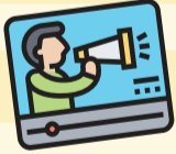
Дмитрий ПОЛУХИН/Комсомольская правда