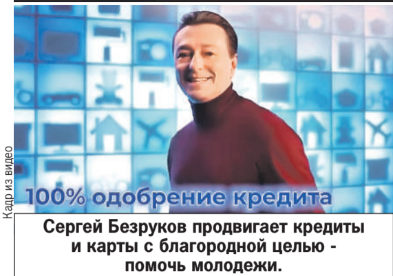
Кадр из видео