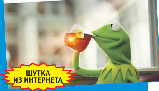
ШУТКА ИЗ ИНТЕРНЕТА

Люблю этот стиль лечения, когда просто пьёшь чай с лимоном и надеешься, что всё само пройдёт