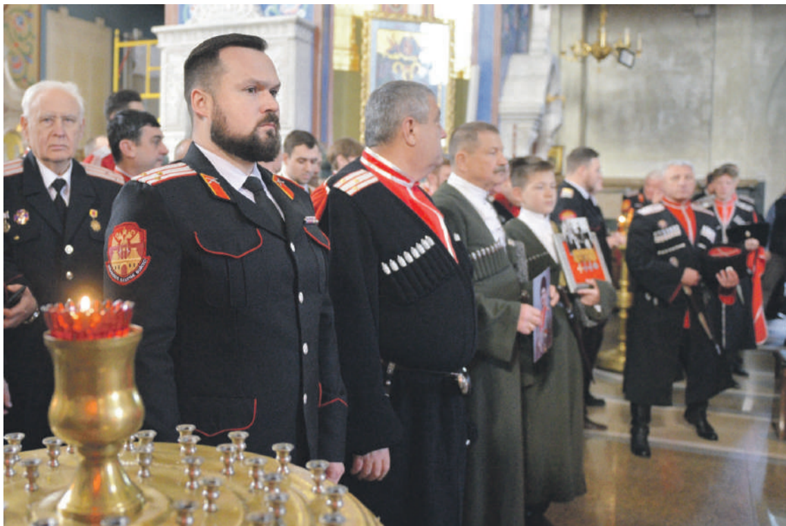
В Войсковом соборе святого благоверного князя Александра Невского прошла заупокойная лития по казакам, убиенным в годы репрессий.

Система непрерывного казачьего образования на Кубани признана лучшей в России, а