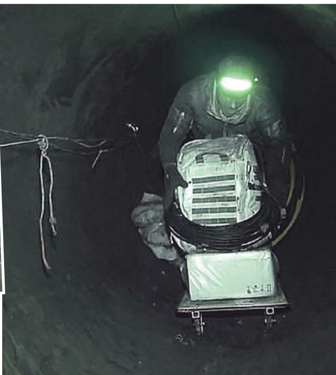
Пресс-служба Добровольческого штурмового корпуса