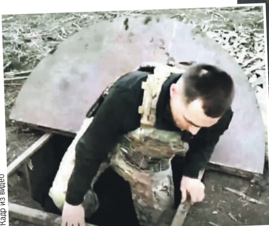
Вот так начиналась знаменитая операция «Поток». Вход метр на метр, диаметр трубы всего 1,4 метра, оружие и припасы толкали вперед на тележках 14 км (см. фото справа).

Ближе к марту командир поставил задачу купить синий скотч для повязок на рукава, как у противника, чтобы сбить его с толку во