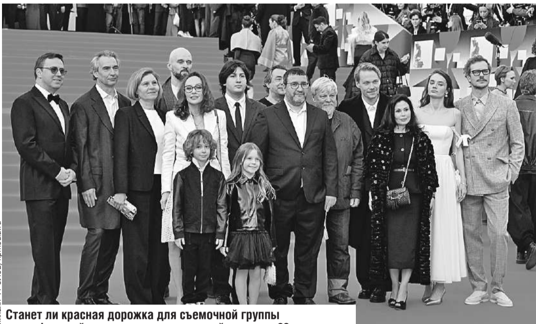
Станет ли красная дорожка для съемочной группы триумфальной, покажет прокат, который стартует 23 апреля.

От России в жюри - режиссер Иван Твердовский и актриса Дарья Екамасова. Фильм «Жила одна баба», который сделал ее знамени-