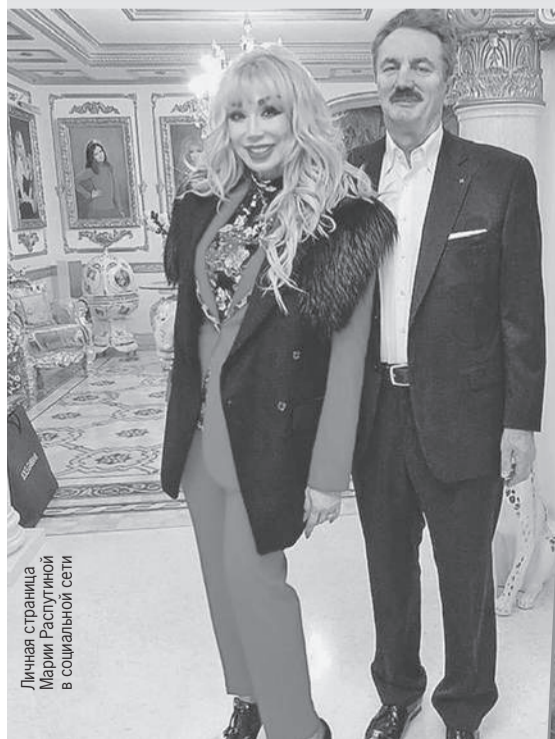
Личная страница Марии Распутиной в социальной сети