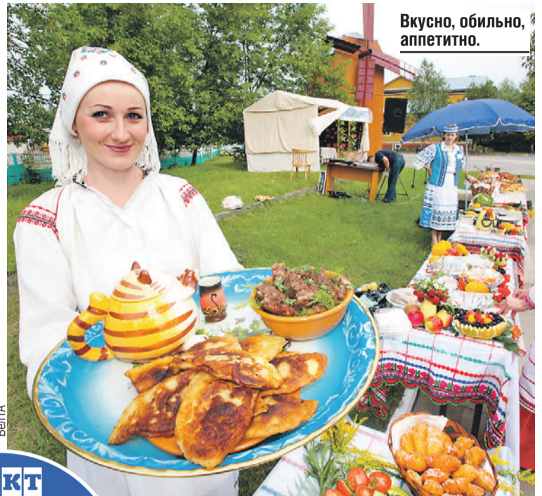
Вкусно, обильно, аппетитно.