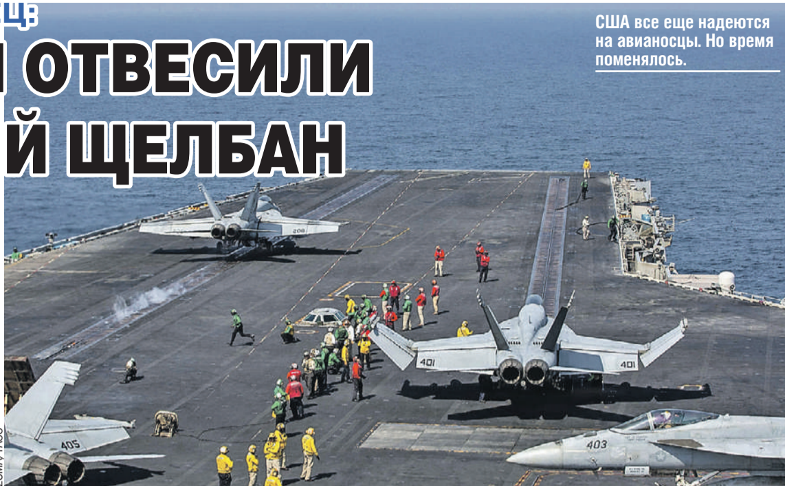
США все еще надеются на авианосцы. Но время поменялось.

- Иран, безусловно, отвесил могучий щелбан Соединенным Штатам, унизил их. Пентагон отводил на операцию четыре дня, потом четыре недели, потом сто дней. А потом вдруг в Вашингтоне почесали затылок и говорят: «Иран, может, давай сядем за стол переговоров?» Это, безусловно, капиту-