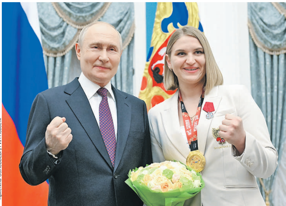
Пятикратная чемпионка России и чемпионка мира Анастасия Шамонова вместе с президентом показывают - осталась еще силушка богатырская!

поведение прежнего руководства Международного олимпийского комитета нанесло огромный ущерб самим принципам олимпизма. Избирательные санкции в отношении российских атлетов под предлогом осуждения действий России в рамках конфликта на Украине, при полном игнорировании других аналогичных вооруженных конфликтов, лишь