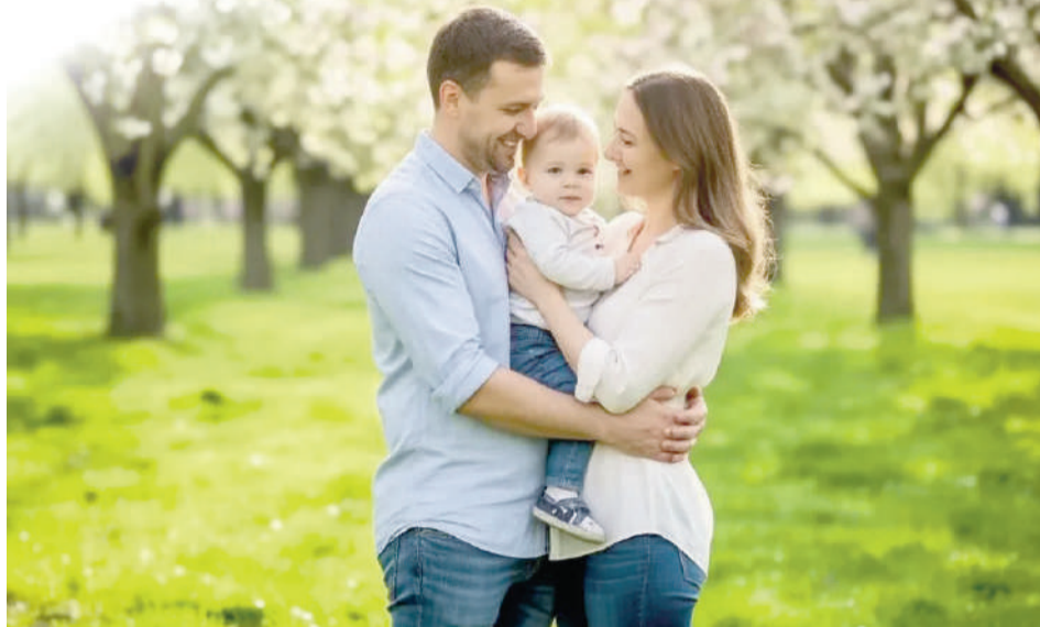
ООО «Арсенал МС» - Реклама

речень детских поликлиник, работающих в системе ОМС, размещен на сайте СМО и Территориального фонда ОМС.