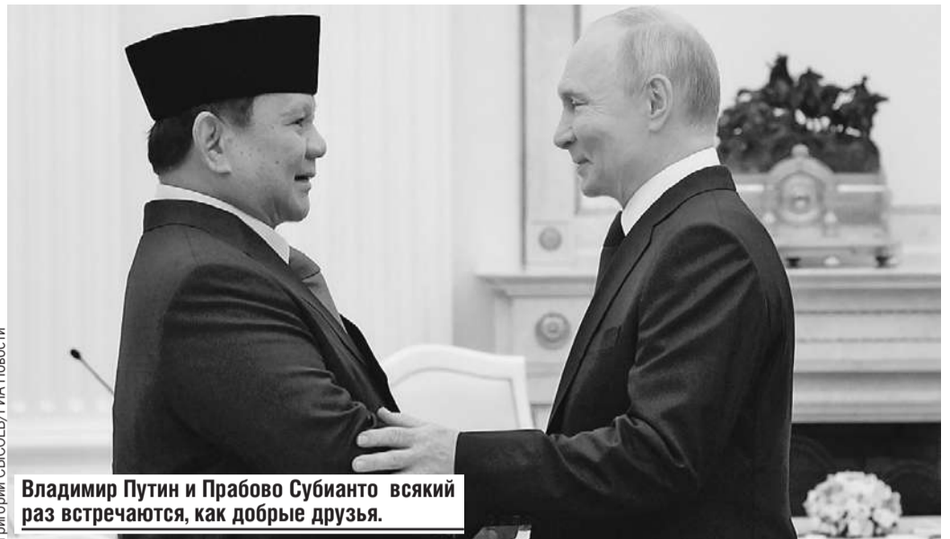
Владимир Путин и Прабово Субианто - каждый раз встречаются, как хорошие друзья.

- Отдельно поговорим о ситуации в сфере государственных финансов. Мы с вами не раз отмечали, насколько важно выдерживать курс на сбалансированность бюджета, сохранять его устойчивость, нацеленность на развитие, в том числе в условиях резких колебаний конъюнктуры на внешних рынках. Мы это внимательно с вами отслеживаем, видим, что происходит. Правительство подготовило соответствующие меры, - завершил открытую часть совещания Владимир Путин.