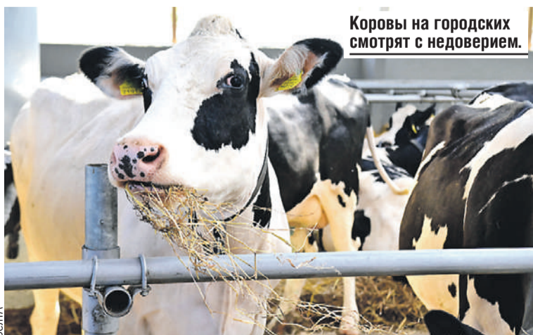
Коровы на городских смотрят с недоверием.

Единственная реальная возможность сдерживать дальнейшую экспансию борщевика и золотарника, на ее взгляд, это вовлечение в хозяйственный оборот земель путем выращивания на них различных сельскохозяйственных культур, прежде чем там появятся растения-захватчики.