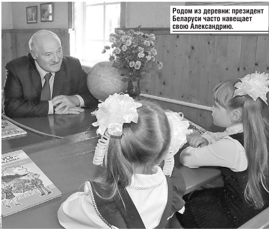
Родом из деревни: президент Беларуси часто навещает свою Александрию.

стол факты никто не положил. Нет таких фактов.