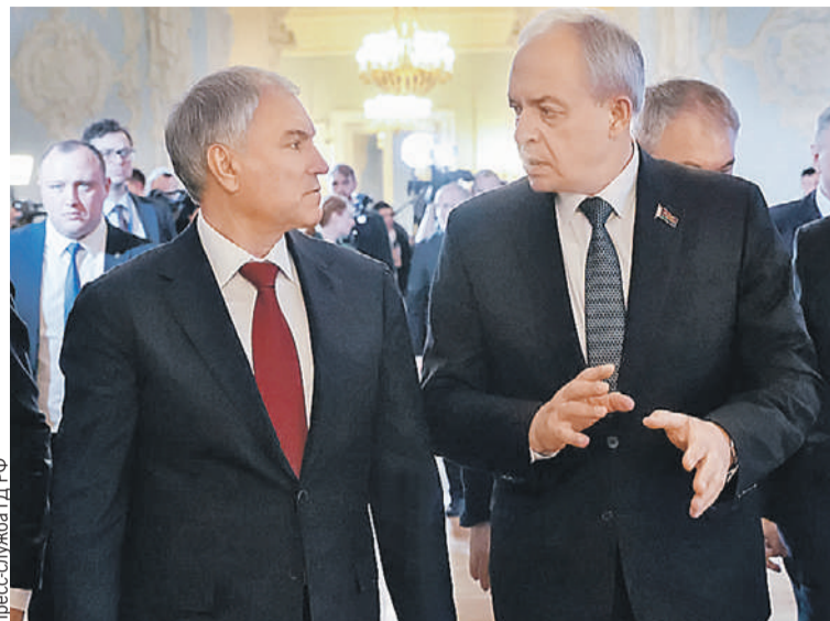
Вячеслав Володин и Игорь Сергеенко считают, что защита исторической памяти - фундаментальный вопрос.

- Нас объединяет не только прошлое. Вместе мы строим будущее наших стран. И, пользуясь случаем, мы