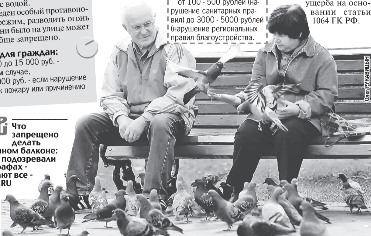
Стая птиц может знатно нарушить правила благоустройства...

от 100 - 500 рублей (нарушение санитарных правил) до 3000 - 5000 рублей (нарушение региональных правил благоустройства).