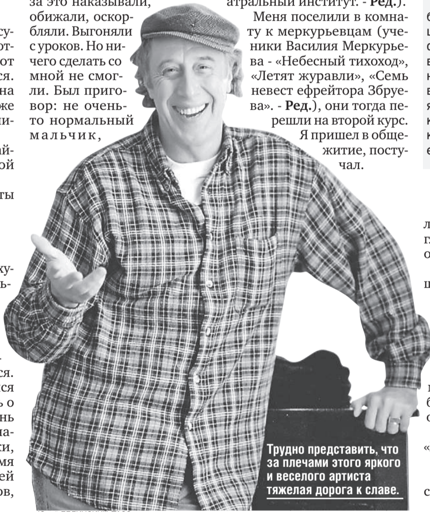
Трудно представить, что за плечами этого яркого и веселого артиста тяжелая дорога к славе.

В силу своей генетики я все время кривлялся. Меня за это наказывали, обижали, оскорбляли. Выгоняли с уроков. Но ничего сделать со мной не смогли. Был приговор: не очень-то нормальный мальчик,