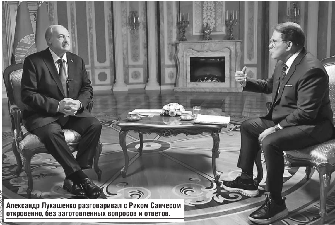
Александр Лукашенко разговаривал с Риком Санчесом откровенно, без заготовленных вопросов и ответов.

Зеленский, который побежит к Дональду Трампу просить деньги или оружие. Мне кланяться и что-то выпрашивать не надо.