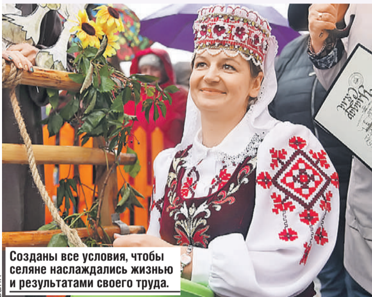
Созданы все условия, чтобы селяне наслаждались жизнью и результатами своего труда.

перечислил условия для роста экспорта востребованной продукции. Среди ключевых факторов - рост цен на энергоносители, сокращение производства удобрений, сбой логистики - например, через Ормузский пролив. В то же время специалист обращает внимание: потенциальный экспортный выигрыш для Беларуси и России носит циклический, а не стратегический характер - мировая аграрная система обладает высокой адаптивностью.