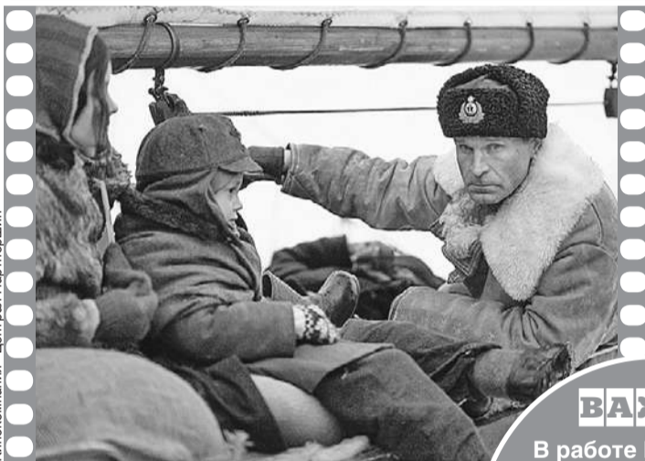
Кинокомпания «Централ Партнершип»