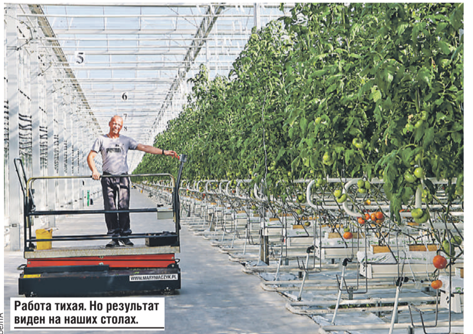
Работа тихая. Но результат виден на наших столах.

В Союзном государстве мы дополняем друг друга. У нас выстроена законодательная база, которая не препятствует свободному продвижению товаров и рабочей силы. Мы достойно выполняем свои обязательства перед нашим общим рынком.