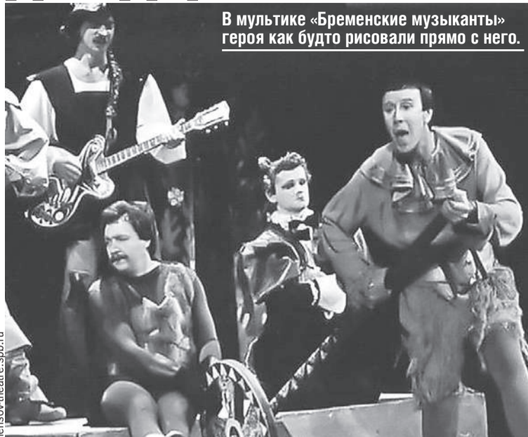
В мультике «Бременские музыканты» героя как будто рисовали прямо с него.

Еще через пять лет Абдулов стал суперзвездой советского кино.