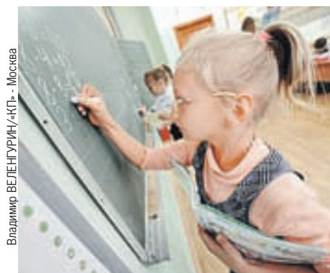
Владимир ВЕЛЕНУРИН/«КП» - Москва

Подробности читайте на > страницах 3, 6-7.