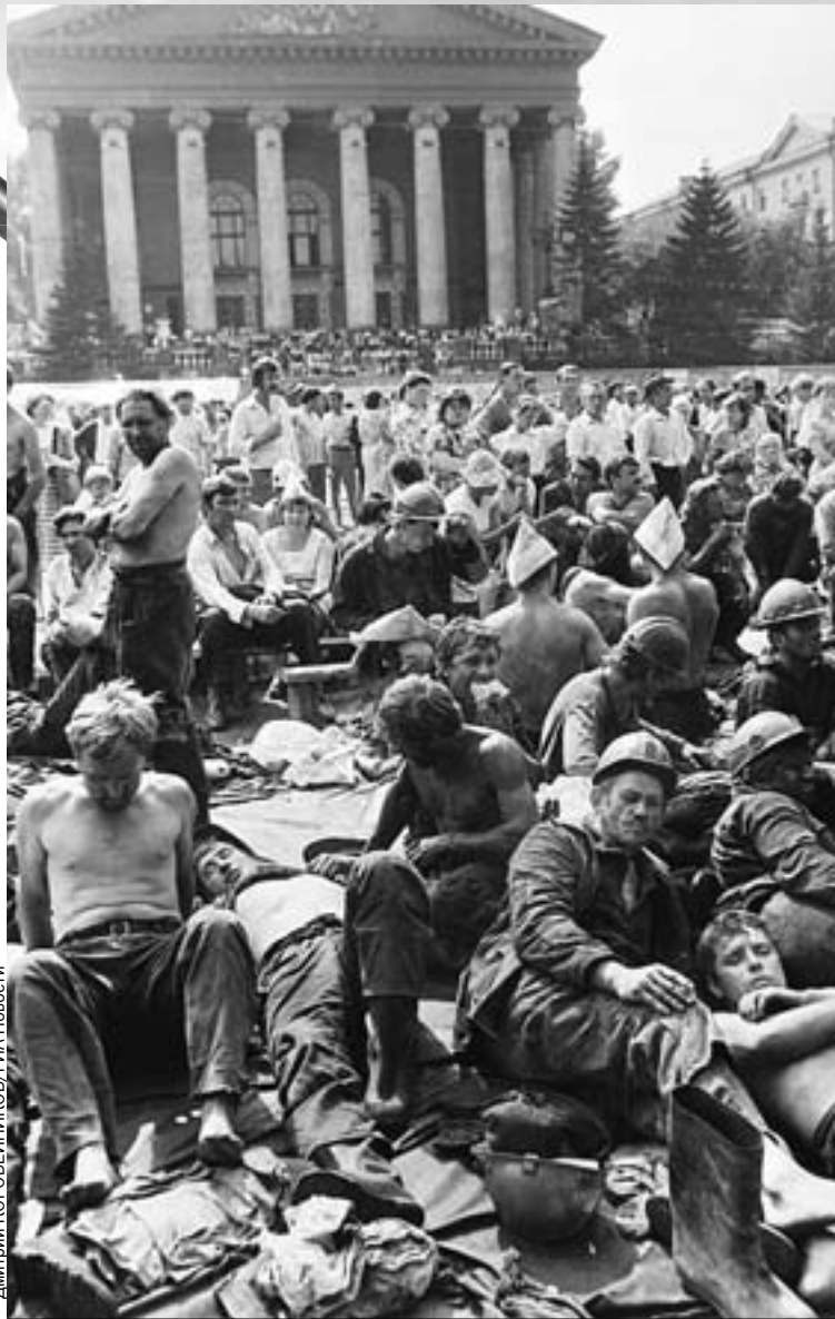
Когда Тулеев возглавил Кузбасс, бастующие шахтеры на центральной площади Кемерова были обычной картиной.