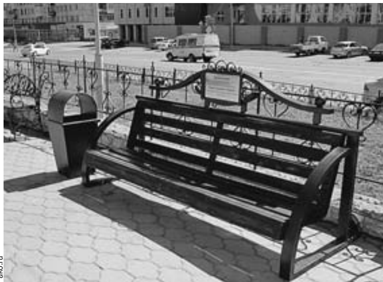
Таблички на лавочках областного центра извещают горожан, что и эти городские удобства появились благодаря неусыпной заботе о земляках со стороны Амана Гумировича.

На площади, где несколько дней назад бушевал немногочисленный, но громкий митинг про «Власть прячет трупы», - скамейка с надписью: «Парковый диван изготовлен и установлен в подарок горожанам от семьи Тулеева Амана Гумировича с пожеланиями приятного отдыха». В этом об-