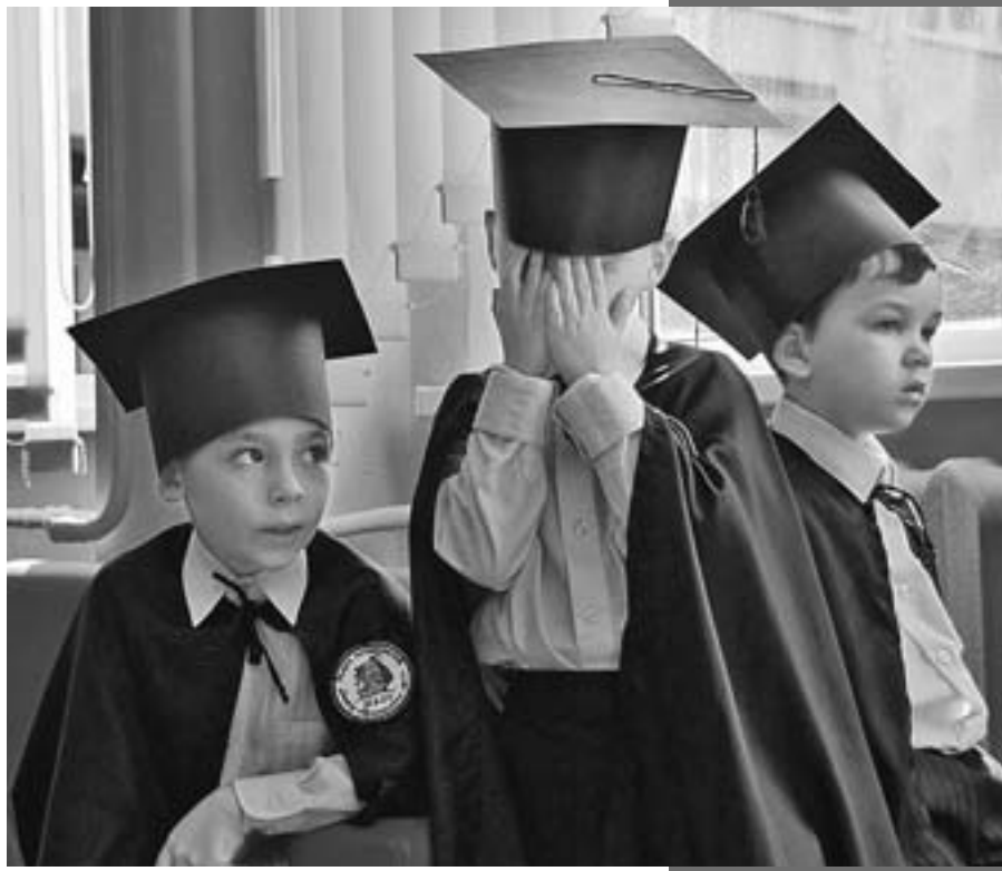
Алексей ФОКИН/«КП» - Тула

А выглядит она, например, так (цитирую дословно): «Оценка: прочитала эпизод из рассказа «Лошадиная фамилия». Достижения: чтение эмоциональное и выразительное. Смогла выбрать интерес-