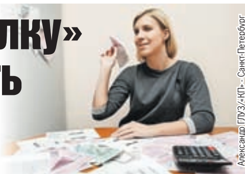
Александр ГЛУЗ/«КП» - Санкт-Петербург

90,6 FM РАДИО КОМСОМОЛЬСКАЯ ПРАВДА 22.05