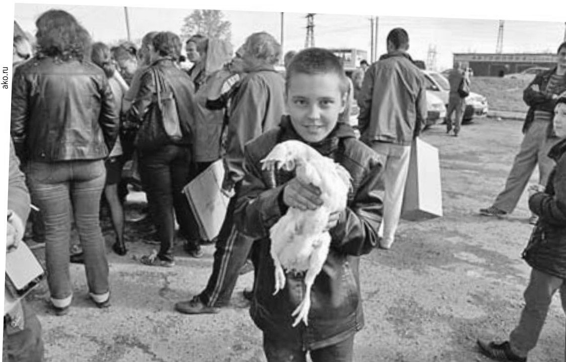
В город Юрга привезли кур для раздачи. Такие бесплатные «подарки от Тулеева» случались в населенных пунктах области чуть ли не каждый месяц.

...Пойду положу гвоздику на тумбочку в знак окончания эпохи Амангельды Тулеева.