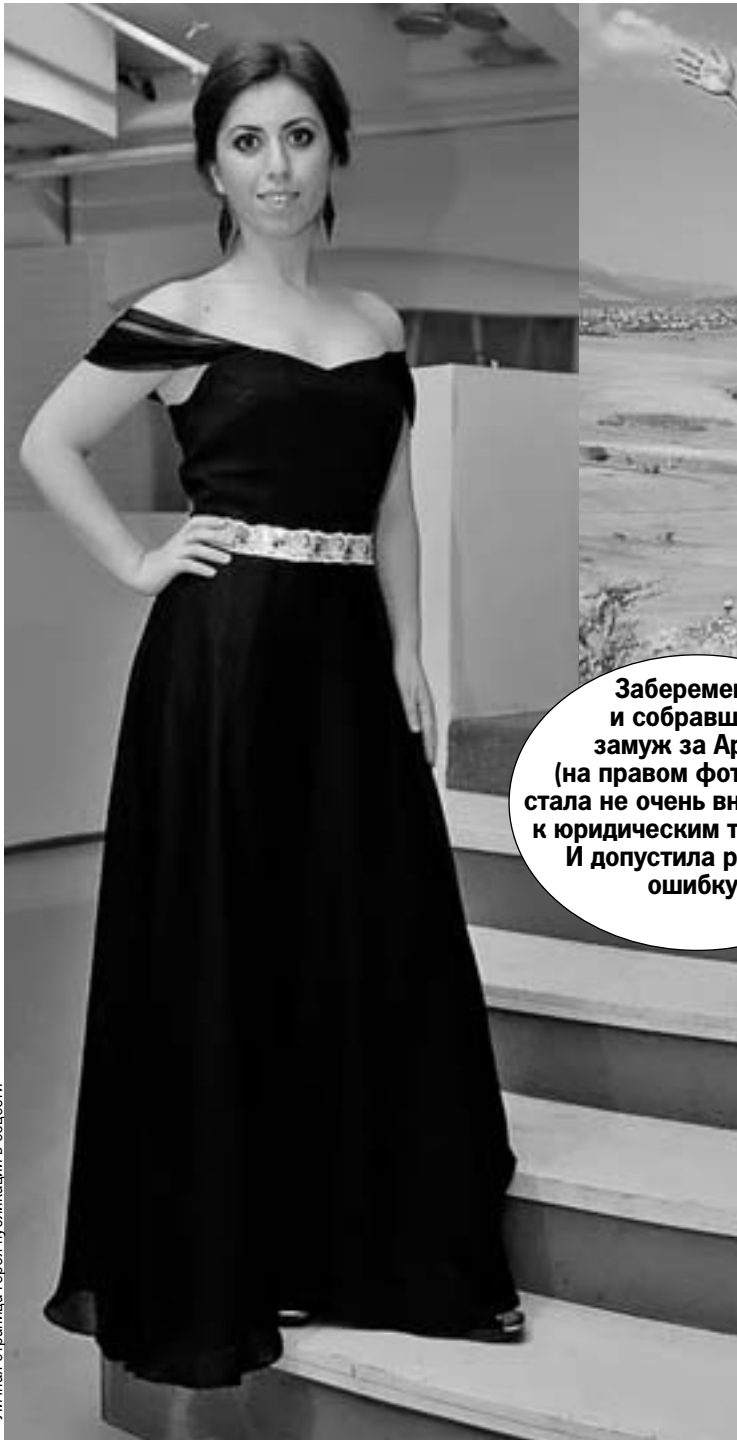
Личная секретарша героя публикации в соцсети