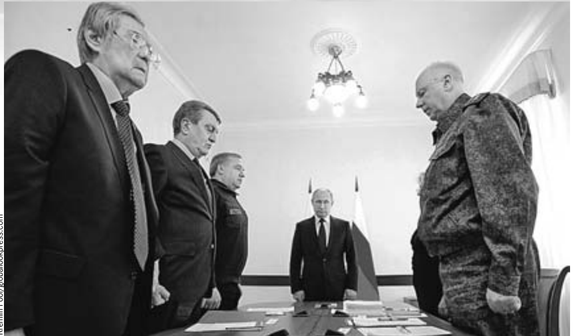
Последняя встреча губернатора Тулеева (на снимке крайний слева) с Владимиром Путиным состоялась 27 марта, когда президент прилетел в Кемерово после страшного пожара в торговом центре «Зимняя вишня». На встрече также присутствовали полпред президента в Сибирском федеральном округе Сергей Меняйло (второй слева), глава МЧС Владимир Пучков (третий слева) и председатель Следственного комитета Александр Бастрыкин (справа).

Но вот в 2016 году случился слом системы: в июле администрация Кемеровской области стала «работать» с собственником разреза «Инской», у которого две смены