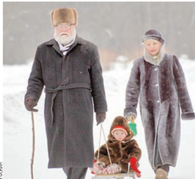
Увеличение продолжительности жизни - следствие возросшего уровня медицины.

пациентам с соответствующим диагнозом бесплатно, по полису ОМС. Растет и продолжительность жизни. За последние 10 лет в области средняя продолжительность жизни увеличилась на 5 лет.