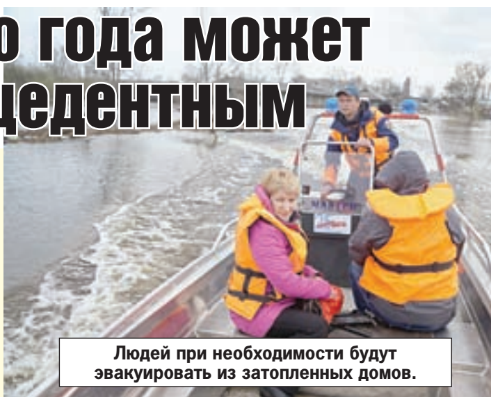
Людей при необходимости будут эвакуировать из затопленных домов.

Следите за прогнозами погоды и не игнорируйте рекомендации специалистов.