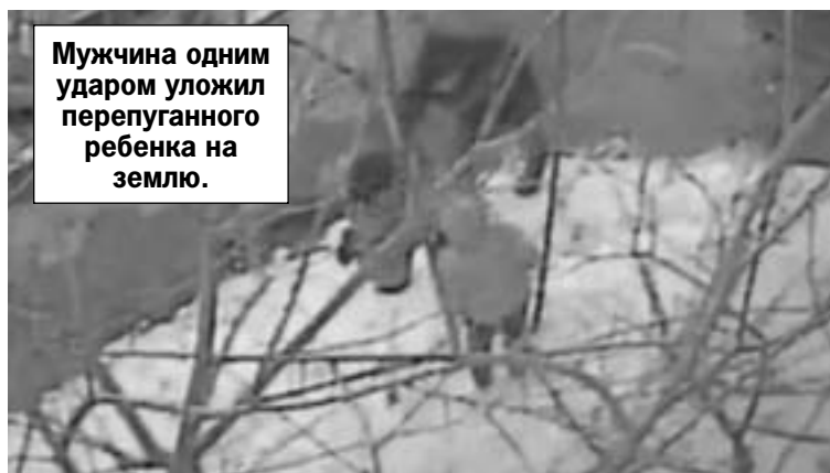
Мужчина одним ударом уложил перепуганного ребенка на землю.

Это увидел отец мальчика и буквально положил маленького «обидчика» сына на лопатки, пока родное чадо в шоке наблюдало за агрессивным поведением родителя. Смотреть это видео, скажем прямо, неприятно - взрослый мужчина на равных бьет ребенка. Мальчик встает с большим трудом. Дома он рассказал обо всем родителям. Те, конечно, решили добиваться справедливости в полиции. Вот только удар бесследно для здоровья ребенка не прошел