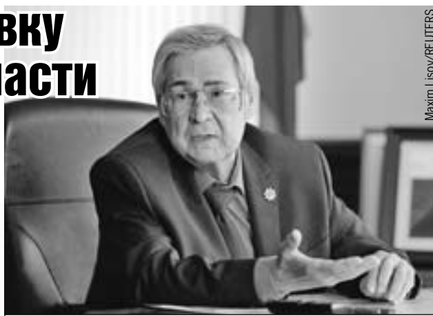
По мнению многих, губернатор Аман Тулеев слишком задержался в этой должности.