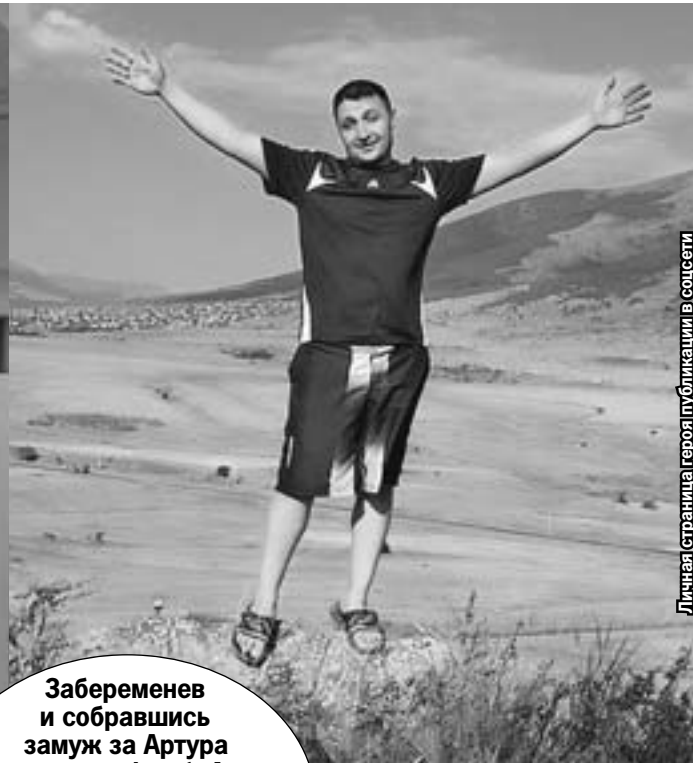
Личная секретарша героя публикации в соцсети