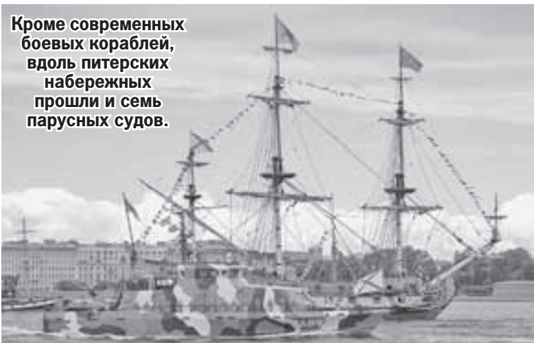
Артём КИЛЬКИН/«КП» - Москва

Кроме современных боевых кораблей, вдоль питерских набережных прошли и семь парусных судов.