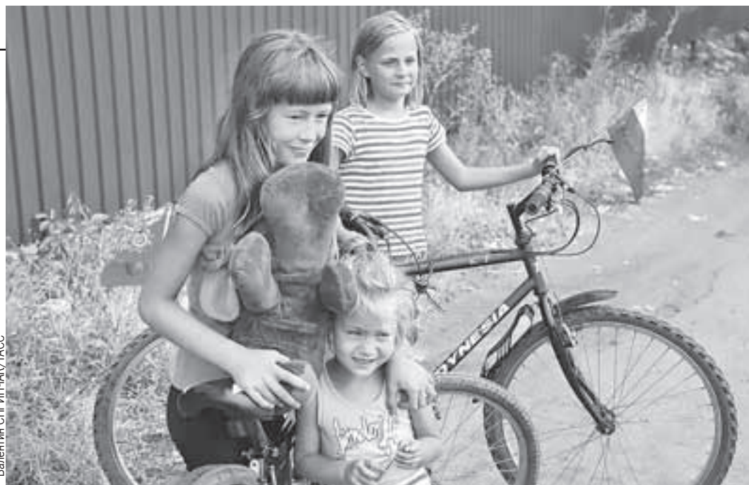
А это дети Мариуполя. Весной здесь гремели бои, а теперь лето и почти Россия.

- Ты можешь сравнить противника в 2014-м и в 2022-м. Что изменилось?