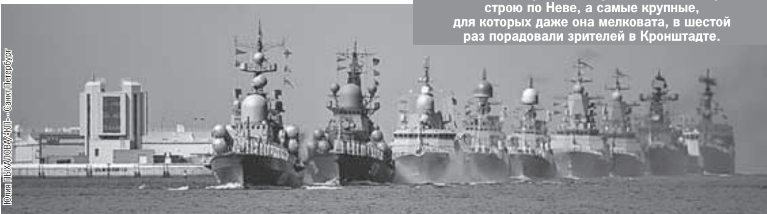
Юлия ПИХАЛОВА/«КП» - Санкт-Петербург