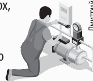
Дмитрий ПОЛУХИН/Комсомольская правда