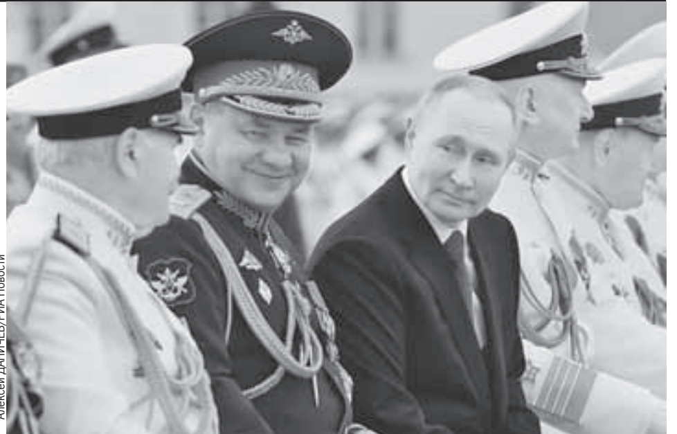
В последнее воскресенье июля в Питере президент Владимир Путин и министр обороны Сергей Шойгу на военно-морском параде по случаю Дня ВМФ не только осмотрели наши лучшие корабли, но и с интересом общались с ветеранами флота.

Часть из 40 надводных кораблей 4 флотов и Каспийской флотилии прошли в кильватерном строю по Неве, а самые крупные, для которых даже она мелковата, в шестой раз порадовали зрителей в Кронштадте.