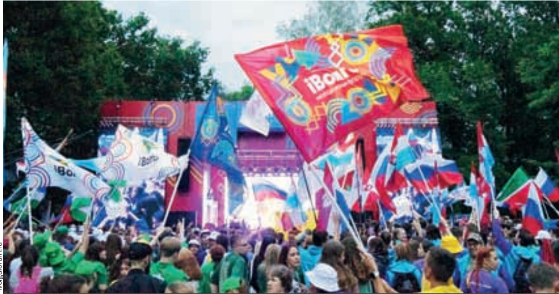
Юбилейный, 10-й форум «iВолга» прошел.

- Наша молодежь самая хорошая. Мы всегда с вами! Если что-то проект не победил, не расстраивайтесь. Мы отдельно встретимся и посмотрим, какие у вас есть интересные идеи, - сказал глава региона.