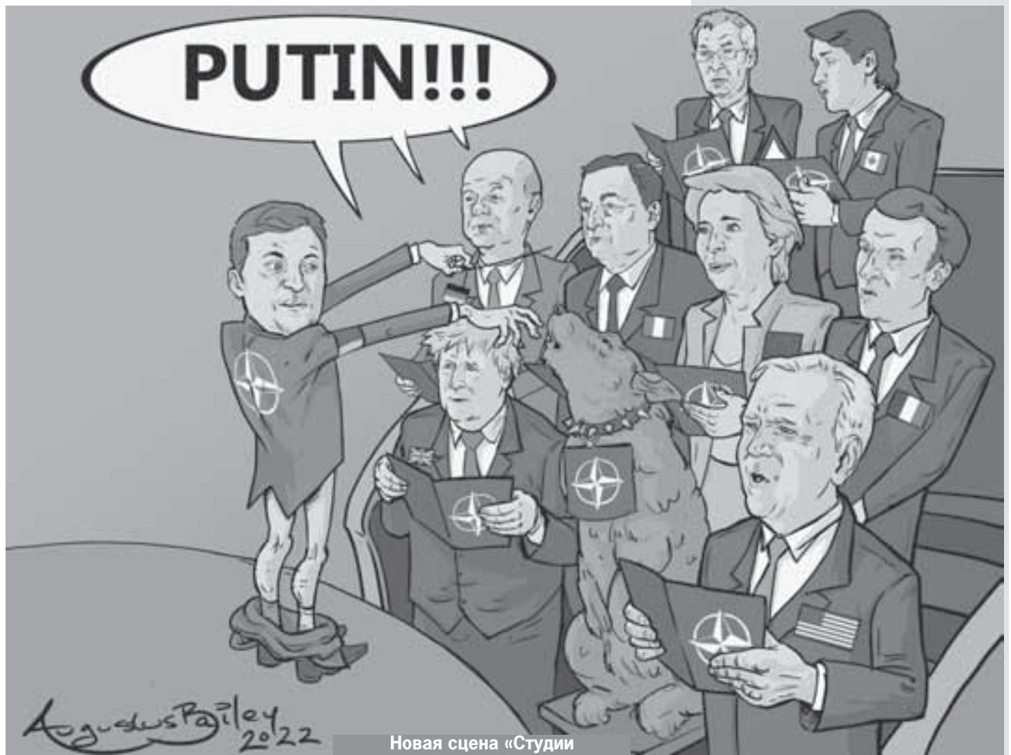
Новая сцена «Студии Квартал-95».

- Украина - последняя катастрофа тех, кто втянул нас в эту трясиину, когда они заявили, что США должны доминировать в мире и противостоять растущим региональным державам, которые могут когда-нибудь бросить вызов глобальному или региональному превосходству США.