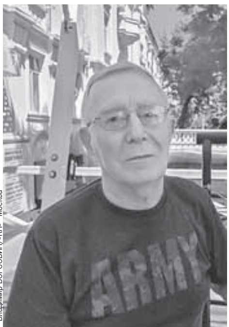
Владимир ВОРСОВИН/«КП» - Москва

В этот момент человек тридцать окружили машину клиента и с истошным криком пихались, толкались,