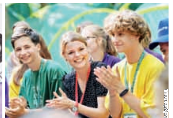
Атмосфера «iВолги» - молодежный драйв и позитив.