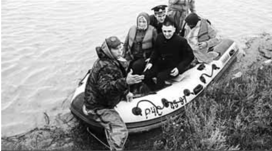
Спасатели весь день инспектировали местность и оперативно оказывали помощь нуждающимся.