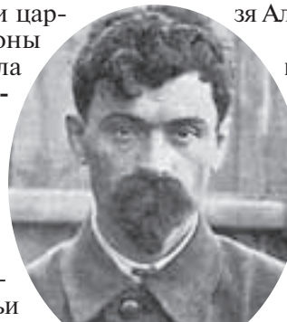
Расстрельная команда уроженца Каинска Якова Юровского убила царя и его близких.