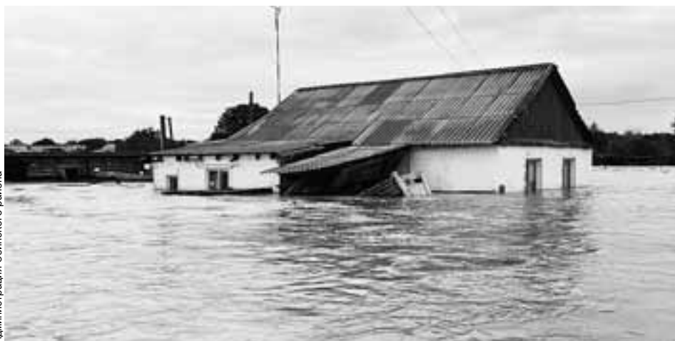
Правительство области распорядилось составить список всех пострадавших от стихии.

В 15.30 в Управлении ГИБДД по Саратовской области приняли решение перекрыть движение транспорта на подтопленном участке автодо-