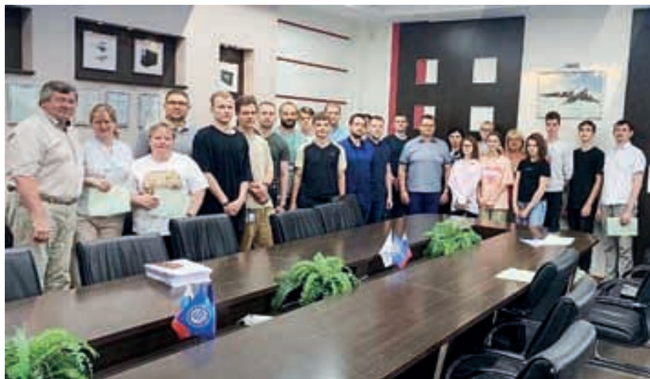
Сотрудничество предприятий и колледжей является основой ранней профориентации учеников.

ноутбуков и многофункционального устройства.