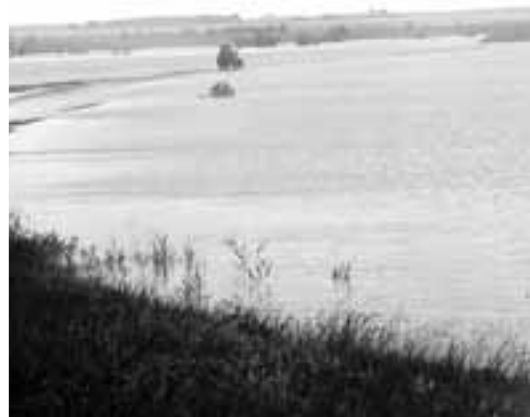
Администрация Озинского района

Как заверила районная администрация, чиновники начали разработку мер по компенсации последствий подтопления для жителей Солянки.