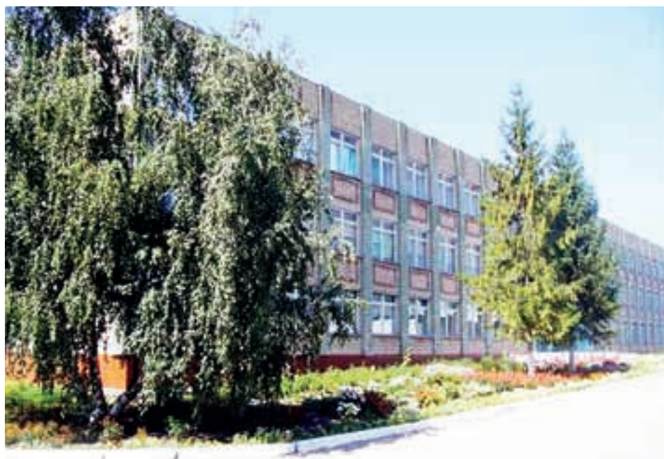
Образовательные учреждения становятся «Точками роста».

Ремонт школ разного профиля, внедрение новых обучающих технологий, поощрение лучших педагогов и школьников - из этих начинаний складывается картина мира, в центре которой стоят титанический труд, полная самоотдача учителей и успехи их воспитанников.