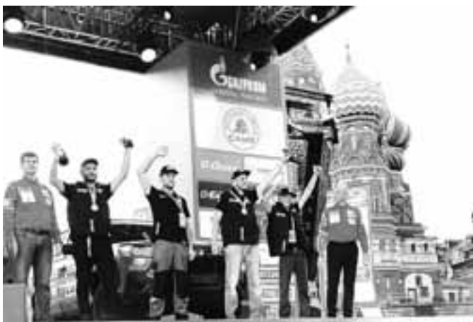
Балаковские гонщики празднуют свой успех.

По итогам ралли в спортивной дисциплине «ралли-рейд Ореп» команда Саратовской области заняла третье место.