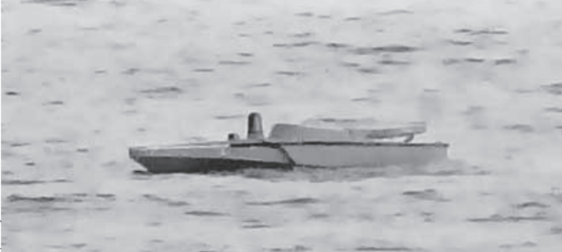
Крымский мост атаковали морские беспилотники, их Киев получает из Британии.

лоцманские и штурманские карты, дабы обезопасить проход военных кораблей и гражданских судов под мостом.