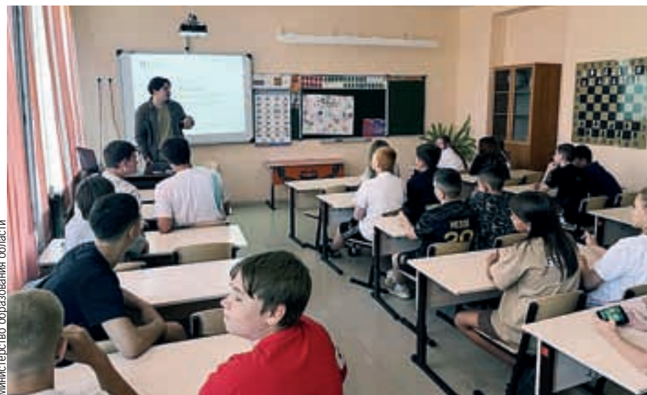
Саратовские школьники показали в прошлом учебном году высокие результаты.

Участниками встречи стали студенты колледжа. С одной стороны, они показали себя как профессиональные наставники, которым были вручены удостоверения о повышении квалификации, а с другой - как «наставляемые». Это те студенты колледжа, которые осваивают на предприятии рабочие профессии. Для ребят это большая возможность приоткрыть для себя огромный мир предприятия в рамках «Профессионалитета».