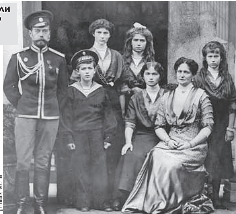
Николай II, цесаревич Алексей, великая княжна Татьяна, великая княжна Мария, великая княжна Ольга, императрица Александра Федоровна, великая княжна Анастасия (слева направо).