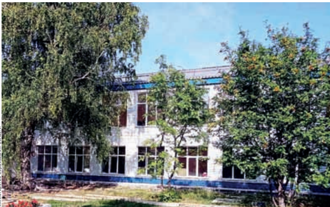
После ремонта школа становится современным центром образования.

- Группа неравнодушных родителей с первого дня следила за ходом работ, параллельно информируя об этом всех родителей учащихся в родительских чатах. Спрашивали мнение и принимали совместные решения по выбору красок, материалов. Результат нас очень обрадовал, особенно мы довольны заменой освещения в классах. Очень благодарны и безмерно рады, что наша школа смогла принять участие в программе и дети смогут обучаться в новых классах.