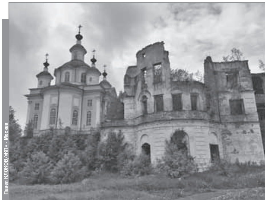
Вознесенский собор (слева) и Успенская церковь, которую тоже будут восстанавливать.