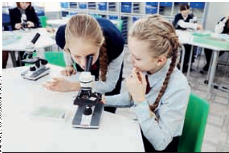
В образовательный процесс внедряются новые технологии.

Участие в образовательных программах самого высокого уровня поднимает муниципальные школы до уровня центров просвещения. Так,