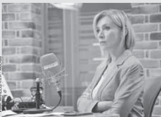
Мария Захарова: - К сделке можно вернуться, если она будет выполняться полностью.

- Потому что это ложь, помноженная на ложь. Дело в том, что 22 июля 2022 года в Стамбуле были подписаны два взаимовыясненных документа. Первый - это черноморская инициатива. Она заключалась в вывозе украинского продовольствия... А второй документ - это меморандум Россия - ООН по нормализации российского экспорта сельхозпродукции и удобрений. Это пакетное соглашение было инициировано в таком варианте генсеком ООН