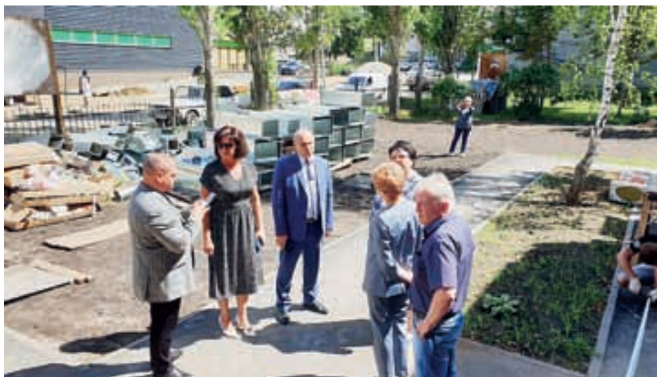
Модернизации школ искусств региона уделяется пристальное внимание.

Все это стало возможным в результате поставок самого современного оборудования. В «Точке роста» на сегодня завершаются поставки 14 цифровых лабораторий по физике, химии, экологии, биологии, шести наборов робототехники, 33