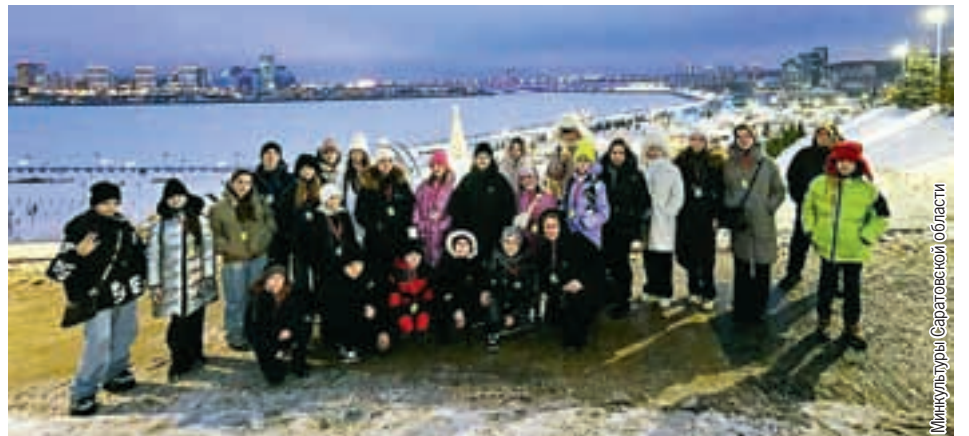
Дети смогли познакомиться с культурой, кухней региона, оценить местный колорит во время мастер-класса по приготовлению национальных блюд.

Напомним, что по итогам прошлого года обладателями именных губернаторских стипендий стали 75 одаренных детей из Саратова и тринадцати муниципальных районов региона.