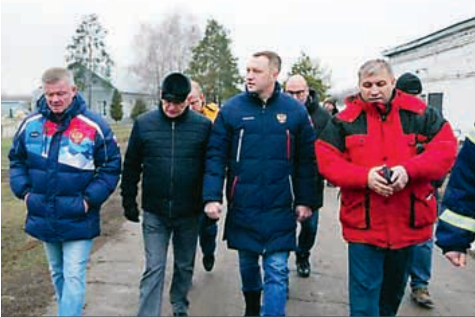
Состоялось очередное заседание оперативного штаба на месте возгорания в Энгельсе.