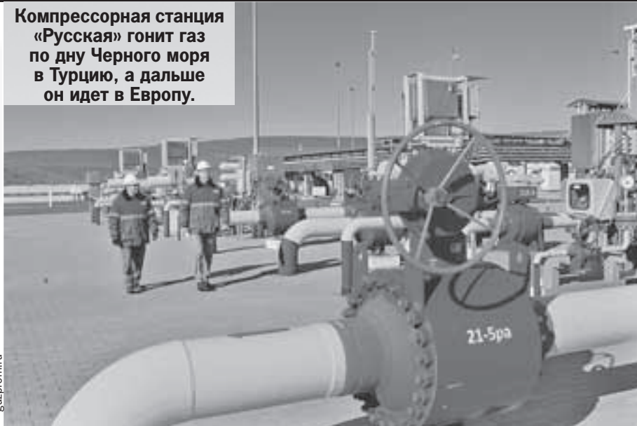
Компрессорная станция «Русская» гонит газ по дну Черного моря в Турцию, а дальше он идет в Европу.

Это далеко не первый подход Зеленского и Байдена к российскому «газовому снаряду». Началось все с подрыва «Северного потока» 26 сентября 2022 года. США и другие страны НАТО очень постарались свалить вину на Киев. Даже предъявили миру неких украинских дайверов-диверсантов,