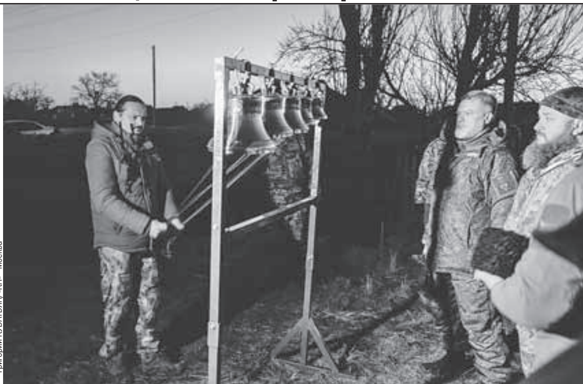
С виду походная звонница выглядит невзрачно, но звучит, как в настоящем храме.

Казаки из БАРС-32 стоят в обороне и планомерно уничтожают противника. Недавно на их позиции по-