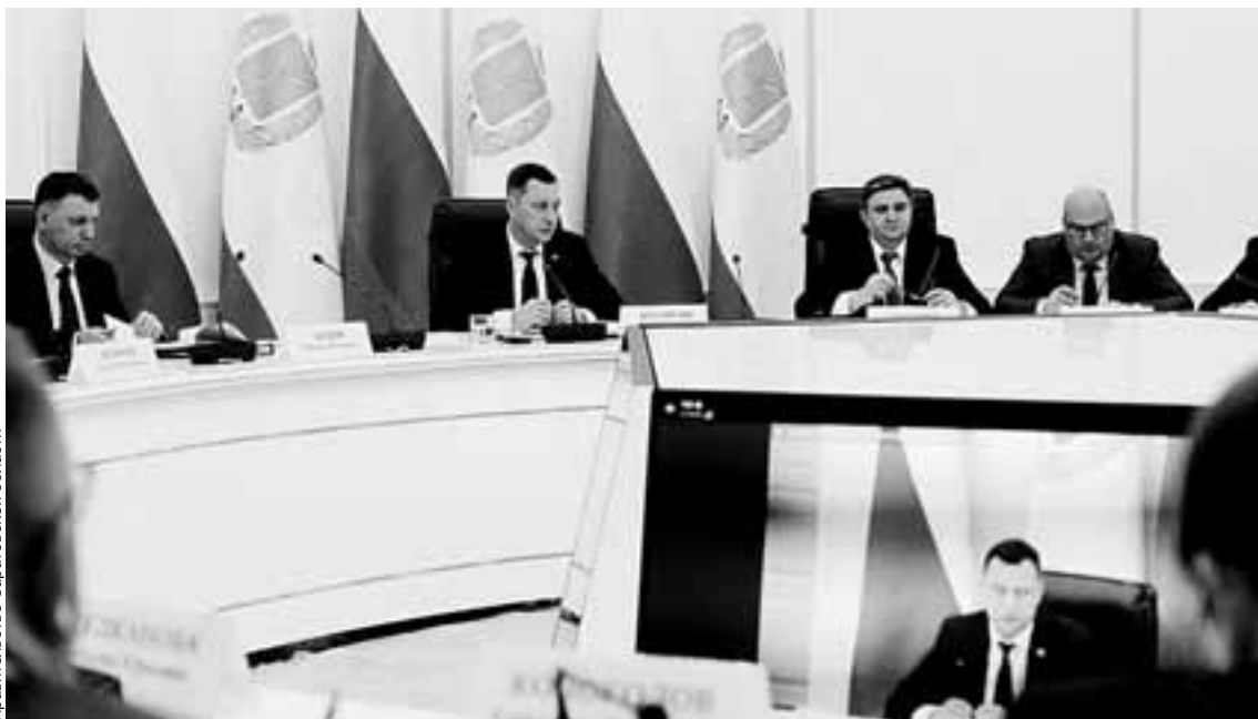
Одними из главных для обсуждения вопросов стали результаты личных приемов участников СВО и членов их семей.

Обсуждались и актуальные вопросы в области здравоохранения, которые до недавнего времени требовали решения. За 11 месяцев 2024 года смертность от болезней эндокринной системы по сравнению с аналогичным периодом 2023 года сократилась