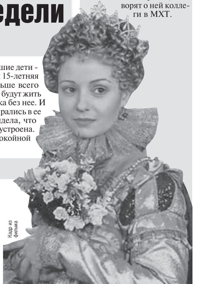
Прощайте, незабываемая королева Марго! (В сериале 1996 года.)

«Наша Женя, бесконечно талантливая и бесстрашная и столь же бесконечно сомневающаяся, непредсказуемая, предельно искренняя, настоящая всегда и во всем. Именно Женя - несмотря на безусловный авторитет, заслуги и юбилейные даты, в театре никто не звал ее Евгенией Владимировной. Ни в жизни, ни в творчестве она не успокаивалась, не бронзовела, в ней продолжала угадываться ершистая и ранним девичья-подросток из ее дебютного фильма «Клетка для канареек», - говорят о ней коллеги в МХТ.