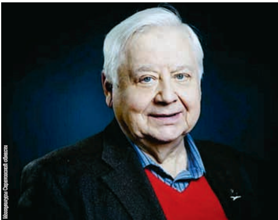
Минкультуры Саратовской области

Фестиваль предоставляет возможность окунуться в мир профессиональной актерской игры, уникальных постановок и творческой энергии.