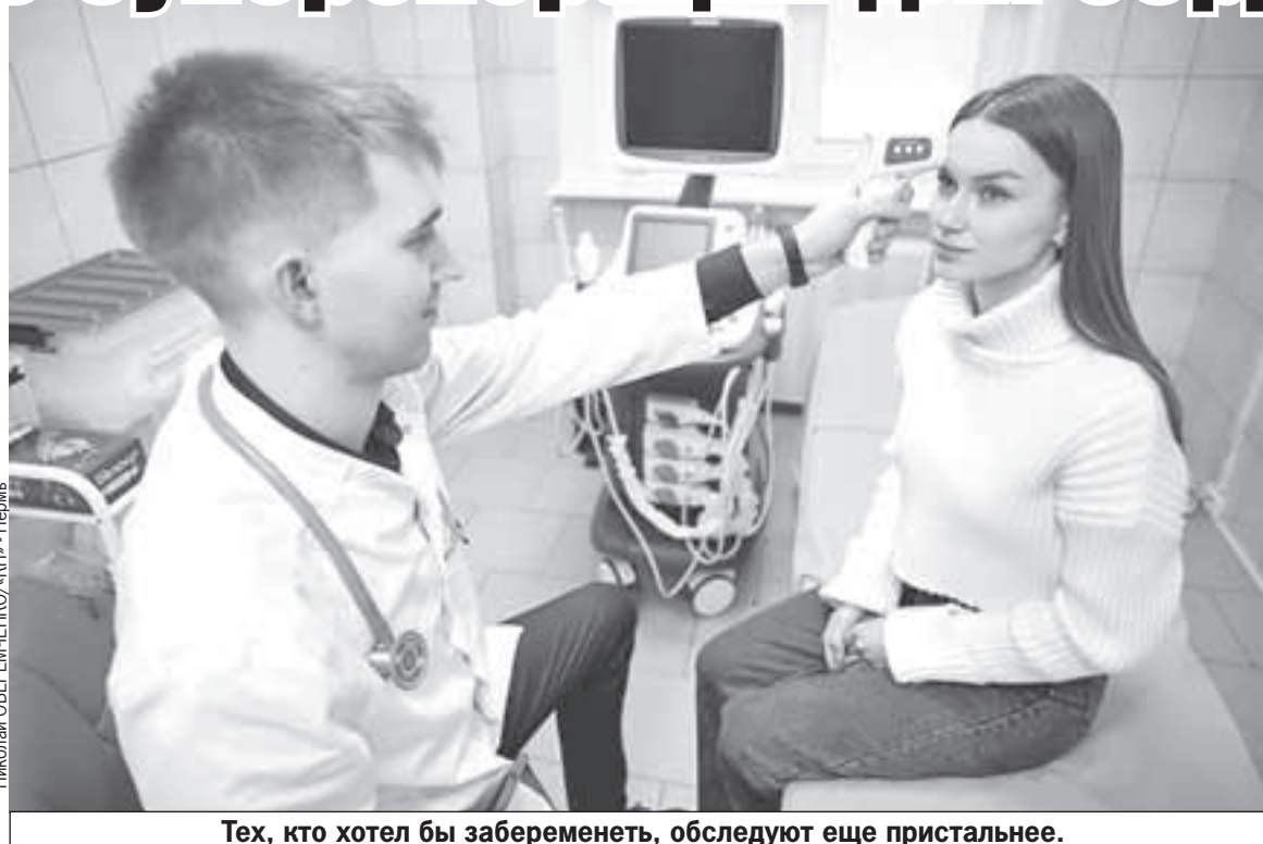
Тех, кто хотел бы забеременеть, обследуют еще пристальнее.