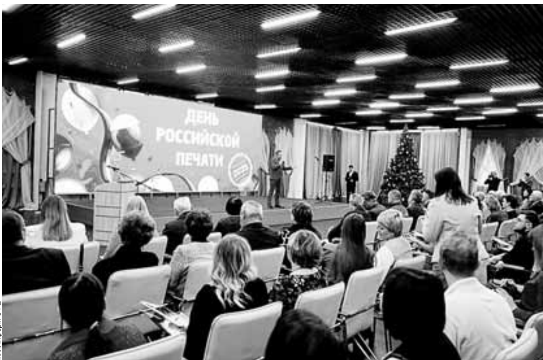
В ходе торжества были подведены итоги работы отрасли в 2024 году и поставлены задачи на 2025-й.

Пройдут тематические творческие и литературные конкурсы и интерактивные кинопрограммы, книгоиздательские и культурно-просветительские проекты, посвященные военной теме. А еще будет объявлен областной конкурс на лучший редакционный спецпроект, посвященный 80-летию Великой Победы. И журналисты станут активными участниками всех мероприятий.