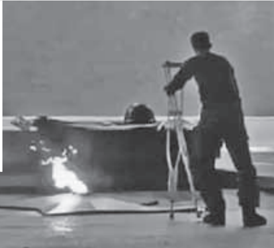
Кадр из видео

Эти кадры облетели все соцсети. А на фото слева вверху - Сидам на передовой.