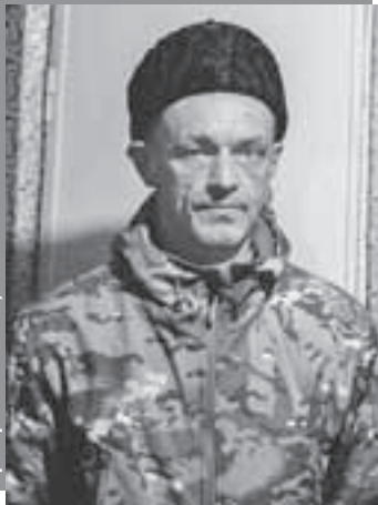
Григорий КУБАТЬЯН/«КП» - Москва

Юрий «Карета» борется с хунтой, захватившей власть на Украине, с 2014 года.