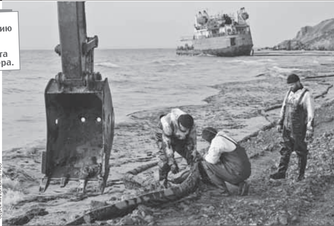
На месте нового разлива работает и тяжелая техника, и вручную мазут тоже собирают.

- С теми мощностями, которые есть сейчас, переработка займет около 20 лет, - сообщил член Совета по развитию гражданского общества и правам человека при губернаторе