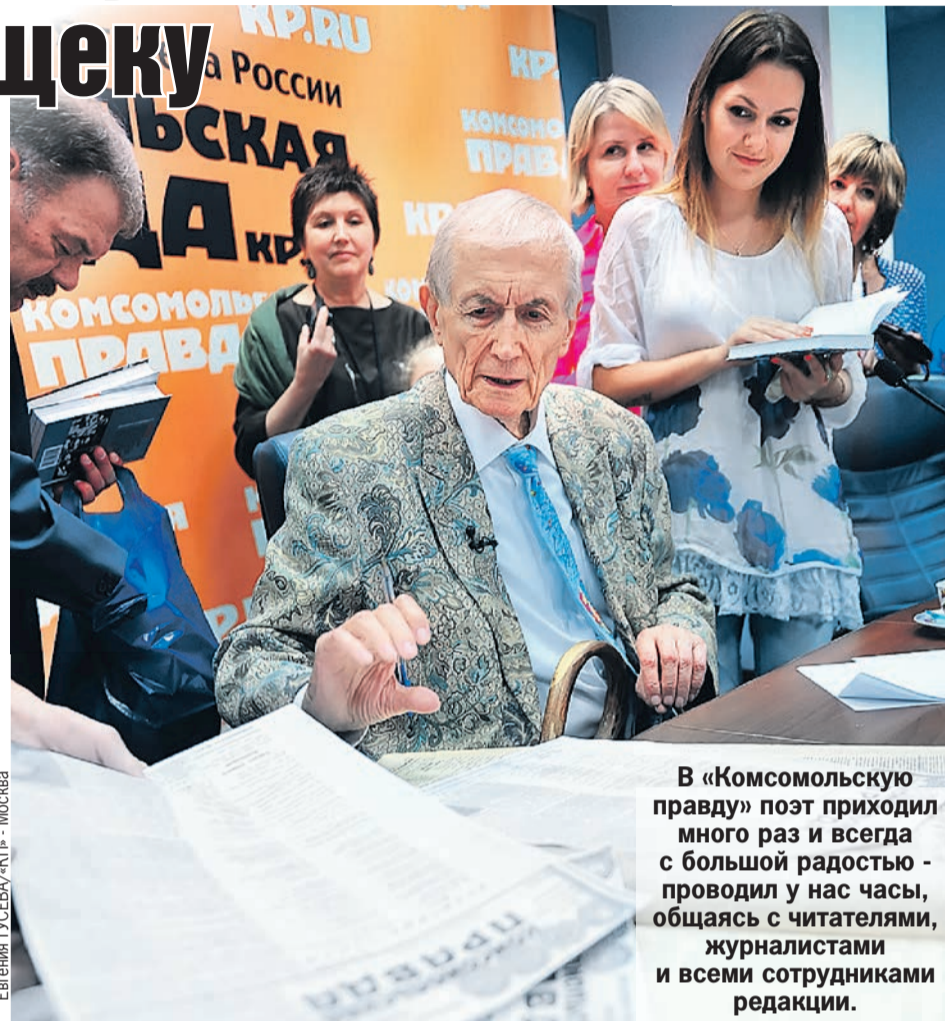
Евгений ЕВТУШЕНКО

Пазолини хотел его снимать в роли Христа. Бертолуччи чуть не рыдал ему в жилетку. А еще в его жизни были Эрнест Хемингуэй, Марлен Дитрих (разделась догола и залезла на стол в его московской квартире), Роберт Кеннеди (признавался Евтушенко, что хочет стать президентом, чтобы найти убийц своего брата), Жаклин Кеннеди (рассказала, что в тот момент, когда стреляли в ее мужа, по-