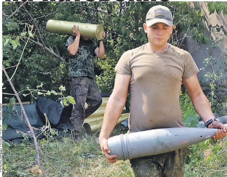
Снаряды маленькими не назовешь, но при точном попадании по украинской технике проблема контрбатареинной борьбы решается сразу.

В такую гряду металла превращается гаубица ВСУ после накрытия.