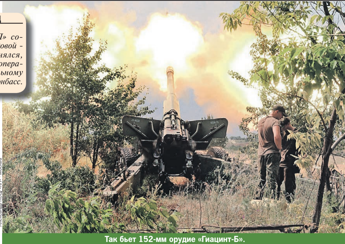
Так бьет 152-мм орудие «Гиацинт-Б».

Сегодня Киев прекрасно понимает, что рано или поздно эта линия будет прорвана - слишком зависимы города от сообщения между друг дру-