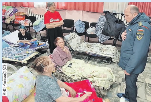
Глава МЧС Александр Куренков навестил людей в пункте временного размещения.

Кроме того, Путин поручил главе МВД не допустить мародерства в районах бедствия. И обеспечить охрану порядка, а также имущества граждан.