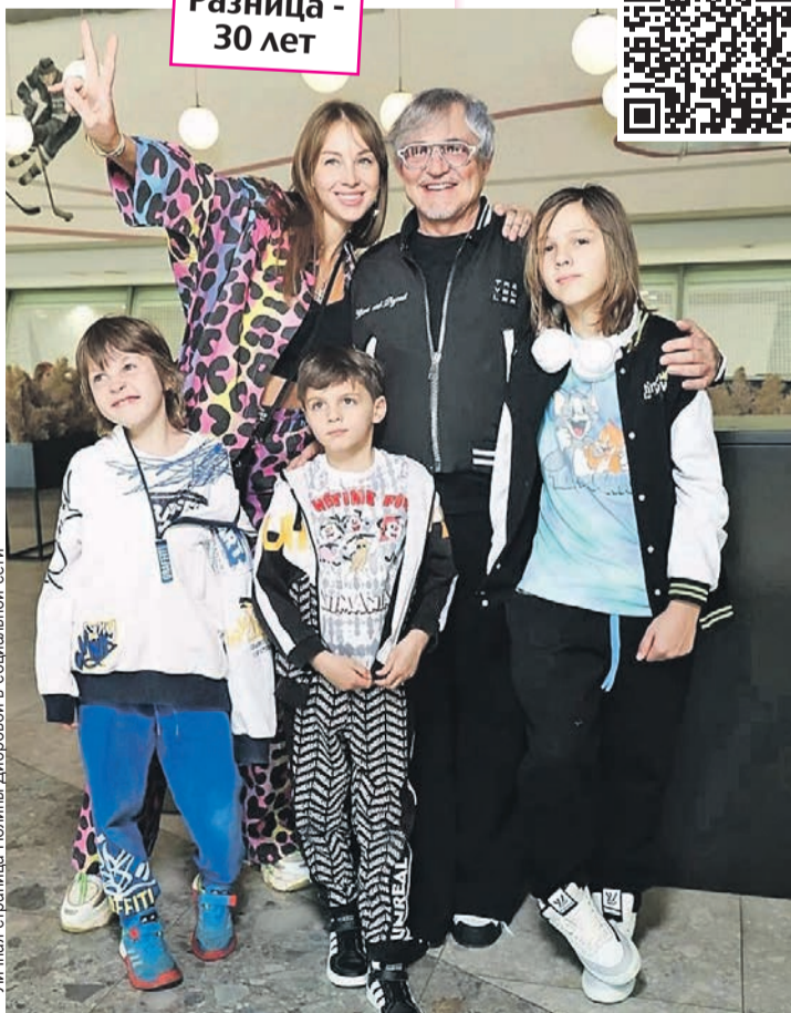
Личная страница Полины Дибровой в социальной сети