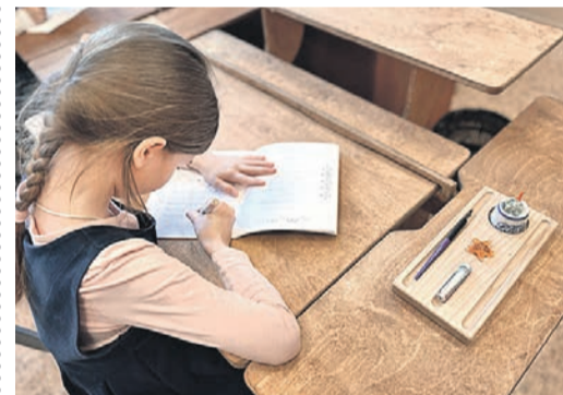
Семейный центр «Ладимир».

В Великом Новгороде создали классы по программе Русской классической школы.