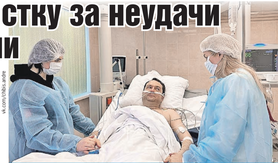
Губернатор Андрей Чибис выложил в соцсетях фото из больницы и написал: «Самое главное и дорогое - семья. Сейчас это ценю как никогда».