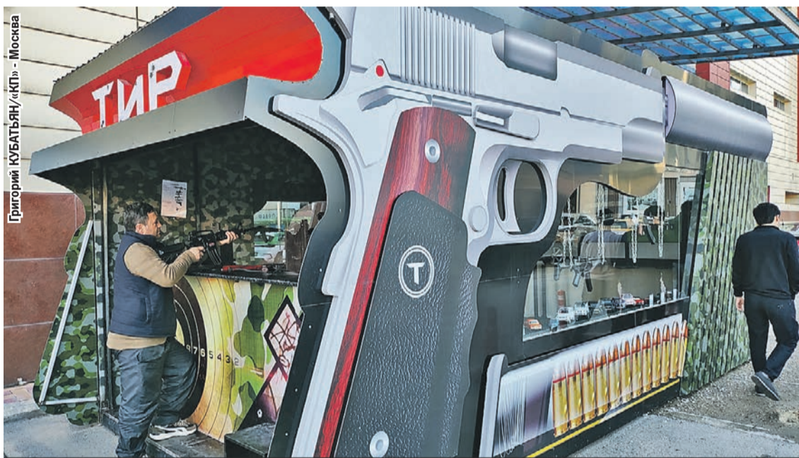
Если в Душанбе вам про кого-то скажут: «Он оружия в руках не держал, стрелять не умеет», это будет полуправдой. Тиров тут полно, и пострелять в них любят многие.

Решение есть. В России нужно реформировать миграционную систему, об этом уже и Путин сказал. А с Таджикистаном восстанавливать прежние экономические и культурные связи. Возвращать в республику русских специалистов, строить заводы. Но быть готовыми