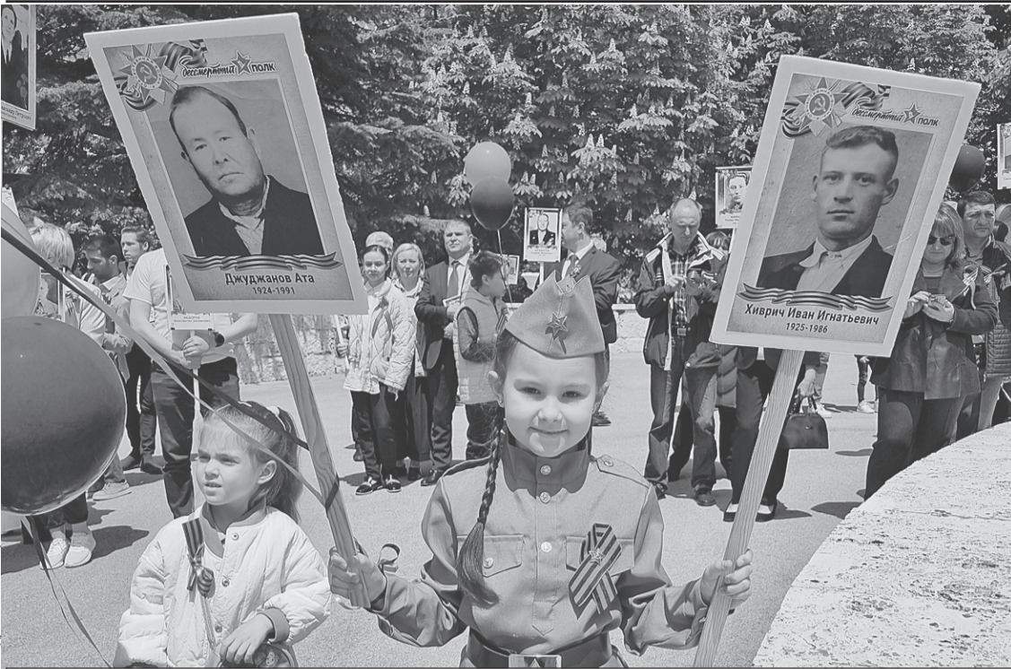
Несмотря ни на что, в Анкаре в этом году прошел «Бессмертный полк».

гий. - Они трудяги. Видишь бледного чудака, бредущего с пляжа, - он! Под зонтом программировал. Вот кого много - так это праздных балбесов. Деток от армии прячут. Напокупали в свое время недвижимости, теперь вспомнили, приехали. Сынкам по 17 - 18 лет, а с ними бабушка или тетюшка для контроля. Вот и живут на квартирах, домах, виллах. Пережидают. А прав батюшка.