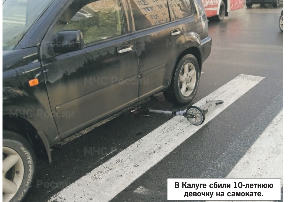
В Калуге сбили 10-летнюю девочку на самокате.

В Калужской области задержан 51-летний мужчина из Мурманска, приехавший 26 мая в Жиздру. Как сообщает региональное управление Следственного комитета, он до смерти избил своего отца, к которому заглянул в гости.