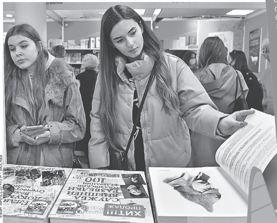
Иван МАКЕЕВ / «КП» - Москва

По анализу редакционной группы конкурса замечено, что конкурсанты почти не пишут о любви, приключениях и романтике, о чем во все времена мечтала и грезила юность. Зато их привлекают вопросы психологии, поиска себя, многие авторы уходят или в мрачную антиутопию, или в мир фантазий. Также приходят работы на темы патриотизма, созидания, на реальные триггеры в обществе - темы военных конфликтов и пандемий.