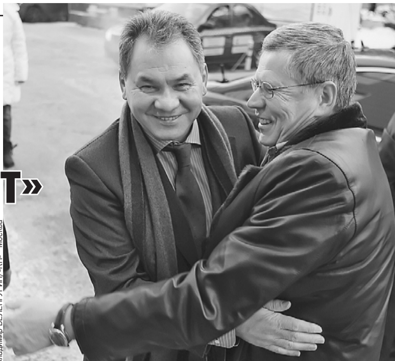
С министром обороны Сергеем Шойгу руководителя «КП» связывала давняя дружба, в том числе и по линии Русского географического общества.

Семь лет назад именно он заметил парня пишущего в ЖЖ заметки о сельском хозяйстве, и сказал: «Ты, парень, далеко пойдешь, давай к нам печатать».