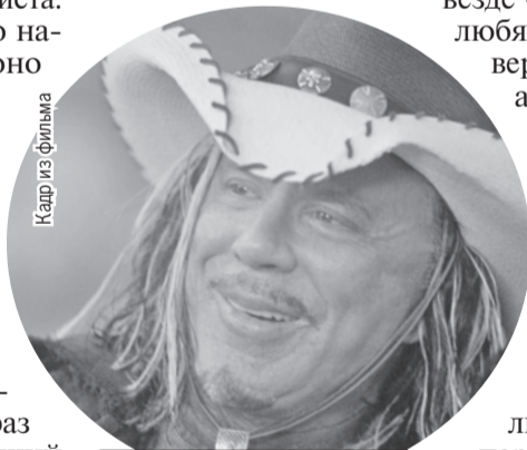
Бокс и неудачная пластика лишили Микки его неотразимой внешности.

пору, писала: «У него есть напор, есть магнетизм, и при этом - неожиданно - чистая, милая улыбка». Одна большая картина следовала за другой: « Жар тела » Лоуренса Каздана , « Бойцовая рыбка » Коппопы , « Год дракона » Майкла Чимино . Потом появились « 9 1/2 недель » - они казались неприличными не только посетителям советских видеосалонов, но и американским прокатчикам и пролежали на полке три года. А потом, перед выпуском,