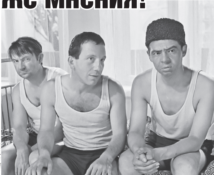
Как говорил легендарный Василий Алибабаевич из «Джентльменов удачи»: «Все побежали, и я побежал». Это и есть самая лаконичная формулировка психологического «эффекта толпы».

«Комсомолка» вспомнила пять самых известных социальных экспериментов, которые показывают, что заставляет одних людей подчиняться другим и обманывать самих себя.