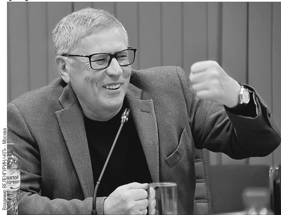
Владимир ВЕЛЕНГУРИН/«КП» - Москва