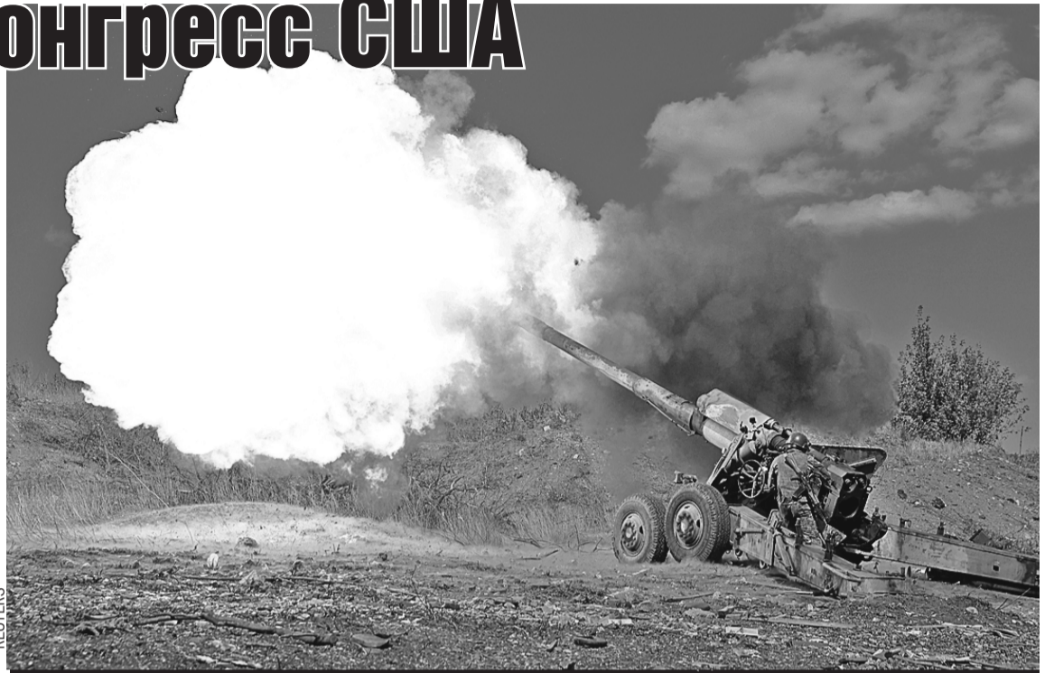
На Изюмском направлении нашей артиллерии пришлось лицом к лицу столкнуться с НАТО - их инструкторами и даже солдатами. Теперь фронт стабилизировался.

- Оружия у нас много. С точки зрения людей... Очевидно, что если ты воюешь в режиме добровольческой армии, а противник проводит тотальную мобилизацию, он имеет превосходство. А это затрудняет достижение целей спецоперации. Поэтому в обществе постоянно идут дискуссии: «Нужна ли нам