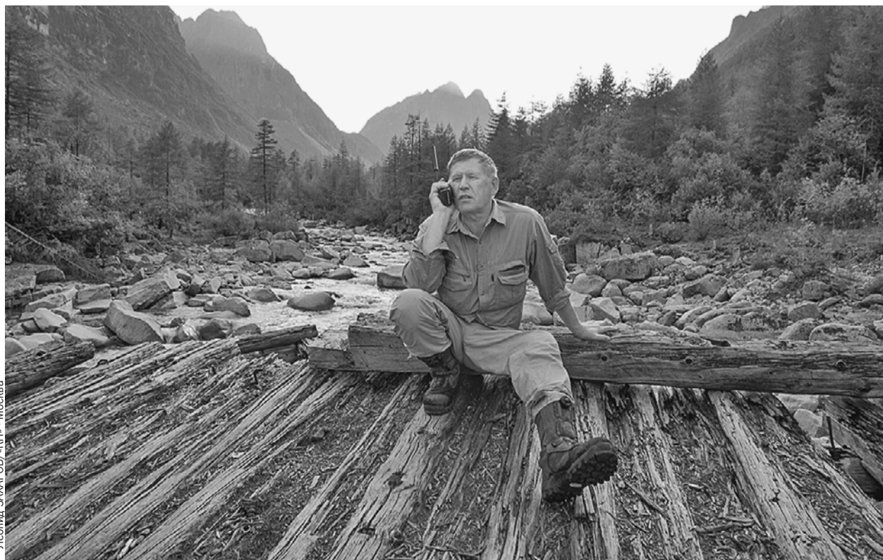
Главный редактор обожал путешествия по самым труднодоступным местам. На этом фото он связывается с редакцией из Мраморного ущелья, где в Читинской области добывали первый советский уран.