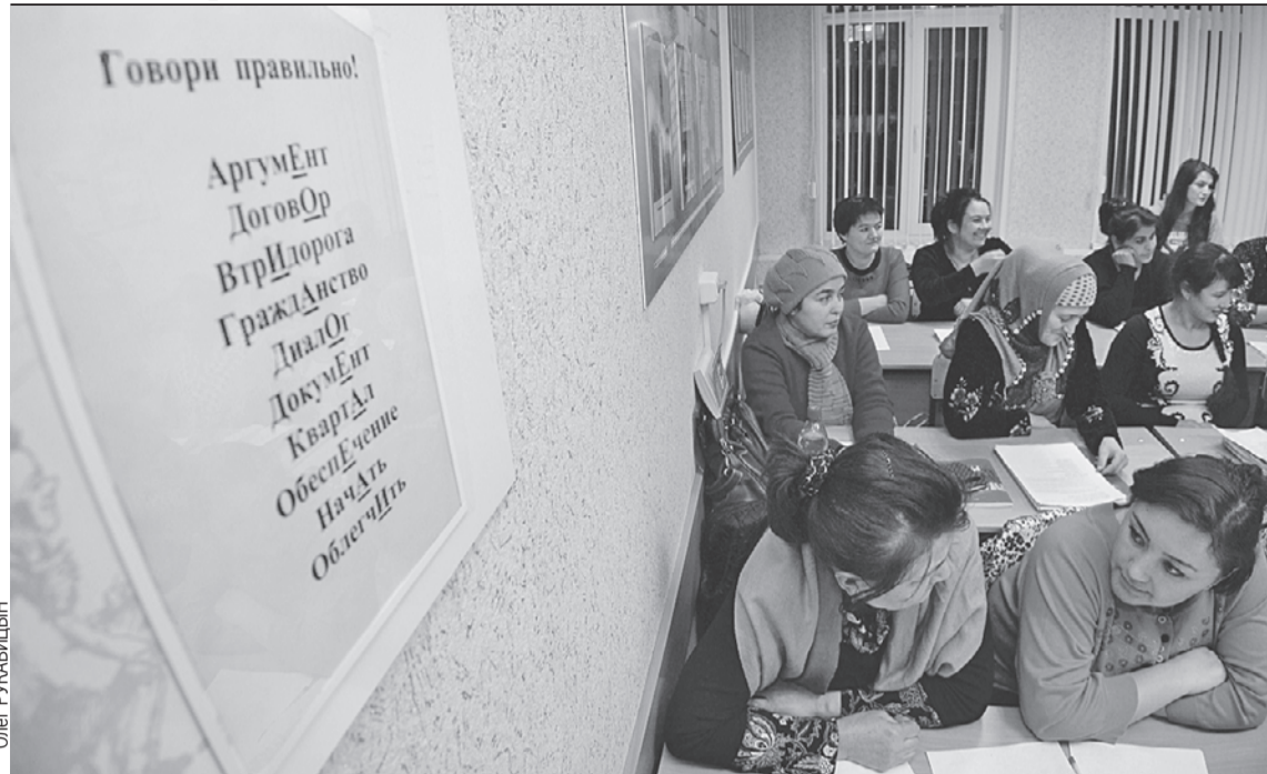
Экзамены по русскому языку теперь контролирует государство.

ях миграции - 11,7%. Две цифры: в целом по стране средняя зарплата с 2012 по 2024 год выросла в 3,1 раза, у нас - в 1,4 раза. За этот же срок некомплект увеличился в четыре раза. Более десяти лет заработная плата не индексировалась по коэффициенту-дефлятору. Это, конечно, отразилось.