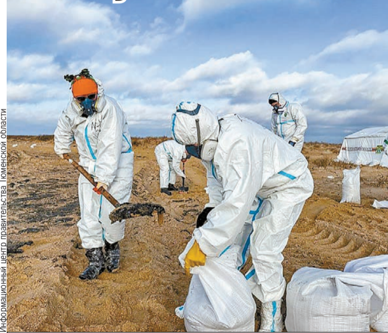
Группа из 25 волонтеров отправилась в Анапу месяц назад.

ры приходили на пляж и проходили инструктаж по технике безопасности. После этого им выдавали индивидуальные средства защиты и сорбенты от сотрудников Центра медицины катастроф, и ребята приступали к работе: снимали загрязненный мазутом песок, собирали его и упаковывали в мешки.