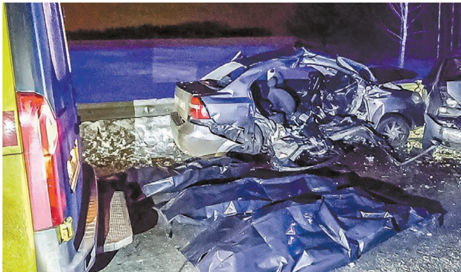
Легковушку буквально разорвало на части от удара.

- Прибыв на место ДТП, сотрудники областной службы спасения немедленно начали ликвидацию последствий