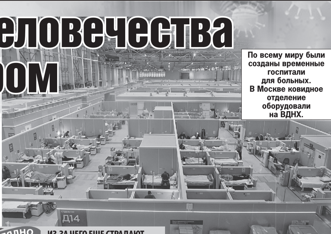
По всему миру были созданы временные госпитали для больных. В Москве ковидное отделение оборудовали на ВДНХ.

ВЕЧНО ЗАЛОЖЕННЫЙ НОС И КОМ В ГОРЛЕ - После ковида к нам часто приходят пациенты с жалобами на не проходящую боль в горле, першение, кашель, бесконечно заложенный нос, ухудшение слуха, - перечисляет врач высшей категории, оториноларинголог-фониатр Научно-клинического центра № 2 Российской научно-клинической академии Б. В. Петровского (РНЦХ) Дмитрий Шубин. - Такие симптомы появляются, во-первых, потому, что COVID-19 приводит к обострению хронических воспалительных заболеваний верхних дыхательных путей. Это хронические синуситы, тонзиллиты, фарингиты и так далее. Также есть пациенты, которые жа-