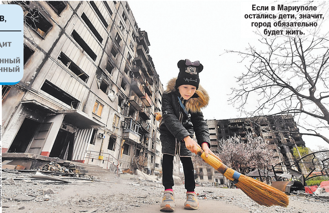
Если в Мариуполе остались дети, значит, город обязательно будет жить.

Как приходит в себя освобожденный и разрушенный город.