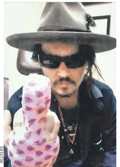
В 2015-м осколком бутылки Деппу отрезало кусочек пальца. У экс-супругов полярные мнения насчет того, по чьей вине это произошло.

Июнь 2018 года. Депп подает на жену в суд за клевету, а заодно утверждает, что в их отношениях с Херд агрессором была именно она. В ходе процесса на свет всплывают подробности одна живописнее другой. По версии актера, 22 апреля 2016 года не он ударил жену, а наоборот. В день, когда Эмбер исполнилось 30, муж, вместо того чтобы принять участие в торжественном ужине, залез в кровать и стал читать. По его словам, Херд пыталась на него накричать, и он просто ретировался в спальню. Но она добралась до кровати и ударила его. А позже то ли Эмбер, то ли кто-то из ее друзей испражнился в их