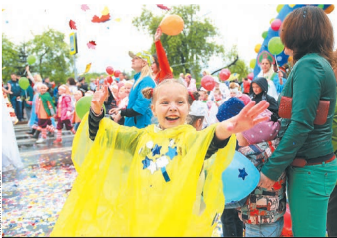
Юных жителей края ждет насыщенная программа.

Так, во Владивостоке юные приморцы могут прийти на праздник «Счастье, солнце, дружба - вот что детям нужно» (3+) на территории исторического парка «Россия - моя история» (Аксаковская, 12). С 11.00 до 19.00 детей ждут различные игры и мастер-классы, рисование на асфальте и камнях, аквагрим, спектакли и полоса препятствий.