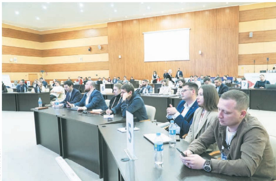
Конкурсанты вскоре отправятся на Камчатку.

Напряженный очный этап прошли 55 человек. Именно они стали участниками программы «Муравьев-Амурский 2030». Теперь будущие специалисты погрузятся не только в теорию госуправления. Они вникнут в жизнь территории Дальнего Востока, с лихвой ощутят и поймут это место: на вулканах Камчатки, в якут-