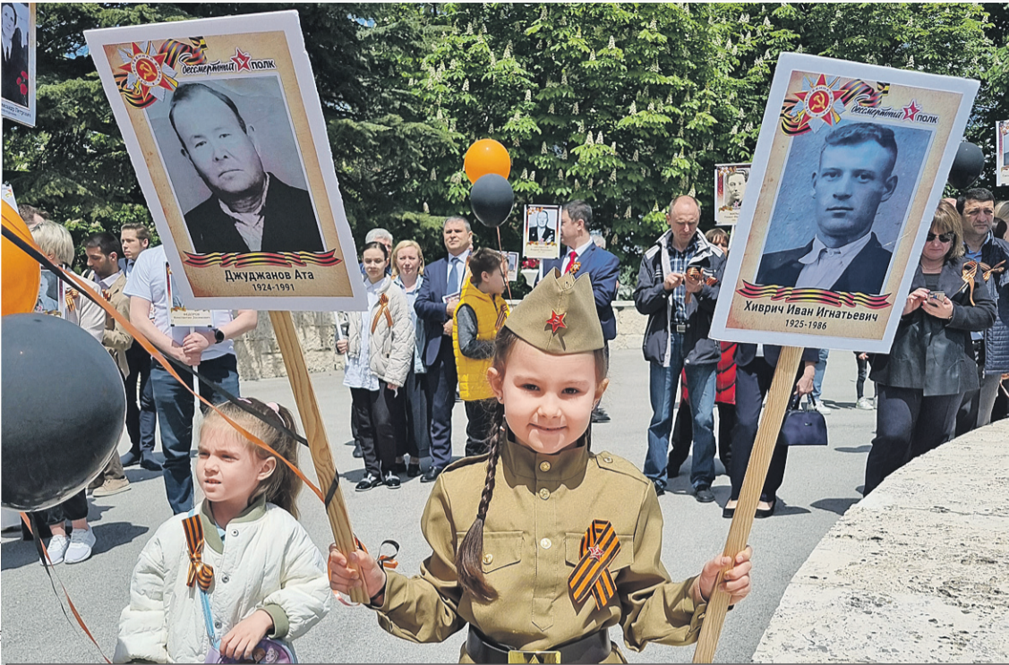
Несмотря ни на что, в Анкаре в этом году прошел «Бессмертный полк».

гий. - Они трудяги. Видишь бледного чудака, бредущего с пляжа, - он! Под зонтом программировал. Вот кого много - так это праздных балбесов. Деток от армии прячут. Напокупали в свое время недвижимости, теперь вспомнили, приехали. Сынкам по 17 - 18 лет, а с ними бабушка или тетюшка для контроля. Вот и живут на квартирах, домах, виллах. Пережидают. А прав батюшка.