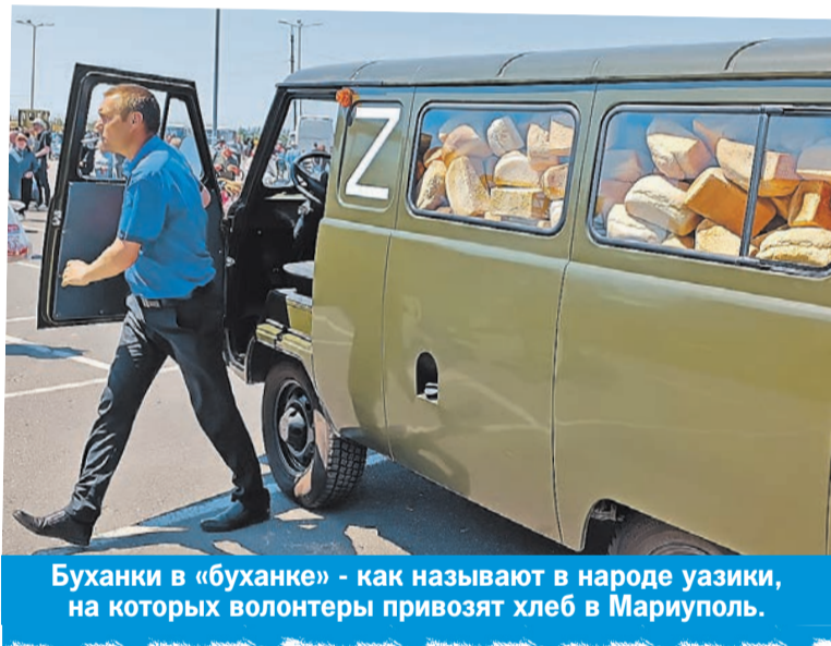
Буханки в «буханке» - как называют в народе уазики, на которых волонтеры привозят хлеб в Мариуполь.

У соседней пятиэтажки, разбитой в хлам, с висящими на арматурах балконах, сидит горстка женщин и стариков, они в складчину готовят еду. На огне посреди кирпичей почерневший