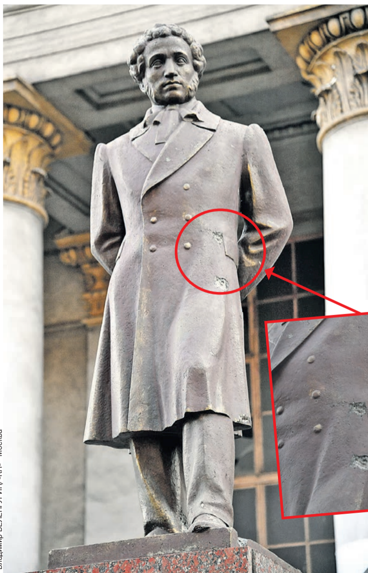
Пушкин в Мариуполе тоже пострадал за русскую идею. Шальные пули угодили поэту в живот и бедро.