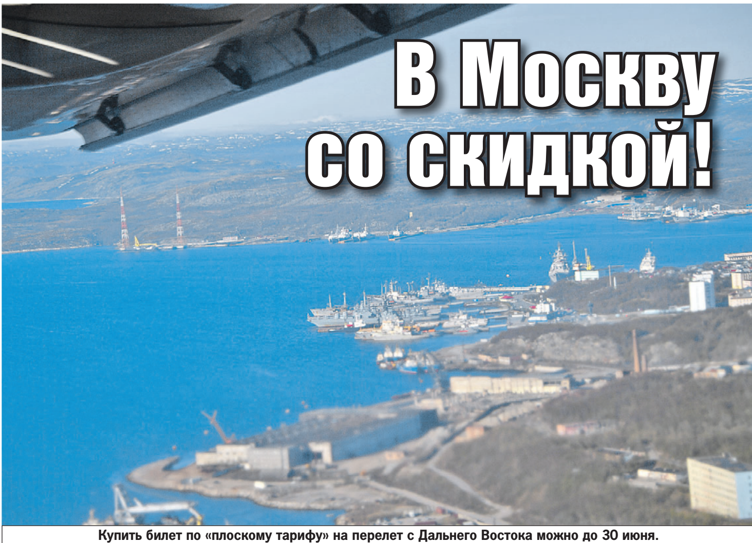
Купить билет по «плоскому тарифу» на перелет с Дальнего Востока можно до 30 июня.

Где дальневосточникам ОТДОХНУТЬ ЭТИМ ЛЕТОМ