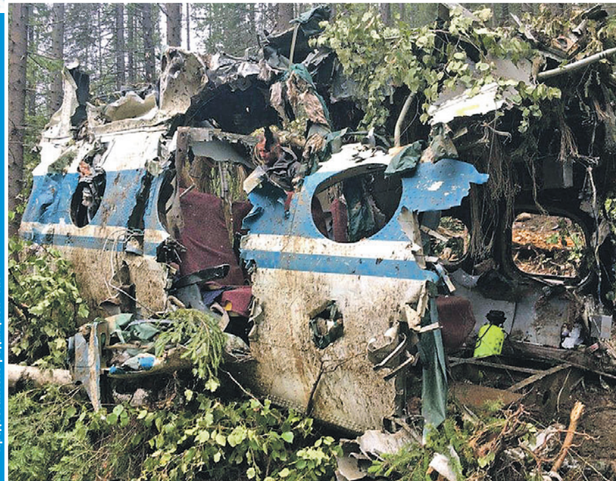
Ради съемок купили два самолета. Картину создавали в Пермском крае и Москве.