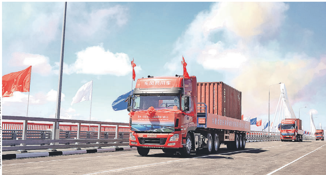
По мосту проехали первые грузовики - восемь машин из Китая и восемь из России.

В торжественной церемонии участвовали полпред Президента РФ в ДФО Юрий Трутнев, министр транспорта РФ Виталий Савельев, министр по развитию Дальнего Востока и Арктики Алексей Чекунков, а также высокопоставленные китайские чиновники. А на месте присутствовали губернатор провинции Хэйлуцзян Хуа Чаншэн и губернатор Амурской области Василий Орлов.