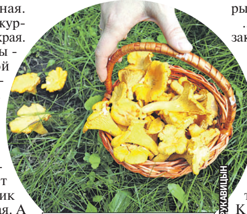
В лесах растет множество видов грибов, встречаются и целебные.

Но у нее, как и у черемши, есть свой опасный дублер - вороний глаз. Однако отличить плоды друг от друга просто.