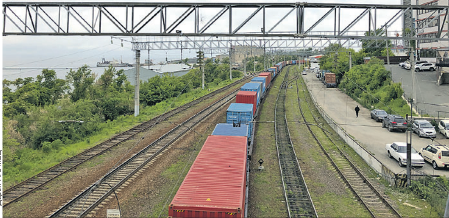
Западные рынки закрываются, поэтому логистику планируют развернуть в противоположном направлении.