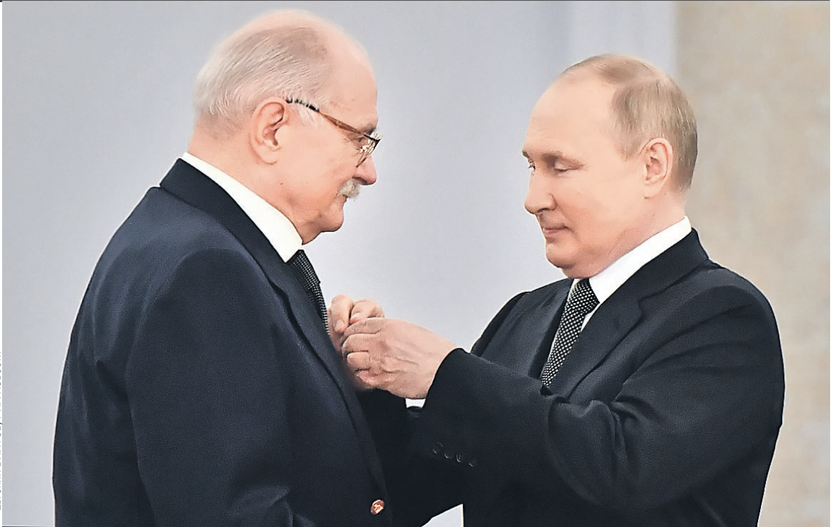
Владимир Путин с улыбкой прикрепил на лацкан пиджака Никиты Михалкова золотую медаль «Герой Труда» на церемонии вручения высших наград и госпремий за выдающиеся достижения.