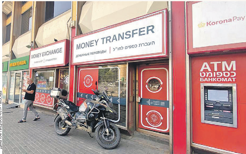
Дина КАРПИЦКАЯ/«КП» - Москва

Тема «паспортного» туризма русских, украинцев и белорусов на слуху здесь вот уже несколько лет, после скандального расследования одного из местных СМИ. Они раскопали и опубликовали целую