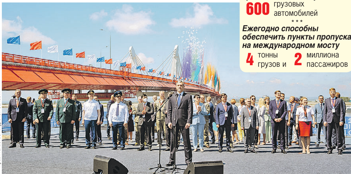
Открытия моста ждали два года - ввести его в эксплуатацию раньше помешала пандемия.