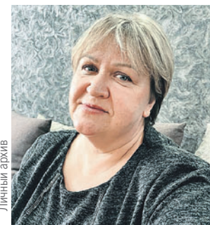
Руслан НОВИКОВ («КП» - Владивосток)

Отважная женщина спасла от хищника три жизни.