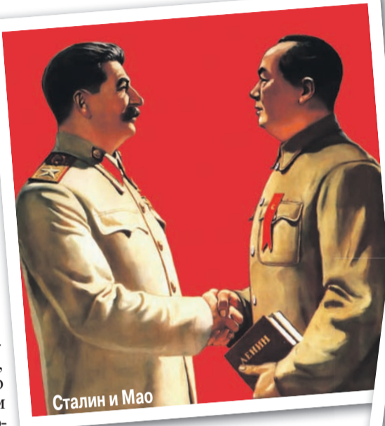
Сталин и Мао

На основе таких данных специалисты - психиатры, психологи, физиологи, эндокринологи, терапевты-диагносты - с большой достоверностью могут составить психологи-