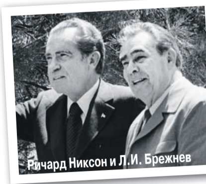
Ричард Никсон и Л.И. Брежнев

Никита Хрущев, пришедший к власти в Советском Союзе после смерти Сталина, первым делом закрыл ненавистную секретную лабораторию, а в архивах изъясил и уничтожил всю информацию о лаборатории, ее руководителе и результатах работ. Поговаривали, что он был просто взбешен собственным