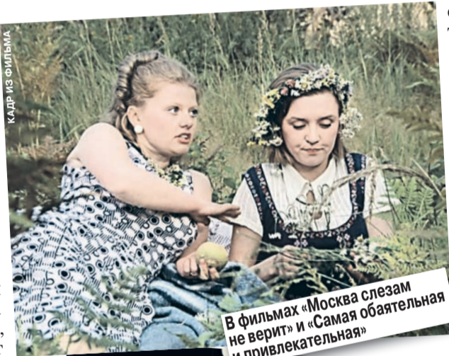
В фильмах «Москва слезам не верит» и «Самая обаятельная и привлекательная»