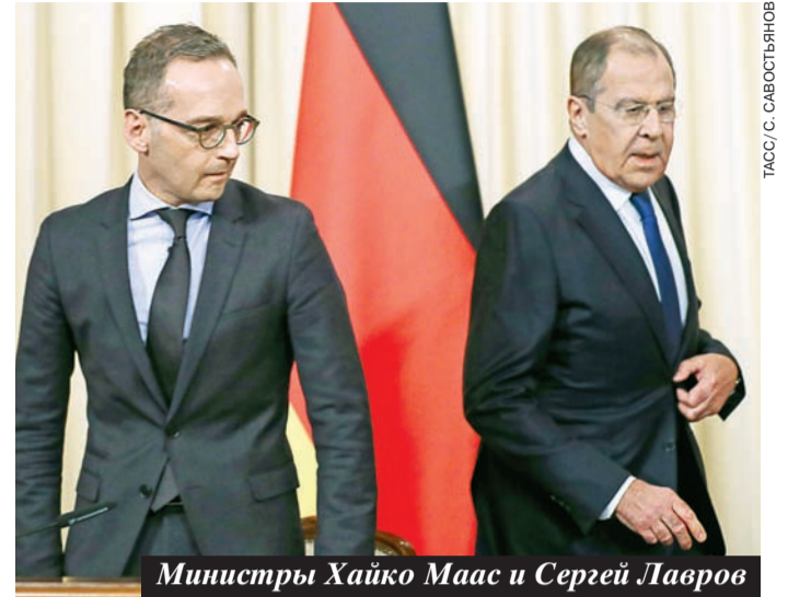
Министры Хайко Маас и Сергей Лавров

В Европе не готовы на несметные затраты, которые потребуются для размещения батарей ПВО для защиты от российских крылатых ракет, тогда как размещенные сейчас системы рассчитаны на баллистические и не могут перехватывать низко летящие цели. Потребуется огромное количество установок типа «Пэтриот» из-за их небольшой зоны действия. Кроме того, США не предлагают никакой