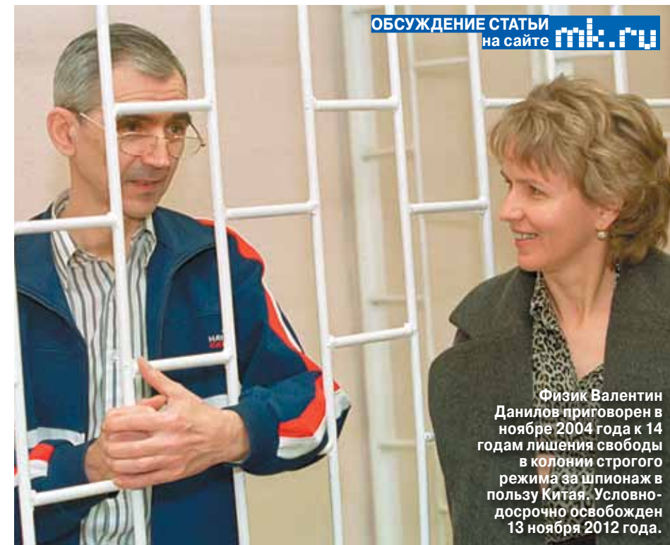
ОБСУЖДЕНИЕ СТАТЬИ на сайте mk.ru

Получить право на приобретение любого разрешенного гражданского оборота оружия,