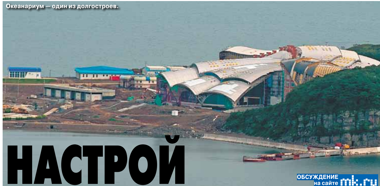
Океанариум — один из долгострояв.

В общем, если есть деньги, можно жить. Хотя это как-то и не по-студенчески. Комната стоит от 2,5 до пятнадцати тысяч в месяц (если хочется номер люкс). Завтрак-обед-ужин по сто