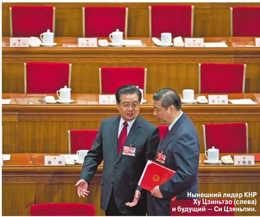
Нынешний лидер КНР Ху Цзиньтао (слева) и будущий — Си Цзиньпин.

Мы все оказываемся в роли заложников архаической политической системы,